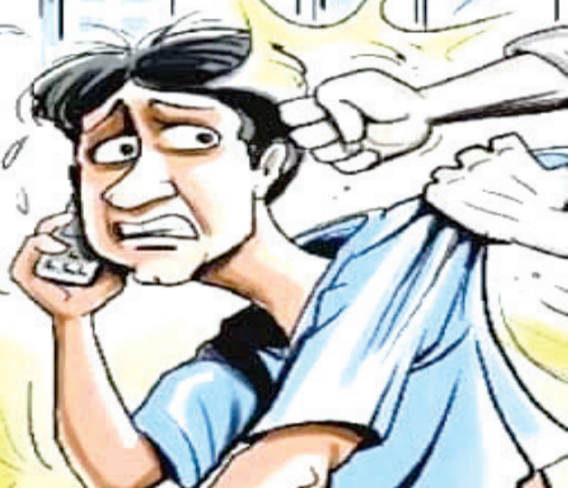
વ્યાજબીરો દંપતિએ ઘરમાં ઘુસી મહિલાને માર મારી ખૂનની ધમકી દીધી ત્રીસ સામે છવ્વીસ હજાર ચુકવી દીધા, વધુ માંગી ધમાલ મચાવી

રાજકોટ, તા. ૪ તાજેતરમાં રાજકોટના એક પોલીસ સ્ટેશનમાં સગીર આરોપીના વાળ હાથેથી ખેંચી કુરતા આચરવામાં આવી હતી. આ ઘટનાએ ચકચાર મચાવી દીધી હતી. એફઆઈઆર દાખલ થતાં કાર્યવાહી થઈ હતી. દરમિયાન હવે કચ્છમાં એક ઘટનાએ ખળભળાટ મચાવી દીધો છે. જેમાં ભુજ તાલુકાના સરહદી ખાવડા પંથકના અને ગામના સીમ વિસ્તારમાં બે યુવક પર અમાનુષી અત્યાચાર ગુજારવામાં આવ્યો હતો. સ્થાનિક લોકોએ રોમીયોવીરી ક્યાની શંકા રાખી યુવકોના માથાંનું મુંડન કર્યું, અર્ધ મૂછો કાપી અને અને ગુદાના ભાગે મરચાનો પાઉડર નાખી નિર્દયાથી માર માર્યો હતો. આ ઘટનાના વીડીયો સોશિયલ મીડિયા પર વાઈરલ થતાં સમગ્ર જિલ્લામાં ચકચાર મચી ગઈ છે અને પોલીસે એફઆઈઆર દાખલ કરી તપાસ શરૂ કરી છે.