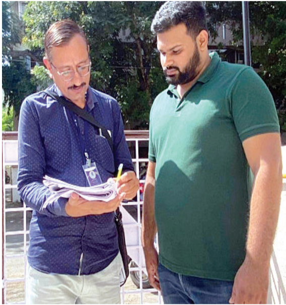
બરા પ્રશ્નો ઊભા થયા છે જેમકે મતદારના જરૂરી છે ત્યારે હાલની સ્થિતિને ધ્યાને લઈ નામ, સરનામા કે અન્ય વિગતોમાં સુધારો કેટલામાં ફેરબદલ કરવામાં આવ્યો છે તે સૌથી મહત્વની વાત છે ત્યારે નામમાં ભૂલ ધરાવતા અથવા તો મતદાર સ્થળાંતરિત થયા હોય તો તે

રાજકોટ, તા. ૪ સમગ્ર રાજ્યમાં ચૂંટણી પંચ દ્વારા સ્પેશિયલ સમરી રિવિઝનની કામગીરી એટલે કે મતદાર સુધારણા કામગીરી શરૂ કરી દેવામાં આવી છે ત્યારે ગઈકાલથી બુધ લેવલ ઓફિસર દ્વારા ઘરે ઘરે જઈ સર્વે હાથ ધરવામાં આવ્યો અને આ કામગીરી હજુ પણ આગામી દિવસોમાં યથાવત રીતે ચાલતી રહેશે ત્યારે જાણકાર વર્તુળોને ચૂંટણી પંચના દિશા નિર્દેશ અનુસાર જે વાત સામે આવી રહી છે તે મુજબ આ કામગીરીનો હેતુ એ જ છે કે મતદાર યાદીને સંપૂર્ણપણે શોધ અને અપડેટ કરવામાં આવે ત્યારે બુધ લેવલ ઓફિસર ઘરે ઘરે જઈને એન્યુમેરેસન ફોર્મ ભરાવવામાં આવી રહ્યું છે. એટલું જ નહીં હાલ જે વિગતો મળી રહી છે તે મુજબ જે લોકોના નામ શંકાસ્પદ જણાશે તેમને નોટિસ આપી નામકમી કરવામાં આવશે ત્યારે આ કામગીરી અંગે હજુ પણ ખાસ એવો સમય લાગી શકશે અને મળતી માહિતી મુજબ બુધ લેવલ અધિકારી એક મતદારના ઘરે યાર વખત મુલાકાત લેશે. હાલ મતદાર યાદીને લઈને ઘણા