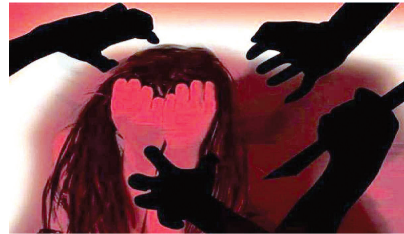
બીજી ઘટનામાં ખેતરમાં શાકભાજી લેવા ગયેલી મહિલાની ખેતરના માલિકે કરી લીધી છેડતી

તેની મિત્રતા વાપીના રાજ વર્મા સાથે હતી, જે પણ તે જ કારખાનામાં કામ કરતો હતો. કારખાનામાં આવવા-જવાની વચ્ચે તેમની ઓળખ નજીકની સોસાયટીમાં રહેતી અને એ જ પ્રકારનું કામ કરતી રિક્ષાચાલકની બે સગીરા સાથે થઈ હતી. ધીમે-ધીમે આ મિત્રતા પ્રેમ સંબંધમાં પરિવર્તિત થઈ ગઈ હતી. આ દરમિયાન બંને યુવકોએ સગીરાઓને લગ્નની લાલચ આપીને પોતાના વિદ્યાસમાં લીધી હતી અને તેમને ભગાડી જવાનું આયોજન કર્યું હતું. બાદ બંને યુવકો સગીરાઓને લગ્ન કરવાના બહાને સુરતથી ભગાડી ગયા હતા. દીકરીઓ મોડી સાંજ સુધી ઘરે પરત ન કરતાં ચિંતિત પરિવારે કારખાનામાં તપાસ કરી હતી. પરંતુ ત્યાંથી જાણવા મળ્યું કે તેઓ તે દિવસે કામ પર આવ્યા નહોતા.