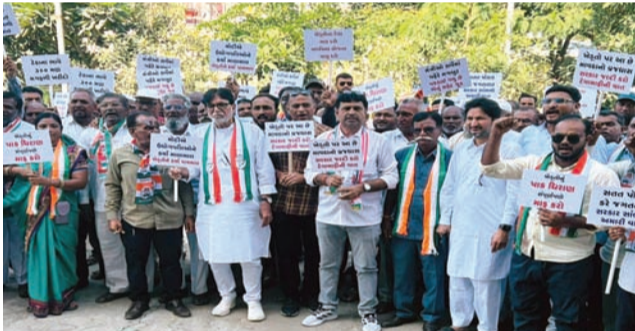
પશુઓના ઘાસચારા સહીતના ખરીફ પાકોને ખુબ જ મોટું નુકસાન થયું છે. ખેડૂતોના મોઢામાં આવેલા કોળીયો જાણે છીનવાઈ ગયો છે. એક બાજુ કુદરત ઝૂકી છે તો બીજી બાજુ સરકારે ખેડૂતોના પાયમાલ કરવાનું જાણે મન બનાવી લીધું હોય તે રીતે ગુજરાતમાં છંછી ઊંડી સીઝનમાં વાવાઝોડા, અતિવૃષ્ટિ કે કમોસમી વરસાદના ભોગ બનેલા ખેડૂતને રાહત પેકેજના માત્ર જાહેરાત કરીને સંતોષ માની લ્યે છે. જ્યારે વાસ્તવમાં ખેડૂતોને ચુકવવાનું થાય ત્યારે ફરેલી જાહેરાતના ૩૦ થી ૩૫

રાજકોટ, તા. ૬ સમગ્ર ગુજરાતમાં હાલ માવઠાની જે અસર જોવા મળી રહી છે તે અસહ્ય છે કારણ કે ખેડૂતોને જે પાક નુકસાન થઈ છે તે અકલ્પનીય છે અને આર્થિક રીતે જાણે ખેડૂત પાઈમાલ થઈ ગયો હોય તેવી સ્થિતિનું નિર્માણ પણ થયું છે. આ અંગે કોંગ્રેસ પાર્ટી ભાજપ ઉપર આક્ષેપ કરી રહી છે કે સમયસર અને પુરતું રાહત પેકેજ જાહેર કરવામાં આવે તે ખૂબ જરૂરી છે નહીં કે ખેડૂતોની મજાક આ બાબતે હાલ કોંગ્રેસ દ્વારા ખેડૂત આક્રોશ યાત્રા શરૂ કરવામાં આવી છે ત્યારે વાંકાનેર ખાતે કોંગ્રેસ પક્ષના આગેવાનો દ્વારા સ્થાનિક પ્રશાસનને રજૂઆત કરવામાં આવી હતી અને ખેડૂતોના નુકસાનની યોગ્ય ભરપાઈ કરવા માટે પણ જણાવ્યું હતું. કોંગ્રેસ પાર્ટી દ્વારા આ અંગે લેખિત આવેદન પણ આપવામાં આવ્યું હતું.