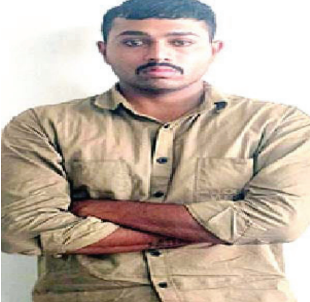
‘નક્કલી’ પોલીસને આ વખતે અસલી પોલીસ ‘ખાખી’નો અસલી રંગ બતાવે તે જરૂરી નથી લાગતું?!