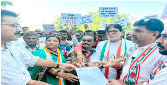
ટકા રકમ પણ ખેડૂતોને ચુકવવામાં આવતી નથી. ગયા વર્ષ ૨૦૨૪ ના જુલાઈ અને ઓગસ્ટ મહીનામાં અતિવૃષ્ટિ ઓક્ટોબર ૨૦૨૪ નો કમોસમી વરસાદનો માર ચાલુ વર્ષ સપ્ટેમ્બર મહીનામાં આવેલ અતિવૃષ્ટિ ને અત્યારે કમોસમી વરસાદે ખેડૂતોની કમર તોડી નાખી છે. ખેડૂતોએ લીધેલ પાક ઘિરાણ પણ ભરી શકે તેમ નથી આવનાર શિયાળુ સીઝન માટે વાવેતર કરવા માટે બિચારણ, ખાતર લેવાના પણ રૂપિયા ખેડૂતો પાસે નથી. ત્યારે રાજ્ય સરકારે જેમ ગજબ સરકારે ખેડૂતોના ૭૮૦૦ કરોડના