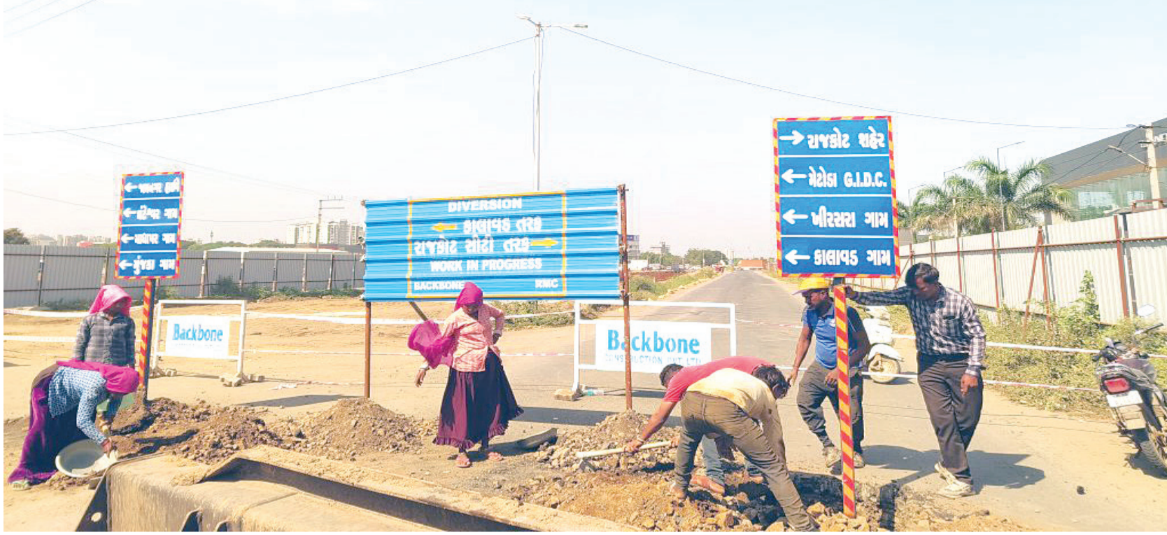
કરી દેવાયા. એટલું જ નહીં કાલાવડ રોડ થી મેટોડા જતો માર્ગ હાલ પૂરતો ચાલુ

હાલ જ વિગતો મળી રહી છે તે મુજબ આ બ્રિજ બનાવવાથી ટ્રાફિક ની સમસ્યા સંપૂર્ણપણે હળવી થઈ જશે અને બંને દિશાના વાહનો માટે હાલ માટે ડાયવર્ઝન રૂટ શરૂ કરી દેવામાં આવ્યો છે. જે મુજબ વાહનોને વેકલિંગ માર્ગ દ્વારા પસાર થવાની વ્યવસ્થા કરવામાં આવે સાથોસાથ કાલાવડ રોડથી મેટોડા જતા વાહનોને ટ્રાફિક પ્રશ્ન ન સતાવે તે માટેના ડાયવર્ઝન પણ શરૂ