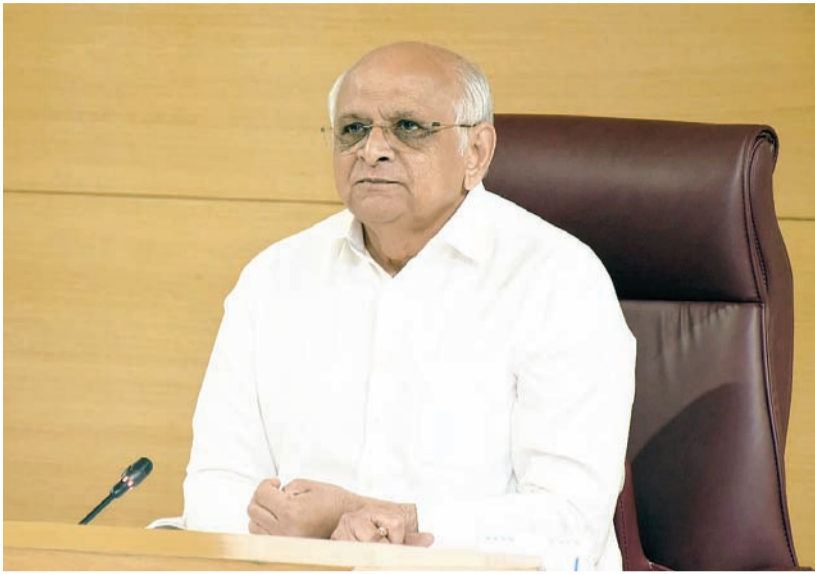
ગીત સાંભળીએ ત્યારે માતૃભક્તિનો અને ભારત માતાની આરાધના કરતા હોઈએ એવો ભાવ ઊભો થાય છે. આ ગીતમાં શોર્ય અને પરાક્રમથી રોમ રોમ જાગી ઊઠે છે. આપણું સદ્ નસીબ છે કે દેશનું સુકાન જ્યારથી નરેન્દ્રભાઈ મોદીએ સંભાળ્યું છે,

આ ગીત ભારતીયતાની ભાવનાને રજૂ કરે છે, આ દેશની સુજલામ સુકલામ ધરતી અને ભારત માતા પ્રત્યેની ભક્તિ દરેક શબ્દમાંથી નીતરે છે. જ્યારે વંદે માતરમ