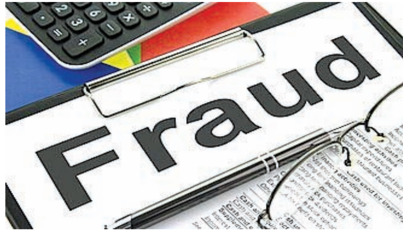
અન્ય એક ફોડમાં બે કંપનીને છેતરી છ કરોડના ડાયમંડ લઈ દઈ ઘૂંભો: ઇઓડબલ્યુની ટીમે આરોપીને પકડ્યો