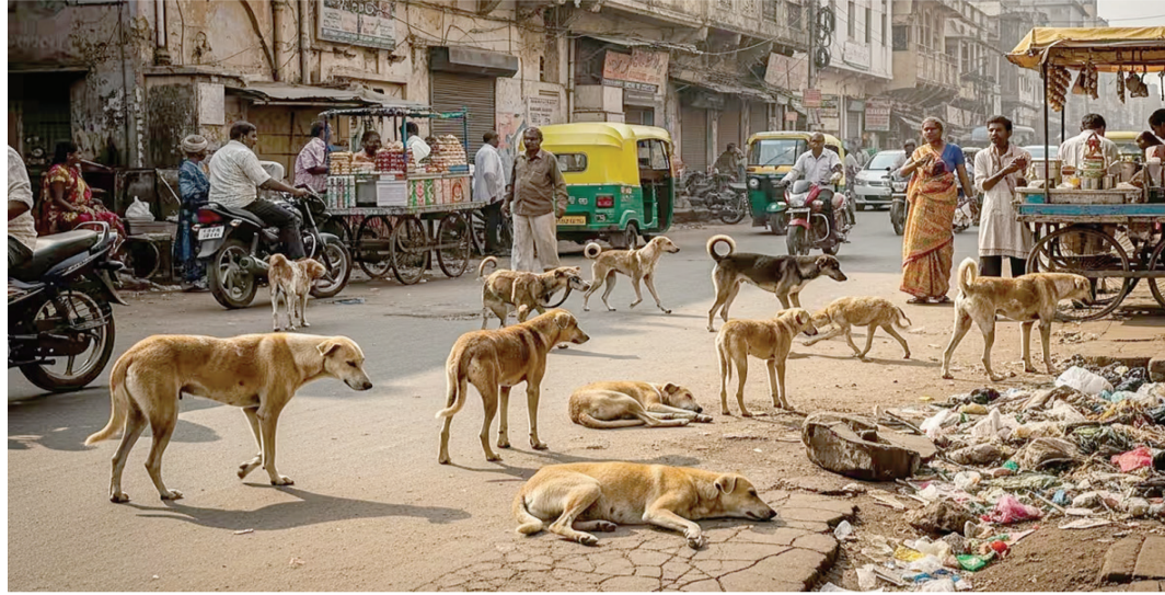
માટે આવી વ્યવસ્થા કેમ નહીં તેવા સવાલ હજારો લોકો કરવા લાગ્યા છે. શહેરમાં રખડતા કૂતરા મુદ્દે સુપ્રીમ કોર્ટ સરકારની જાટકણી કર્યા બાદ સરકારે તમામ મહાનગરપાલિકાઓને આ મુદ્દે પગલા ભરવાનો આદેશ આપતા આજથી રખડતા કૂતરાઓના લીસ્ટઆઉટ માટે તૈયારીઓ આરંભી કલેક્ટર, ડીઈઓ સહિતના સંબંધિત વિભાગને

તે ચોકવાનારો હતો ત્યારે આ પ્રકારની ઘટનાઓ પણ બની રહી છે જેના ઉપર અંકુશ લાદવા માટે હવે મહાનગરપાલિકા દ્વારા વિવિધ સંબંધિત વિભાગોને પત્ર લખી શ્વાન અંગેના ડેટા મંગાવવામાં આવ્યા છે. એટલું જ નહીં રાજકોટના અનેક વિસ્તારોમાં શ્વાનોનો ત્રાસ મુખ વધુ છે અને આ બાબતની જાણકારી પણ મહાનગરપાલિકાને ઉત્તરોત્તર મળી રહી છે અને ફરિયાદો પણ સામે આવી રહી છે. રાજકોટના અનેક રાજમાર્ગો અને શેરી-ગલીઓમાં શ્વાનોના ત્રાસ છે. રાત્રે બાળકો અને વૃદ્ધો જોખમમાં હોવા છતાં કેટલાક કાયદાના કારણે શ્વાનોને હટાવવા કરી શકતા નથી. આથી બહુ સફળ નહીં થતી ખસીકરણની કામગીરી ચાલે છે. પરંતુ હવે આ સમસ્યાનો ઉકેલ લાવવો જરૂરી છે. જો ગાય સહિતના પશુધનને સવાલ હજારો લોકો કરવા લાગ્યા છે. શહેરમાં રખડતા કૂતરા મુદ્દે સુપ્રીમ