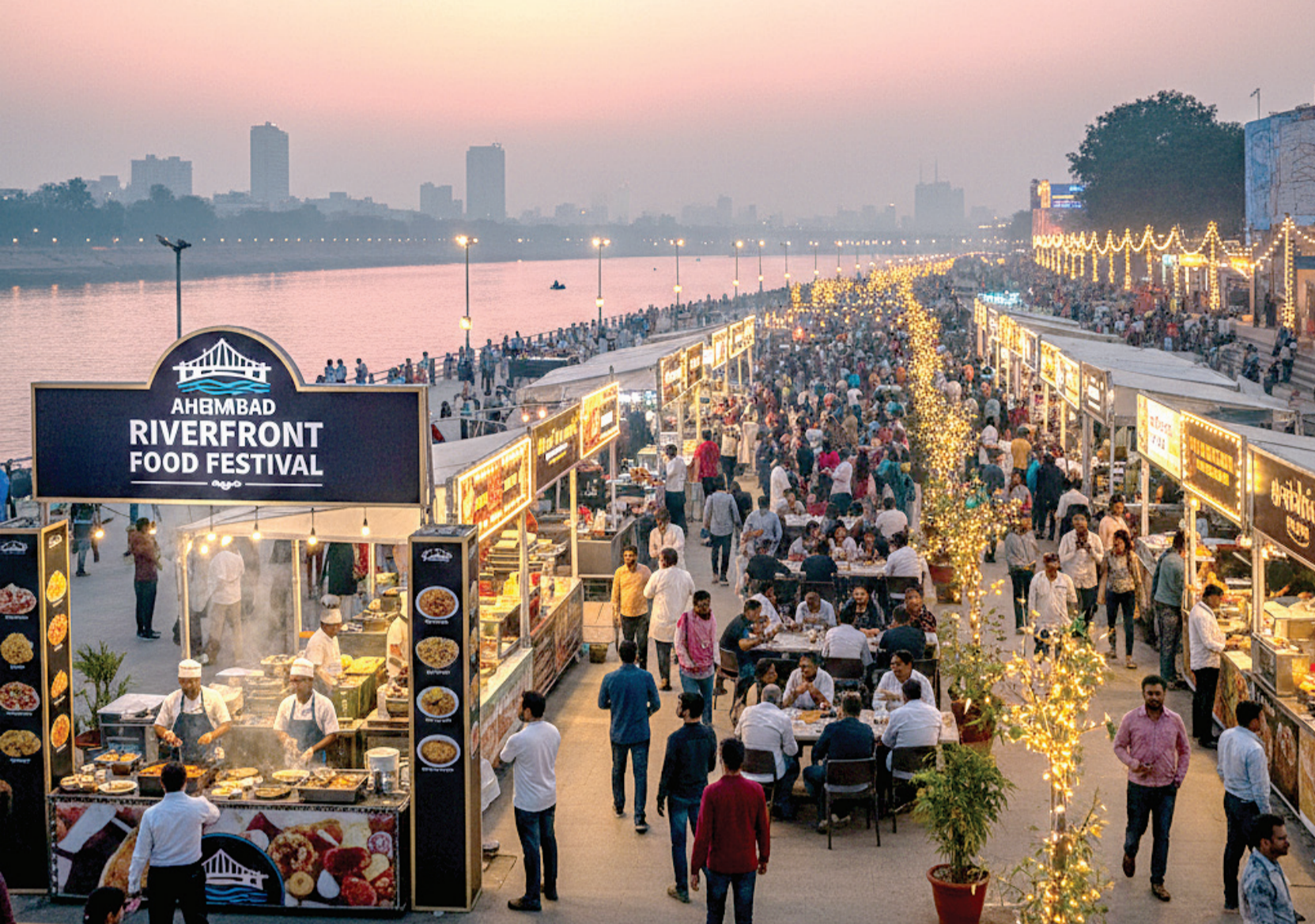
અનેક રાજકીય આગેવાનો ઉપસ્થિત રહ્યા હતા. વર્લ્ડ હેરિટેજ સિટી અમદાવાદમાં અમદાવાદ શાકાહારી ફૂડ ફેસ્ટિવલ ફૂડ ફોર થોટ ફેસ્ટ ૨૦૨૫ નું આયોજન કરવામાં આવ્યું છે. સાઉથ એશિયાની વૈવિધ્યસભર રસોઈ પરંપરા, સંસ્કૃતિ