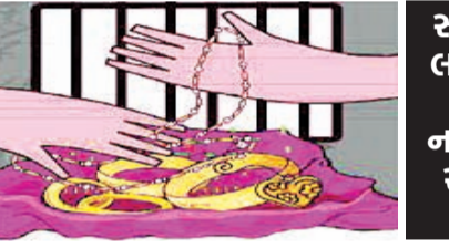
સોની બજારને લાખો કરોડોમાં નવડાવી નાખનારાઓમાં રાજકોટીયનો પણ સામેલ

સોની બજારના ચાંદીના વેપારીએ લક્ષ્મી બનાવવા આપેલું ચાંદી લક્ષ્મીવાદીના કારીગર પિતા-પુત્ર ઓળવી ગયા અને ગાયબ થઈ ગયા એ-કિવીઝન પોલીસને વધુ એક મોટી ગુનાખોરી ઉકેલવા પડકાર મળ્યો