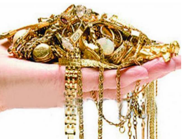
જમીનમાંથી જે નીકળે તે મજૂરનું ગણાય છે. ચાની લારીવાળાને એક સફેદ સિક્કો આપી સોની પાસે ચેક કરાવવા આપતા ચાંદીનો હોવાનું જણાવ્યું હતું. જેના

બોગ બનનાર વેપારીએ સસ્તા ભાવે સોનું ખરીદવાની લાલચમાં આવીને ૧૨ લાખ રૂપિયા ગુમાવ્યા છે. વધુ માહિતી અનુસાર પૈસા આપવા માટે દુકાનદારને વિજયે પહેલા અંકલેશ્વરના એક સ્થળે બોલાવ્યો, અંતે કોસંબામાં અલગ-અલગ વિસ્તારમાં ફેરવ્યા બાદ વેપારી પાસેથી બાર લાખ રૂપિયા મેળવી ઠગોએ તેને ઠગીનાની થેલી પધરાવી હતી.