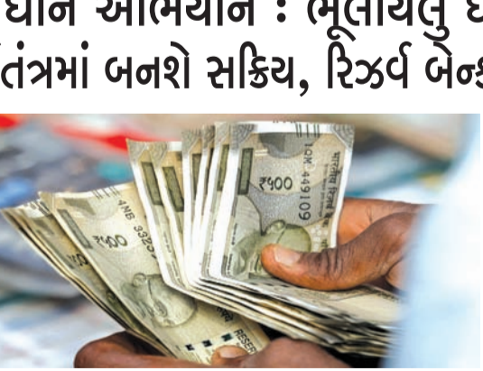
પાતામાં સીધા રૂપિયા જમા કરવાનું સ્વપન પ્રધાનમંત્રી મોદીએ જોયું અને લીડ બેન્ક તથા અન્ય બેન્કોએ તે સ્વપન સાકાર કરીને બતાવ્યું છે. બેંકમાં રહેલી નિષ્ક્રિય અથવા ભૂલાઈ ગયેલી થાપણો વ્યક્તિને પરત સોંપતા ફરીવાર તે દેશના અર્થતંત્રમાં ફરતા થશે. ભારત સરકારના નાણા મંત્રાલયના જણાવવા મુજબ ૬૭,૦૦૦ કરોડની અનકલેઈમ્ડ રકમ રિઝર્વ બેંક ઓફ ઈન્ડિયા પાસે જમા છે. SEBI, PFRDA અને ઈઈઈએ પાસે