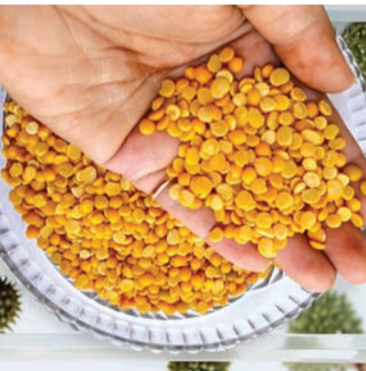
ત્યાં ફરી ચાલુ માસથી અનાજના જથ્થા બાબતનો પ્રશ્ન મો ડાડીને ઊભો થયો છે. ઉલ્લેખનીય છે કે ચાલુ મહિને રાજકોટ સહિત અનેક શહેરોના વેપારીઓને તુવેરદાળનો જથ્થો આજ સુધી મળ્યો નથી. ત્યાં એવી વિગતો

જે અનેક પ્રશ્નો ઊભા કરે છે. લાભાર્થીઓ માટે આ અનાજ ખૂબ મહત્વનું હોય છે કારણ કે આંખો મહિનો આ અનાજ ઉપર જ તેઓએ નિર્ભર રહેવું પડે છે ત્યારે હાલની પરિસ્થિતિ જોતા પુરવઠા વિભાગના અણધડ આયોજન લાભાર્થીઓ માટે શ્રાપ બની ગયો છે. ત્યારે હવે જોવાનું એ રહ્યું શું સરકાર આ મામલે કોઈ યોગ્ય પગલાં લે છે કે કેમ અને જો હા તો કેવી રીતે. રેશનિંગના વેપારીઓ અને લાભાર્થીઓની સમસ્યાનો પુરવઠા વિભાગ પાસે ઉકેલ જ ન હોય તેવુ ચિત્ર છેલ્લા કેટલાક સમયથી ઉપસવા લાગ્યુ છે. વેપારીઓ તેની પડતર સમસ્યાઓ માટે વારંવાર પુરવઠા તંત્ર સામે લડતનું શસ્ત્ર ઉગામે છે. છતાં વેપારીઓ અને લાભાર્થીઓની સમસ્યાનો અંત જ આવતો નથી. તાજેતરમાં જ રાજ્યના ૧૦૦૦૦ રેશનિંગ વેપારીઓની હડતાલનો માંડ અંત આવ્યો હતો.