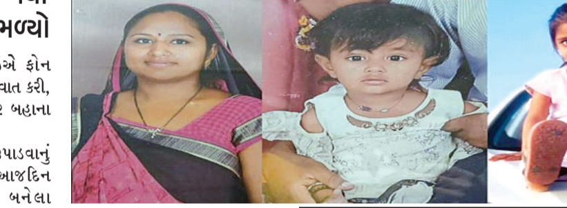
રાજકોટ, તા. ૧૪

રાજકોટના નવાગામમાં અઠ્ઠાવીસ વર્ષની પરિણીતાને ટિકરાનો મોહ હતો, બીજામાં સપનું આવ્યું અને કુરતા આચરી પાણ ફાંસો ખાઈ મોત મેળવ્યું: બીલીમોરામાં સપનું આવતાં બે સંતાને પતાવી ફાંસો ખાધો પણ બચાવી લેવાઈ