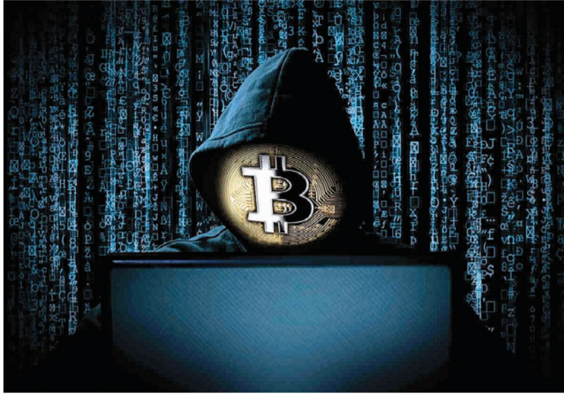
બેંક ખાતાઓમાં ટ્રાન્સફર કરાવવામાં આવ્યા પડાવી લેવામાં આવ્યા. જ્યારે બોગ બનનારને પોતાના નાણાં પરત માંગવાનો કે નફો લેવાનો સમય આવ્યો, ત્યારે આરોપીઓએ હાથ આપ્યો હતો.

સિટીઝનને બિઝનેસના નામે આ નફાની લાલચ આપવામાં આવી હતી, આરોપી ગેંગમાં મની મ્યુલ હતો તેના બેંક એકાઉન્ટનો ઓડિટશા અને ડોગમાં પણ ગુનાહિત ઇતિહાસ છે. પોલીસે જણાવ્યું હતું કે ગુનેગારોએ એક સિનિયર સિટીઝનને ટાર્ગેટ કર્યા હતા. આરોપીઓએ એક આકર્ષક વેબસાઇટ બનાવી હતી, જેના પર મલ્ટીપલ કલસ્ટર બિઝનેસ નામની એક સ્કીમ ચલાવી હતી. ઠગબાજોએ બોગ બનનારને આધુનિક જમાના સાથે તાલ મિલાવી, ક્રિપ્ટોકરન્સી યુએસડીટીમાં રોકાણ કરવા જણાવ્યું.