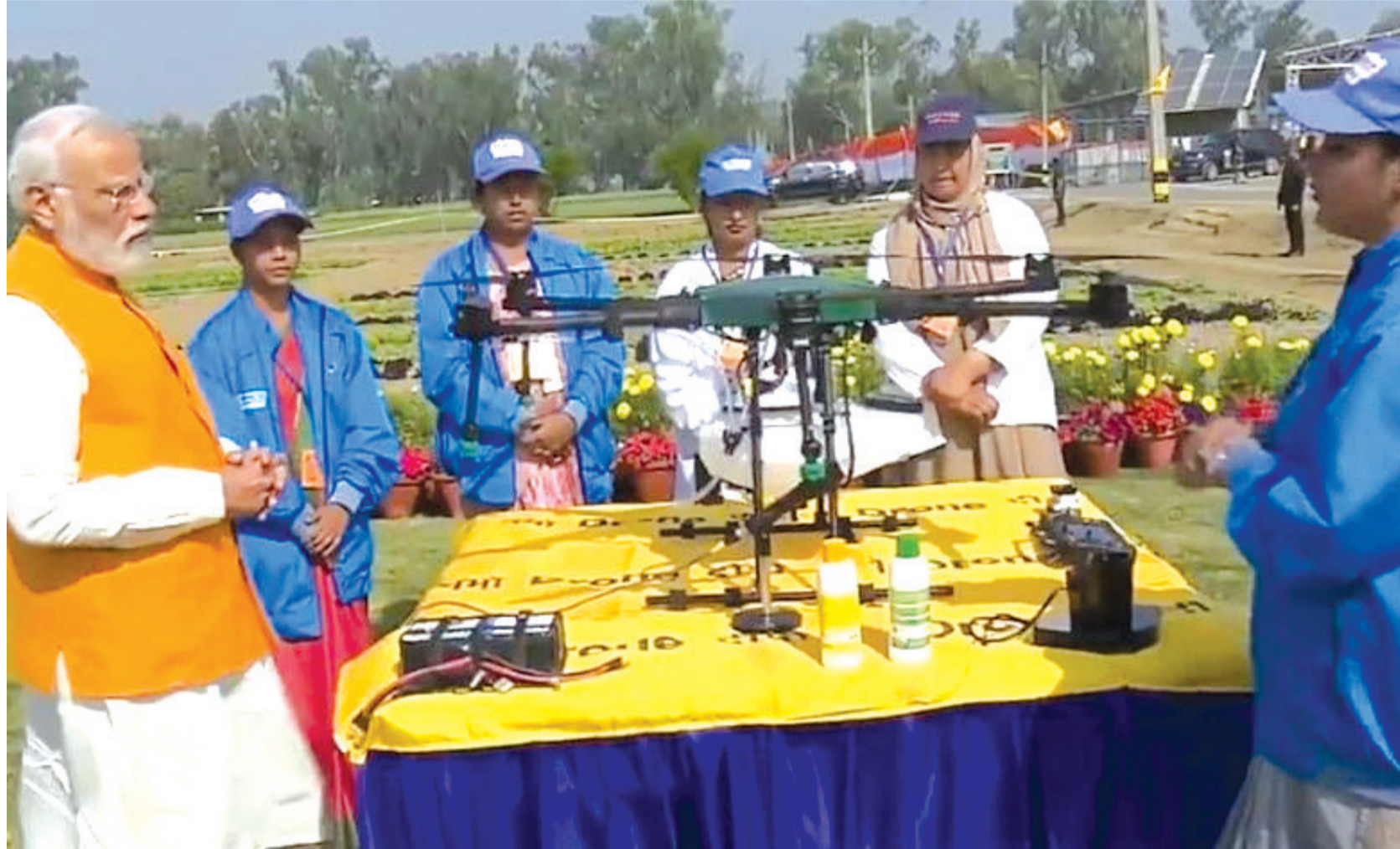
સંકળાયેલી છે. જેમાં રાજ્યની અંદાજે ૨.૭૭ લાખ મહિલાઓ પાક આધારિત પ્રવૃત્તિઓમાં, ૬.૧૧ લાખ મહિલાઓ પશુપાલન ક્ષેત્રમાં, ૧૦ હજાર મહિલાઓ વનઉત્પાદન ક્ષેત્રમાં અને ૧૬ હજાર કરતાં વધુ મહિલાઓ મત્સ્યપાલન ક્ષેત્રમાં કાર્યરત છે. આ ઉપરાંત GLPCની નોન ફાર્મ આજીવિકા હેઠળ સ્વ-સહાય જૂથોની મહિલાઓ ખાદ્ય ઉત્પાદનનો ઉત્પાદન, હેન્ડલ્ડ અને હસ્તકલા, માટી કામ, ટેક્સટાઇલ ઉત્પાદન, કેન્ટીન અને કેટરિંગ સેવા, બેંક પ્રતિનિધિ, હાથથી બનેલા સ્વચ્છતા ઉત્પાદનોના ઉત્પાદન, સર્વિસ સેગમેન્ટ વગેરે સાથે પણ સંકળાયેલી છે. ચાલુ વર્ષે રાજ્યમાં ૫૦ જેટલી નવી કેન્ટીનની સ્થાપના સાથે કુલ ૨૦૦ મંગલમ કેન્ટીનો થકી સ્વ-સહાય જૂથોની મહિલાઓને આજીવિકા મળી રહી છે. વધુમાં, CSR પ્રવૃત્તિ અંતર્ગત રાજ્ય સરકારે સ્ટેટ ગ્રામીણ આજીવિકા મિશન-SRLM હેઠળ રિલાયન્સ ફાઉન્ડેશન, પિડિલાઈટ ઇન્ડસ્ટ્રીઝ, બાયક, CSR બોક્સ, સુપર ફાઉન્ડેશન જેવી અનેક NGO, કંપનીઓ તથા ટ્રસ્ટ સાથે જોડાણ કર્યું છે. જેના પરિણામે કસ્ટમ હાયરિંગ સેન્ટર, કેટલ ફીડ યુનિટ, માર્કેટ એન્ટરપ્રાઇઝ, કેન્ટીન વગેરે જેવી આજીવિકા પ્રવૃત્તિઓ ગુજરાતભરમાં વિકસાવવામાં

આવી શકશે. રાજ્ય સરકાર દ્વારા સ્વ-સહાય જૂથોને સીધી માર્કેટ લિંકેજ માટે સરસ ફેર, સખી ક્રાફ્ટ બજાર ઇવેન્ટ, નેશનલ એક્રિવિશન, ગ્રામ હાટ, રેલવે સ્ટેશન પર રિટેલ સ્ટોર, ડિજિટલ કેટલોગ, સોશિયલ મીડિયા પ્રમોશન, ઇ-કોમર્સ પ્લેટફોર્મ વગેરે મારકેટ સહાય પૂરી પાડવામાં આવી રહી છે. ગત પાંચ વર્ષમાં રાજ્ય સરકાર દ્વારા ૨૦૦થી વધુ સરસ ફેર, પ્રાદેશિક મેળા, રાખી મેળા અને નવરાત્રી મેળાનું આયોજન કરવામાં આવ્યું છે, જેમાં ૫,૯૫૦થી વધુ SHGને તેમના ઉત્પાદનો પ્રદર્શિત અને વેચાણ માટે અસરકારક માર્કેટિંગ પ્લેટફોર્મ પૂરું પાડવામાં આવ્યું છે. જે અન્વયે આ સ્વ-સહાય જૂથોની મહિલાઓને રૂ. ૪૮ કરોડથી વધુનું વેચાણ કર્યું છે. આ ઉપરાંત રાજ્ય સરકાર દ્વારા બે નવી યોજનાઓની શરૂઆત કરવામાં આવી છે, જેમાં જી-સકલ યોજના હેઠળ આગામી પાંચ વર્ષમાં રૂ. ૫૦૦ કરોડનું રોકાણ કરીને ૫૦ હજાર અંત્યોદય પરિવારોને સમૃદ્ધ અને ગ્રામિણ આજીવિકા આધારિત ઉદ્યોગો માટે સહાય આપવામાં આવશે. જ્યારે બીજી યોજના જી-મૈત્રી યોજના હેઠળ રૂ. ૫૦ કરોડના સ્ટાર્ટઅપ ફંડ સાથે ૧૦ લાખ ગ્રામિણ મહિલાઓને આજીવિકા મળી રહેશે. અત્રે નોંધનીય છે કે, કેન્દ્ર સરકાર દ્વારા દીનદયાલ અંત્યોદય યોજનાનારાષ્ટ્રીય ગ્રામિણ આજીવિકા મિશન(DAY-NRLM) વર્ષ ૨૦૧૧માં શરૂ કરવામાં આવી હતી. જેનો હેતુ ગ્રામિણ ગરીબ મહિલાઓને સ્વ-સહાય જૂથોમાં(SHG) સંગઠિત કરવાનો અને તેમને આજીવિકાનું વિવિધિકરણ, આવકમાં વધારો અને જીવનની ગુણવત્તામાં સુધારણા માટે લાંબા ગાળાનો સહકાર પૂરો પાડવાનો છે. તા. ૩૦ એપ્રિલ, ૨૦૨૫ સુધીમાં આ મિશન ૨૮ રાજ્યો અને ૬ કેન્દ્રશાસિત પ્રદેશોમાં(દિલ્લી અને ચંદીગઢ સિવાય) ૭૪૫ જિલ્લાઓના ૭,૧૪૪ બ્લોકમાં અમલી છે. જે અંતર્ગત કુલ ૧૦.૦૫ કરોડ મહિલાઓને ૯૦.૯૦ લાખથી વધુ સખી મંડળો સાથે જોડવામાં આવી છે.