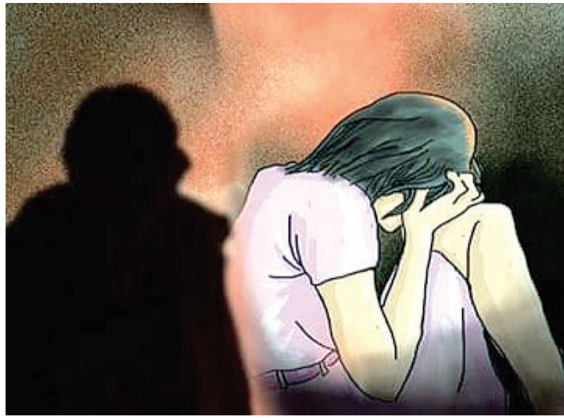
સગીરાની પૂછપરછ શરૂ કરી હતી. જેમાં સગીરાએ કહ્યું હતું કે, છેલ્લા ત્રણ વર્ષથી યુવક તેની સાથે પ્રેમ સંબંધમાં હતો. ત્યારે મને ફરવા લઈ જવાના બહાને તેના અલગ