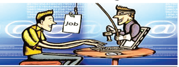
રાજકોટમાં સરકારી નોકરીના નામે ઠગાઈની વધુ એક ઘટના આવી સામે: માલવીયાનગર પોલીસની કાર્યવાહી