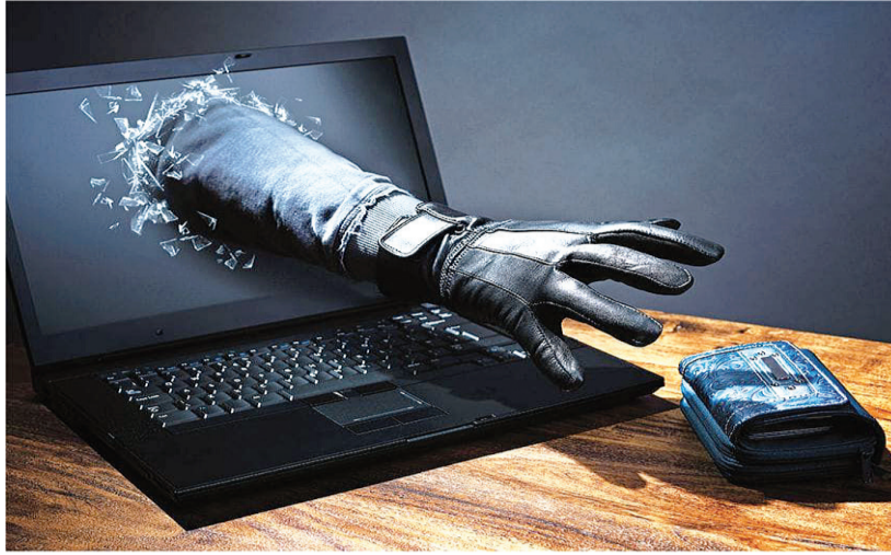
કર્મી હતા. ઈન્વેસ્ટરે પોલીસને કહ્યું છે કે ત્યારબાદ મને કહેવામાં આવ્યું હતું કે તમારો આઈપીઓ લાગ્યો છે અને તેની ૧.૨૬ કરોડની રકમ તમારા ખાતામાં જમા કરી છે.