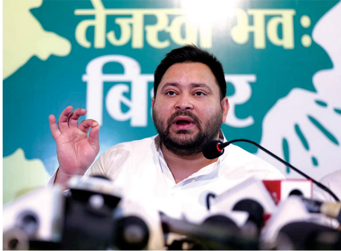
બિહાર વિધાનસભાની ચૂંટણીમાં એનડીએ અને અખિલ ભારતીય મહાગઠબંધન વચ્ચે નજીકની સ્પર્ધા થવાની અપેક્ષા હતી, પરંતુ એવું બન્યું નહીં. એનડીએએ અપેક્ષા કરતા વધુ સાકં પ્રદર્શન કર્યું, પ્રચંડ વિજય મેળવ્યો અને રાજ્યમાં સત્તામાં પાછો ફર્યો.

આરજીડીએ સોશિયલ મીડિયા પર એક પોસ્ટ શેર કરી જેમાં પાર્ટીએ કહ્યું, "જનસેવા એક સતત પ્રક્રિયા છે, એક અનંત યાત્રા છે! હંમેશા ઉતાર-ચઢાવ આવે છે. હારમાં કોઈ દુઃખ નથી, જીતમાં કોઈ ધમંડ નથી! રાષ્ટ્રીય જનતા દળ ગરીબોનો પક્ષ છે અને ગરીબોમાં પોતાનો અવાજ ઉઠાવતો રહેશે."