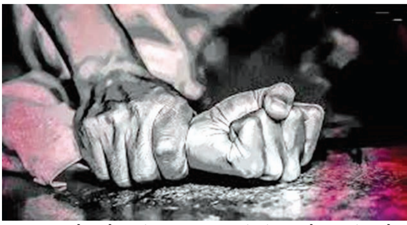
મીઠી-મીઠી વાતો કરીને લગ્નનું આશ્વાસન આપી યુવતિનો વિશ્વાસ જીત્યો હતો. ૨૭ જુલાઈના રોજ આરોપીએ યુવતિને પોતાના ઘરે બોલાવી કોલ્ડ્રીકમાં કેફી દ્રવ્ય ભેળવી

વાઘોડિયા રોડ વિસ્તારમાં સોશિયલ મીડિયા પર મિત્રતા કરી યુવતિને લગ્નની લાલચ આપી પ્રેમજ્વળમાં ફસાવનાર યુવકે કોલ્ડ્રીકમાં નશીલો પદાર્થ ભેળવી પીવડાવી બળાત્કાર ગુજાર્યો હતો. આ મામલે બાપોદ પોલીસ મથકમાં ફરિયાદ દાખલ થઈ છે. પોલીસ સુત્રોના કહેવા મુજબ આ યુવકે યુવતિના અશ્લીલ કોટા-વીડિયો ઉતારી બ્લેકમેલ કરી વારંવાર શારીરિક શોષણ કર્યું હતું, જેના કારણે યુવતી ગર્ભવતી બની હતી. આરોપીએ ખાનગી હોસ્પિટલમાં બળજબરીપૂર્વક ગર્ભપાત પણ કરાવ્યો હતો. છેવટે યુવતીએ બાપોદ પોલીસ સ્ટેશનમાં ફરિયાદ નોંધાવતાં પોલીસે આરોપીની ઘરપકડ કરી લીધી છે.