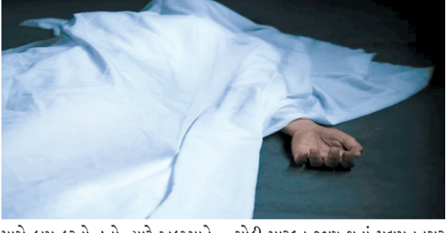
પાસે કામ કરતો હતો ત્યારે અકસ્માતે અંદર પડી જતાં માથામાં ગંભીર ઈજા થઈ હતી. આ યુવાનને સિવિલ હોસ્પિટલમાં સારવાર હેઠળ હતો. તેનું મૃત્યુ થતાં પરિવારમાં શોક પાંચી વર્ષિય યુવાન સોળમીના બપોરે ત્રણેક વાગ્યે રેલનગરમાં આરએમસીનું ભૂગર્ભ ગટરનું કામ ચાલુ હોઈ ત્યાં અન્ડર ગ્રાઉન્ડ ટાંકા

રાજકોટ, તા. ૧૮ આકસ્મિક મૃત્યુના વધુ એક બનાવમાં એક યુવાનનું મોત થયું છે. તો બીજી તરફ બીએસએનએલના કર્મચારી અને હીરાધસુના હૃદય બેસી જવાને કારણે મોત નિપજતાં પરિવારજનોમાં શોક વ્યાપી ગયો છે.