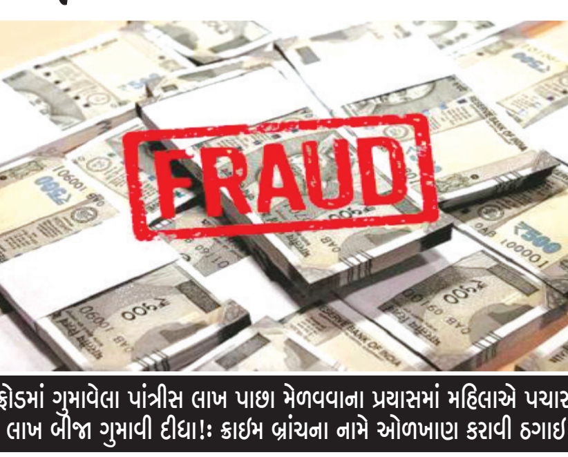
ફોડમાં ગુમાવેલા પાંત્રીસ લાખ પાછા મેળવવાના પ્રયાસમાં મહિલાએ પચાસ લાખ બીજા ગુમાવી દીધા! કાર્ગમ બ્રાંગના નામે ઓળખાણ કરાવી ઠગાઈ