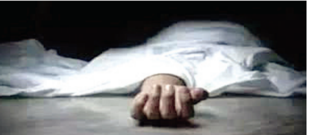
મજબૂર કરતો હતો. આ બાબતે યુવતીના મોબાઈલના આધારે આરોપી પુર્વ પ્રેમી સામે પોલીસ ફરિયાદ નોંધાવાઈ છે. ગળે ફાંસો ખાતા પહેલા પરણી તા.એ પુર્વ પ્રેમી એવા આરોપીને મોબાઈલમાં ફંદાનો ફોટો મોકલ્યો હતો. આ પુરાવા પોલીસને મળતા આરોપી પુર્વ પ્રેમી સામે દૂષ્કરણનો ગુનો નોંધી ઝડપી લેવા તજવીજ થઈ રહી છે.

રાજકોટ, તા. ૧૯ લગ્નરત્ત સંબંધોના પરિણામો ઘાતક આવતા હોય છે. આવી જ રાજકોટની એક ઘટના તાજી છે જેમાં પતિએ બેવફાઈનો આરોપ મુકી પતિને પતાવી દઈ પોતે પણ ગોળી ખાઈ આપઘાત કર્યો હતો. દરમિયાન એક કિસ્સામાં યુવતિ પરણી ગયા પછી પણ તેનો પુર્વ પ્રેમી ફોટાને આધારે બ્લેકમેઈલ કરી ધરાર પ્રેમસંબંધ રાખવા દબાણ કરતો હોઈ તેણીએ આપઘાતનું પગલુ ભરવા મજબૂર થયું પડ્યું છે. આપઘાત કર્યા પહેલા આ પરિણીતાએ પુર્વ પ્રેમીને ફાંસીના ફંદાનો ફોટો મોકલ્યો હતો. પોલીસે ધરાર પ્રેમી સામે એફઆઈઆર દાખલ કરી કાર્યવાહી કરી છે. અપમૃત્યુની બીજી એક આવી ઘટનામાં પ્રેમી સાથે ભાગેલી યુવતિને પરિવારજનો પરાણે પરત ઘરે લઈ આવતાં તેણે આપઘાત કરી લીધો હતો. પાંચમી ઘટનામાં પ્રૌઢનું નહાતી વખતે નદીમાં ડૂબી જવાથી મૃત્યુ થઈ ગયું હતું.