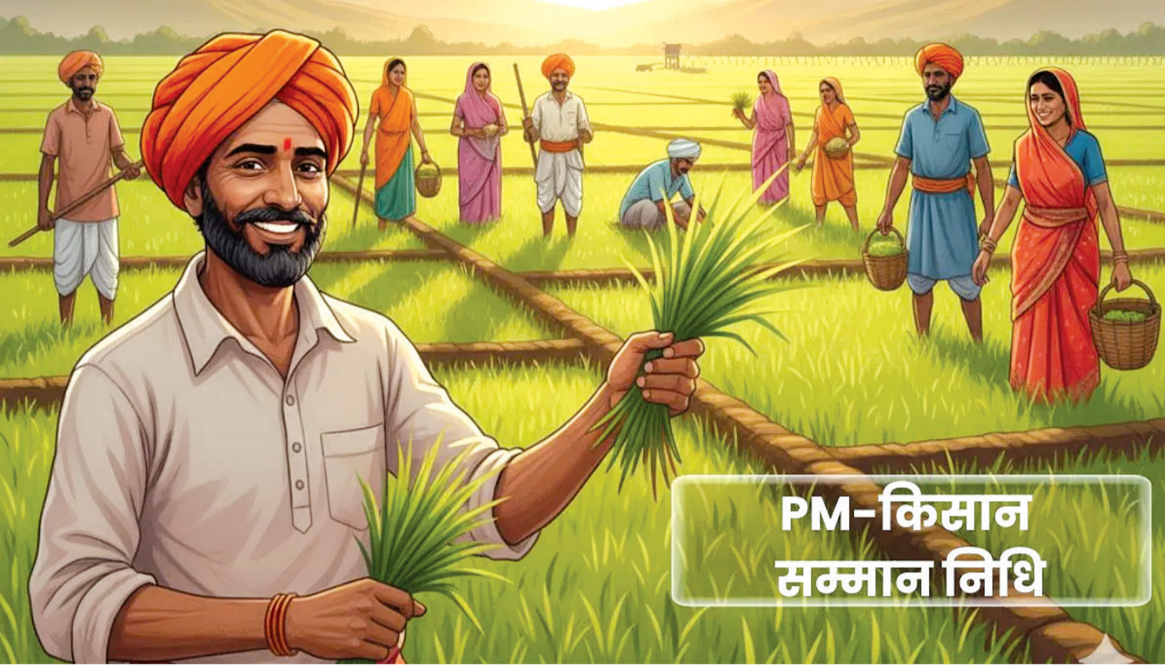
PM-કિસાન સન્માન નિધિ

રાજકોટ, તા. ૧૯ મુખ્યમંત્રી ભૂપેન્દ્ર પટેલે જણાવ્યું કે, રાજ્યના ખેડૂતો પર તાજેતરમાં આવી પડેલી અસાધારણ કમોસમી વરસાદની આપત્તિથી થયેલા નુકસાનમાંથી તેમને બેકા કરવા આ ૭૮૬ કરોડની સહાય ખૂબ જ ઝડપથી રૂ. ૧૦ હજાર કરોડનું ઉદારતમ સહાય પેકેજ આપ્યું છે. પી.એમ. કિસાન સન્માન નિધિ યોજનાનો ૨૧મો હપ્તો વડાપ્રધાન નરેન્દ્રભાઈ મોદીએ તમિલનાડુના કોઈમ્બતુરથી દેશના કિસાનો માટે રિલીઝ કર્યો તેના ગાંધીનગરમાં યોજાયેલા રાજ્યકક્ષાના કાર્યક્રમમાં મુખ્યમંત્રી સંબોધન કરી રહ્યા હતા. વડાપ્રધાનના સંબોધનનું જીવંત પ્રસારણ રાજ્યના ખેડૂતોને નિહાળ્યું હતું. વડાપ્રધાનએ આ અવસરે દેશભરના ૯ કરોડથી વધુ ખેડૂતોને ૨૧મો હપ્તો પેટે ૧૮ હજાર કરોડ રૂપિયાની સહાય આપી હતી. ગુજરાતના ૪૯.૩૧ લાખથી વધુ કિસાનોને આ સહાય અંતર્ગત ૯૮૬ કરોડ રૂપિયા ડી.બી.ટી.થી મળશે. ગાંધીનગરમાં રાજ્યકક્ષાના કાર્યક્રમમાં કિસાન સન્માન નિધિ સાથે મુખ્યમંત્રી શ્રી ભૂપેન્દ્ર પટેલ અને કૃષિમંત્રી જીતુભાઈ વાઘાણી તથા કૃષિ રાજ્યમંત્રી રમેશભાઈ કટારાએ ૧૧.૬૮ લાખ રૂપિયાથી વધુની વિવિધ કૃષિ સહાયના મંજૂરીપત્રોનું વિતરણ કર્યું હતું. મુખ્યમંત્રી ભૂપેન્દ્ર પટેલે આ અવસરે જણાવ્યું હતું કે, વડાપ્રધાન નરેન્દ્રભાઈ મોદીએ ખેડૂતોને આર્થિક રીતે સમૃદ્ધ કરવા અનેક કલ્યાણકારી યોજનાઓ આપી છે. એટલું જ નહીં, ક્લાઈમેટ ચેન્જના પડકારો સામે ઝીન કરવે વધારીને સુરક્ષા આપવાનો અભિગમ 'એક પેડ માં કે નામ' અને પ્રાકૃતિક કૃષિ જેવા અભિયાનોથી અપનાવ્યો છે. મુખ્યમંત્રીએ રસાયણયુક્ત ખેતીથી જમીન અને માનવ બંનેનું સ્વાસ્થ્ય ક્ષયી રહ્યું છે તેના ઉપાયરૂપે વડાપ્રધાનએ પ્રાકૃતિક ખેતીનો અપનાવવાનો