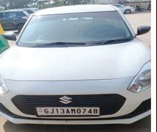
GJ-13-AM-0748) સાથે ઊભેલા છે. આ ચોક્કસ ખાતમીના આધારે પોલીસે તુરંત