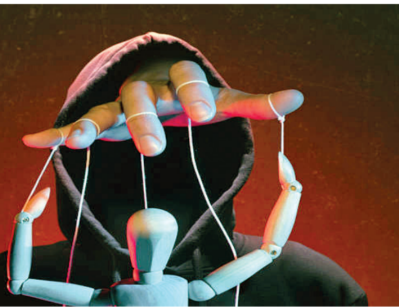
પ્રિન્ટીંગ પ્રેસનો કર્મચારી કટકે કટકે કરીને સવા પાંચ લાખ ખાઈ ગયો