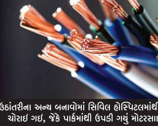
ઉઠાંતરીના અન્ય બનાવોમાં સિવિલ હોસ્પિટલમાંથી છકડો ચોરાઈ ગઈ, જેકે પાર્કમાંથી ઉપડી ગયું મોટરસાઈકલ