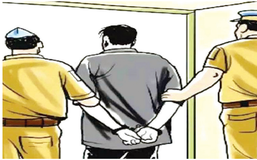
ગામમાં છૂપાયેલો છે. ભાતમીની ખરાઈ થયા બાદ સુરત જ એક વિશેષ ટીમનું ગઠન કરવામાં આવ્યું અને તેને છત્તીસગઢ ખાતે રવાના કરવામાં આવી હતી. આ પછી પીસીબીની ટીમે બિલાસપુરના સંતનગર, ગ્રામ પંચાયત