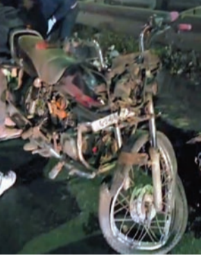
અંરપોર્ટ પોલીસે જરૂરી કાર્યવાહી કરી મુતદેહને પોસ્ટમોર્ટમ માટે રાજકોટ ખસેડવામાં આવી હતી. પોલીસે મુતકની ઓળખ મેળવવા અને જીવલેણ અકસ્માત સર્જી ભાગી જનારા વાહનચાલકને શોધવા તપાસના ચક્રો ગતિમાન કર્યા છે.

રાજકોટ, તા.૨૦ વાહન અકસ્માતની રોજખરોજ બનતી ઘટનાઓમાં ઘણીવાર વાહનચાલક કે રાહદારીના મૃત્યુ પણ થાય છે. દરમિયાન હિટ એન્ડ રનની વધુ એક ઘટનામાં રાજકોટ-અમદાવાદ હાઇવે પર કુચીયાદળ ઓવર ક્રીચ ઉપર એક યુવાનનું મોત થયું છે. જેમાં અજાણ્યો ડમ્પર કે ટ્રકનો ચાલક બાઈકને ઉલાળીને ભાગી જતાં બાઈકચાલક યુવાનના માથાના કુરચા નીકળી ઘટનાસ્થળે જ મોત થયું હતું. વિગતો જોઈએ તો રાત્રીના નવેક વાગ્યા આસપાસ અજાણ્યો ડમ્પરચાલક બાઈકને ઠોકરે લઈ ભાગી જતાં બાઈકનો બૂકડો બોલી ગયો હતો અને તેના ચાલક આશરે ત્રીસથી પાંચત્રીસ વર્ષના યુવાનના માથાના કુરચા બોલી જતાં ઘટના સ્થળે જ કમકમાટી ભર્યું મોત થયું હતું. બનાવની જાણ થતાં