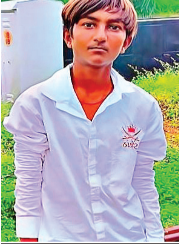
જવાબદારો સામે ગુનો નોંધાય અને ધરપકડ થાય પછી જ લાશ સ્વીકારવાનો પરિવારજનોનો નિર્ણય: કોળી સમાજના આગેવાનો કાર્યકરો હોસ્પિટલે પહોંચ્યા

રાજકોટ, તા.૨૦ જમીનનો ડખખો હવે જીવલેણ બની ગયો છે. રાજકોટ જિલ્લાના વાંકાનેર તાબેના મહિકા ગામે ત્રણ પિત્રાઈ ભાઈઓ પોતાની વાડીએ સજોડે ઝેરી દવા પી જતાં ત્રણેયને સારવાર માટે રાજકોટ સિવિલ હોસ્પિટલમાં ખસેડાયા હતાં. જે પૈકી એક ભાઈનું મોત થતાં પરિવારમાં કાળો કલ્પાંત સર્જાયો હતો. પચાસ વર્ષથી આ ત્રણેય ભાઈઓના કુટુંબીઓ પેઢી દર પેઢી જે ખેતીની જમીન વાવે છે તે બાજુની જમીનમાં લીઝ રાખનારા શખ્સોએ અમારી લીઝની જગ્યામાં તમારી જમીન આવે છે, અહિંથી અમારે રસ્તો કાઢવો છે કહી જમીન ખાલી કરવાનું કહી જેસીબી સાથે આવી માથાકુટ કરતાં ત્રણેય ભાઈઓએ ગભરાઈને આ પગલુ ભર્યાનું પરિવારજનોએ કહેતાં પોલીસે જરૂરી કાર્યવાહી હાથ ધરી હતી. બીજી તરફ કુટુંબીજનોએ આ ઘટનામાં જીવબદારો સામે ગુનો નોંધી ધરપકડ ન થાય ત્યાં સુધી લાશ નહિ સ્વીકારવા નીર્ણય કર્યો હતો. હોસ્પિટલે કોળી સમાજના આગેવાનો કાર્યકરો દોડી ગયા હતાં.