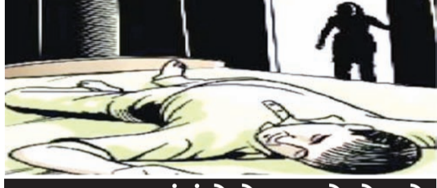
આડાઅવળા સંબંધોનો આવતો હોય છે કડ્ડણ અંજામ: લાલબત્તી સમાન ઘટના

રાજકોટ, તા. ૨૨ આડાઅવળા સંબંધોનો અંજામ મોટે ભાગે કડ્ડણ આવતો હોય છે. આવી જ એક ઘટના રાજકોટ જિલ્લાના શાપર વેરાળમાં બની છે. અહિં રહી ફાયનાન્સ કંપનીમાં નોકરી કરતાં મુળ ગોંડલ પંથકના ચોવીસ વર્ષના યુવાને ગળાફાંસો ખાઈ લીધાની ઘટનામાં ચોંધાવનારી વિગતો ખુલી છે. આ યુવાનને તેની જ સાથે નોકરી કરતાં યુવાનની પત્નિ સાથે અફેર થઈ જતાં અને બંનેને પતિ, દિયરે પકડી લેતાં અને ધમકી આપતાં તે મરી જવા મજબૂર થયાની એકાઉન્ટઆર દાખલ કરાવાઈ છે. શાપર પોલીસે આ બનાવમાં વિશેષ કાર્યવાહી હાથ ધરી છે.