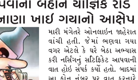
ભર્યું હતું. રાજકોટ નજીકના ગામની ૨૩ વર્ષની યુવતિએ રેસકોર્પ લવ ગાર્ડનમાં વેધુ ટીકડી પી જતાં ઝેરી અસર થતાં સારવાર માટે ખસેડાઈ હતી. તબિબે આ અંગે પોલીસ કેસ જાહેર કર્યો હતો. વધુ માહિતી અનુસાર યુવતિની સગાઈ થઈ ચુકી છે. જેની સાથે સગાઈ થઈ એ યુવાને કહ્યું હતું કે-

રાજકોટ, તા. ૨૨ નોકરીના નામે ફોડની ઘટનાઓ અવાર-નવાર બને છે. દરમિયાન એક કિસ્સામાં ઘરે બેઠા નર્સિંગના સર્ટિફિકેટની લાલચ આપી રૂપિયા પડાવી લેતાં છેતરાયેલી યુવતિએ રેસકોર્પ લવગાર્ડનમાં આપઘાતનો પ્રયાસ કર્યો હતો. વિગતો જોઈએ તો શહેરના તાવની બિમારીની વેધુ યુવતિએ આપઘાતનો પ્રયાસ કરતાં સિવિલ હોસ્પિટલમાં ખસેડાતાં હોસ્પિટલ ચોકીના સ્ટાફે પ્ર.નગર પોલીસને જાણ કરી હતી. નર્સિંગની નોકરીના નામે ફોડ થતાં તેણીએ આ પગલુ