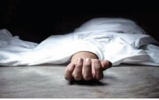
તથા એક ટિકરી છે. તે કુલહારનો ધંધો કરતાં હતાં. પેટમાં પાણી ભરાઈ જવાની બિમારી હોવાનું સગાએ કહ્યું હતું. આ અંગે માલવીયાનગર પોલીસે