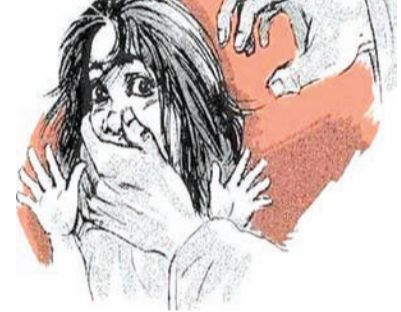
નોંધી છે. તેમને ચાર સંતાન છે. તે પૈકી ચોંદ વર્ષની ટિકરી સત્તરમીના રોજ ઘરે એકલી હતી. પ્રોઠેની તબિયત સારી ન હોઈ તે દવા લેવા ગયા હતાં. પરત એકાદ કલાકમાં બપોરે ઘરે આવ્યા ત્યારે નાની ટિકરી ઘરમાં જોવા મળી નહોતી. તપાસ કરવા છતાં અને સગા

રાજકોટ, તા. ૨૨ શહેરમાં સમયાંતરે કે અવાર-નવાર બાળાઓ, સગીરાઓ ગૂમ થઈ જાય છે. મોટા ભાગના કિસ્સામાં તપાસને અંતે એવી વિગતો ખુલતી હોય છે કે આ સગીરાઓને મિત્રતા, પ્રેમજાળમાં ફસાવીને પરિચીતો કે કહેવાતા પ્રેમીઓ ભગાડી ગયાનું ખુલતું હોય છે. આ પ્રકારના વધુ બે નવા કિસ્સા સામે આવ્યા છે. જેમાં ચોંદ અને તેર વર્ષની બે બાળા ગૂમ થઈ જતાં અપહરણની એકાઉન્ટ આર દાખલ થઈ છે. આ બનાવ કોઠારીયા વિસ્તાર અને થોરાળા વિસ્તારમાં બનતાં આજુબેમ પોલીસ અને થોરાળા પોલીસે એકાઉન્ટ આર દાખલ કરી તપાસના ચક્રો ગતિમાન કર્યા છે. વિગતો પર નજર કરીએ તો આજુબેમ પોલીસે કોઠારીયા ગુલાબનગર વિસ્તારમાં રહેતાં મુળ મધ્યપ્રદેશના મજૂર પ્રોઠેની ફરિયાદ