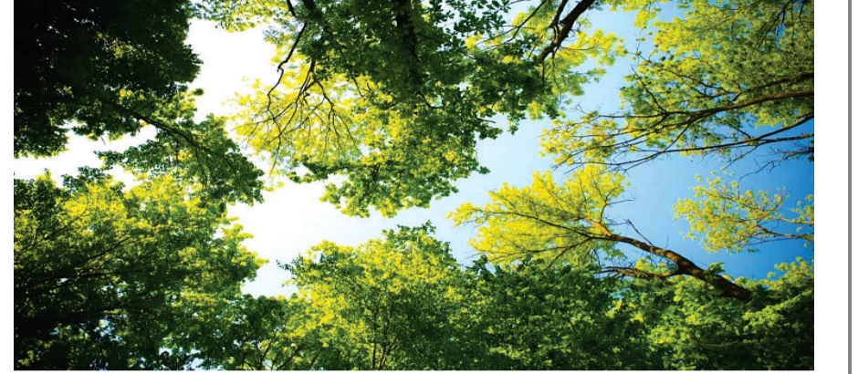
રાજકોટ, તા. ૨૩

૬૫ લાખનું ટેન્ડર પ્રસિદ્ધ : ૫૦ વર્ષથી વધુ આયુષ્ય ધરાવતા વૃક્ષોનો થશે સમાવેશ