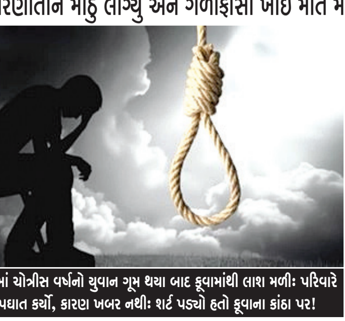
બીજી ઘટનામાં ચોત્રીસ વર્ષનો યુવાન ગૂમ થયા બાદ કૂવામાંથી લાશ મળી: પરિવારે કહ્યું આપઘાત કર્યો, કારણ ખબર નથી: શર્ટ પડ્યો હતો કૂવાના કાંઠા પર!