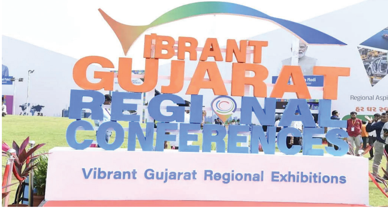
ઉલ્લેખનીય છે કે, ઉત્તર ગુજરાતમાં આયોજિત પ્રથમ કોન્ફરન્સને અસાધારણ સફળતા મળી હતી, જેમાં ૧૮,૦૦૦ ચોરસ મીટરથી વધુનો વિસ્તાર આવી લેવામાં આવ્યો હતો, છ થીમટિક MSMEs સહિત ૪૧૦થી વધુ એક્રિઝબિટસ હિસ્સો લીધો હતો, અને આ કોન્ફરન્સમાં ૮૦,૦૦૦થી વધુ મુલાકાતીઓ આવ્યા હતા.

રાજકોટ, તા. ૨૫ ગુજરાત સરકારે કચ્છ અને સૌરાષ્ટ્ર વિસ્તાર માટે વાઈબ્રન્ટ ગુજરાત રિજનલ કોન્ફરન્સ (VGRC)ની બીજી આવૃત્તિની જાહેરાત કરી છે, જે ૮ થી ૧૧ જાન્યુઆરી, ૨૦૨૬ દરમિયાન રાજકોટમાં યોજાશે. આ કોન્ફરન્સની સાથે જ, ૮ થી ૧૧ જાન્યુઆરી, ૨૦૨૬ દરમિયાન તે જ સ્થળે વાઈબ્રન્ટ ગુજરાત રિજનલ એક્રિઝબિશન (VGRE) પણ યોજાશે, જે સમગ્ર કચ્છ અને સૌરાષ્ટ્ર વિસ્તારના ઉદ્યોગો, ખજાનગી, સરકારી સંસ્થાઓ અને ઉદ્યોગસાહસિકો માટે એક ઉચ્ચ પ્લેટફોર્મ પ્રદાન કરશે. બીજી વાઈબ્રન્ટ ગુજરાત રિજનલ કોન્ફરન્સ સિરામિક્સ, એન્જિનિયરિંગ, બંદરો અને લોજિસ્ટિક્સ, મત્સ્ય ઉદ્યોગ, પેટ્રોકેમિકલ્સ, કૃષિ અને ફૂડ પ્રોસેસિંગ, પનિચો સહિતના મુખ્ય વિકાસ ક્ષેત્રો પર ધ્યાન કેન્દ્રિત કરશે. વ્યૂહાત્મક ભાગીદારી, પોલિસી સર્પોર્ટ અને રોકાણકારોના સહયોગ દ્વારા, આ કાર્યક્રમનો ઉદ્દેશ ગુજરાતના પશ્ચિમ પટ્ટામાં સમાવિષ્ટ વિકાસ અને ટકાવપણું સુનિશ્ચિત કરવાની સાથે ઔદ્યોગિક વિકાસને વેગ આપવાનો છે. ઉલ્લેખનીય છે કે, ઉત્તર ગુજરાતમાં આયોજિત પ્રથમ કોન્ફરન્સને અસાધારણ સફળતા મળી હતી, જેમાં ૧૮,૦૦૦ ચોરસ મીટરથી વધુનો વિસ્તાર આવી લેવામાં આવ્યો હતો, છ થીમટિક MSMEs સહિત ૪૧૦થી વધુ એક્રિઝબિટસ હિસ્સો લીધો હતો, અને આ કોન્ફરન્સમાં ૮૦,૦૦૦થી વધુ મુલાકાતીઓ આવ્યા હતા.