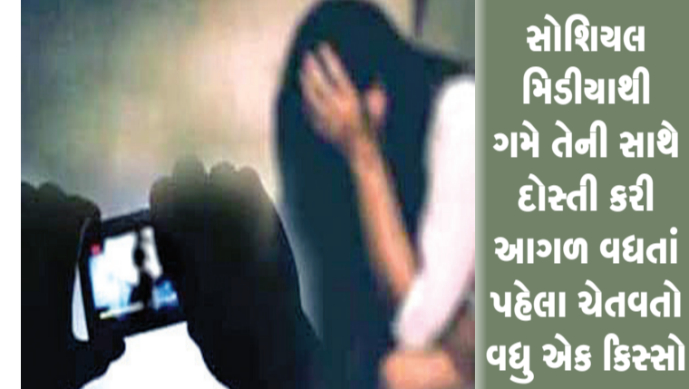
અપહરણ બનાત્કારના ગુનામાં આઠ વર્ષથી ફરાર શખ્સને ઝડપી લેવાયો

રાજકોટ, તા. ૨૬ દૂષ્કર્મ, પજવણી, છેડતીની ઘટના એક દુઃખદ ન ભુલાય ત્યાં બીજી નોંધાઈ જાય છે. વધુ આવી એક ઘટનામાં બીસીએની વિદ્યાર્થીનીને પ્રેમજાળમાં ફસાવી ફોટા વાચરલ કરવાની ધમકી આપી લાખો રૂપિયા પડાવી લેવાયા છે. માથે જતાં વિડીયો કોલ કરી અશ્લીલ હરકતો પણ કરવામાં આવતી હતી અને છાત્રા પાસે અઘટીત માંગણી કરવામાં આવતી હતી. સોશિયલ મીડીયાનો અનેક લેભાગુઓ દુરુપયોગ કરતાં હોય છે. આ ઘટનામાં પણ ઈન્સ્ટાગ્રામના માધ્યમથી છાત્રાને ફસાવી લેવાઈ હતી.