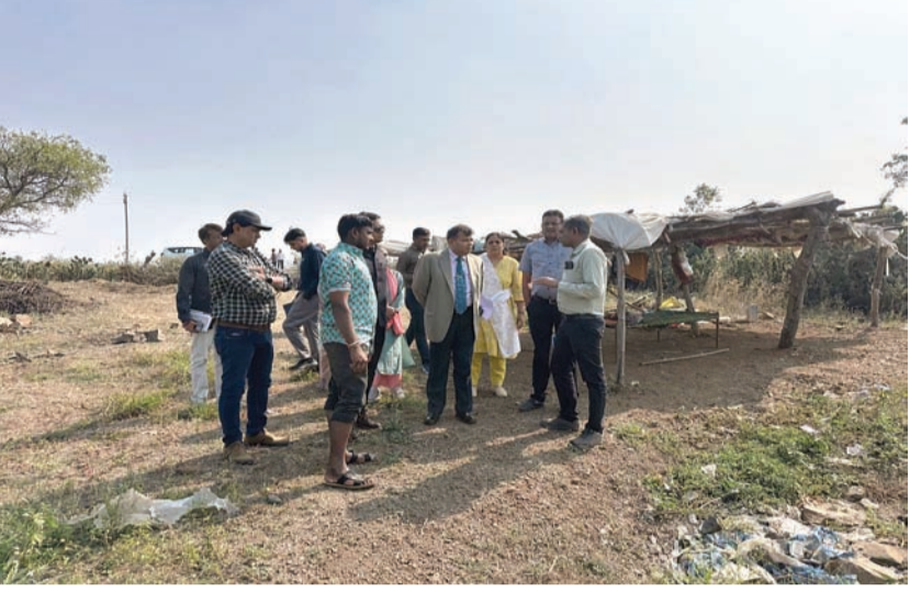
ટીમ મેમ્બર્સ માર્ગ અને મકાન વિભાગ હેઠળના માર્દનોર શ્રીજ, એપ્રોચ રોડ, ડાઈવર્ઝન વગેરેને થયેલા નુકસાનથી માહિતગાર થયા હતા. પી.જી.વી.સી.એલ.ના ટ્રાન્સફોર્મર, વીજ થાંભલાઓ તથા વીજ લાઈનોને થયેલા નુકસાનની પણ વિગતો જાણી હતી. આંગણવાડી, સરકારી શાળા પરિસર વગેરેને થયેલા નુકસાન વિશે

પણ સભ્યોએ જાણ્યું હતું. અને અણવિતવી પરિસ્થિતિનો આયોજનબદ્ધ સામનો કરવા બદલ જિલ્લા વહીવટી તંત્ર તથા તમામ સરકારી વિભાગના અધિકારીઓની સહાયતા કરી હતી.