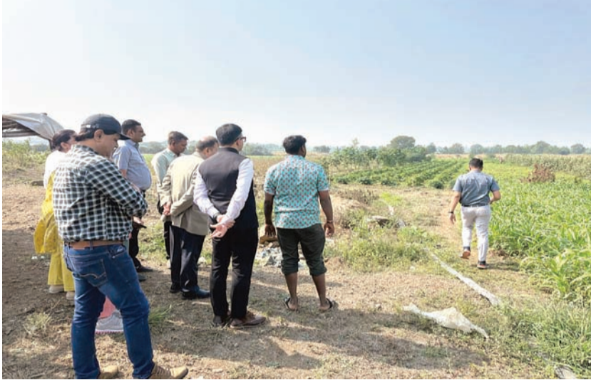
લેવાતા ઋતુ પ્રમાણેના રોકડિયા તથા અન્ય કૃષિ પાકો, કૃષિ સંલગ્ન ઉદ્યોગો, કૃષિ ક્ષેત્ર માટે ઉપલબ્ધ આંતર માળખાકીય સવલતો, ગોંડલ-ઉપલેટા પંથકમાં કાર્યરત એમ.એસ.એમ.ઈ.(સૂક્ષ્મ, લઘુ અને મધ્યમ ઉદ્યોગો), ખેતીને મુખ્ય વ્યવસાય તરીકે અપનાવતા ખેડૂતોની સામાજિક પરિસ્થિતિ વગેરે વિશે કેન્દ્રીય ટીમે ઉપસ્થિત વિવિધ સરકારી વિભાગોના અધિકારીઓ સાથે ઊંડાણપૂર્વક ચર્ચા કરી હતી.

રાજકોટ જિલ્લાના ખેતી, માર્ગ- મકાન, પી.જી.વી.સી.એલ. વગેરે ક્ષેત્રોમાં વર્ષાઋતુ-૨૦૨૫ દરમિયાન થયેલી નુકસાનીનો તાગ મેળવવા માટે કેન્દ્રીય સચિવ કક્ષાની ટીમ રાજકોટ ખાતે આવી હતી અને વિવિધ ક્ષેત્રોમાં થયેલી નુકસાનીની સવિસ્તર વિગતો મેળવી હતી.