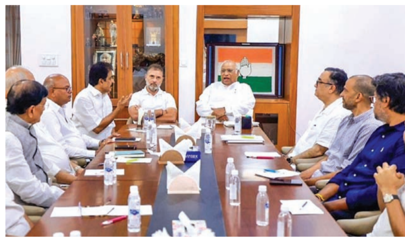
નથી. આ અકવાઓ પર કોઈ ધ્યાન આપશો નહીં. અમારો કોઈની સાથે કોઈ વિવાદ થયો નથી.” તેમણે કહ્યું, “બિહાર ચૂંટણીમાં ઘણા ઉમેદવારો એવા છે જેમણે મજબૂત લડત આપી છે. આજે તેઓ પોતાના વિચારો રજૂ કરવા માટે કોંગ્રેસ મુખ્યાલય આવા હતા. હું કોંગ્રેસ