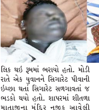
લિક થઈ ઝૂમમાં ભરાયો હતો. મોડી રાતે એક યુવાને સિગારેટ પીવાની ઇચ્છા થતાં સિગારેટ સળગાવતાં જ ભડકો થયો હતો. શાપરમાં શીતળા રાજુભાઈ બસરા જે બાવીસ વર્ષનો

રાજકોટ, તા. ૨૭ ગેસ લિકેજને કારણે આગ લાગવાની વધુ એક ઘટના બની છે. જેમાં રાજકોટ જીલાના શાપર વેરાવળમાં કંપનીમાં કામ કરતાં અને ત્યાંની જ ઝૂમમાં રહેતાં યુધી અને એમપીના બે યુવાન મોડી રાતે ગેસનો નાનો બાટલો લિકેજ થયા બાદ આગ ભભૂકતાં દાઝી જતાં બંનેને સારવાર માટે રાજકોટ ખસેડાયા હતાં.