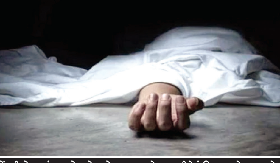
જિંદગી હોય ત્યાં સુખ હોય તો સાથે દુઃખ પણ હોય, તકલીફોનું નિવારણ મોત જ ન હોય

રાજકોટ, તા. ૨૭ મહામુલી જિંદગીથી ઘણા લોકો કંટાળી જતાં હોય છે. કંટાળી જવાના કારણે અલગ અલગ હોય છે. પરંતુ તેનો રસ્તો માત્ર આપઘાત જ ન હોઈ શકે. જીવન હોય ત્યાં સુખ સાથે દુઃખ પણ હોય, તકલીફો પણ હોય અને મોજે દરીયાની શ્વણો પણ હોય. પણ અમુક મહાન અલગ અલગ કારણોસર થાકી જઈ હારી જઈ મોતનો રસ્તો અપનાવી લેતાં હોય છે અને કાયમને માટે દુનિયા છોડી જતાં હોય છે. જો કે તેનું આવું પગલું તેમના સ્વજનો પરિચીતોને ઉડા આઘાત આપી જતું હોય છે. ત્રણ અલગ અલગ ઘટનામાં એક યુવાન અને બે વૃદ્ધે આપઘાત કરી લીધો છે. એક યુવાને અને એક વૃદ્ધે ગળાફાંસો ખાઈ લીધો હતો અને એક વૃદ્ધ દવા પી ગયા હતાં.