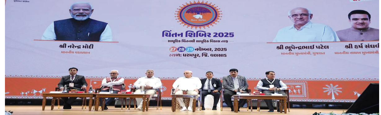
તેનું મૂલ્યાંકન ચિંતન કરીને તેના પરિણામોનું પણ મંથન સમયાંતરે કરવાની જરૂરિયાત તેમણે સમજાવી હતી. મુખ્યમંત્રીએ વડાપ્રધાન નરેન્દ્રભાઈ મોદીએ ચિંતન શિબિરની ૨૦૦૩માં શરૂઆત કરાવતા કહેલી વાત સાથે આવવું શરૂઆત છે, સાથે વિચારવું એ પ્રગતિ છે અને સાથે કામ કરવું એ સફળતા છે નો ઉલ્લેખ કરતાં જણાવ્યું કે, સામૂહિક ચિંતનથી સામૂહિક વિકાસનો ધ્યેય ચિંતન શિબિરોથી પાર પડ્યો છે. હવે આપણે વધુ તેજ ગતિ અને શ્રેષ્ઠતા તરફ સાથે મળીને આગળ જવાનું મંથન ત્રણ દિવસની શિબિરમાં કરવું છે. પૂજ્ય બાપુને પ્રિય ભજન વૈષ્ણવજન તો...નો મર્મ અને અર્થ પણ સમગ્ર સેવા કાળમાં અપનાવીને સૌના કલ્યાણ માટે હંમેશા કર્તવ્યરત રહેવાની તેમણે અપીલ કરી હતી. ભૂપેન્દ્ર પટેલે વડાપ્રધાનને ૨૦૪૭ સુધીમાં વિકસિત ભારતનું જે આહવાન કર્યું છે તેમાં ગુજરાતને લીડ લેવા સક્ષ કરવામાં શિબિરનું વિચાર મંથન ઉપયુક્ત બનશે તેવો વિશ્વાસ કર્યો હતો. સામાન્ય વહીવટ વિભાગના અગ્ર સચિવ હારિત શુક્લાએ સ્વાગત પ્રવચન કરી ૧૨મી ચિંતન શિબિરની રૂપરેખા આપી હતી. તેમણે અગાઉ યોજાઈ ગયેલી ચિંતન શિબિરોની

રાજકોટ, તા. ૨૭ મુખ્યમંત્રી ભૂપેન્દ્ર પટેલે રાજ્ય સરકારની ૧૨મી ચિંતન શિબિરનો પ્રારંભ કરાવતા સ્પષ્ટપણે જણાવ્યું કે, વડાપ્રધાન નરેન્દ્રભાઈ મોદીએ હંમેશા સમયથી આગળનું વિચારીને અને સતત ચિંતન કરીને જીવંતી આગળ રહેવાની સંસ્કૃતિ ચિંતન શિબિર થકી વિકસાવી છે. આ સંદર્ભમાં તેમણે કહ્યું કે, ગમે તેવી સ્થિતિ હોય દ્રઢ મનોબળ અને અડગ વિશ્વાસથી વિકાસની ગતિ અને સામાન્ય માનવીના ભલા માટેના કામોની દિશામાં આગળ વધવા માટે સામૂહિક ચિંતનનું પ્લેટફોર્મ આવી ચિંતન શિબિર પૂરું પાડે છે. મુખ્યમંત્રીએ દરેક ચિંતન શિબિરના પ્રારંભમાં પ્રસ્તુત થતા પ્રેરણા ગીત મનુષ્ય તું બડા મહાન હૈ ની વિભાવના માર્મિક રીતે સમજાવતા કહ્યું કે, આપણામાં જે અનંત શક્તિ પડેલી છે તેની તાકાત-ક્ષમતા ઓળખીને પ્રજાના હિતનું કામ સતત કરતા રહેવું તેની પ્રેરણા ચિંતન શિબિરના વિચાર મંથનથી મળે છે. તેમણે કહ્યું કે, આપણને જે જવાબદારી મળી છે તેને પૂરી નિષ્ઠાથી નિભાવીએ અને લોકોના કામના નિકાલને બદલે ઉકેલ લાવીએ તેવા પોઝિટિવ થીંકાઈગથી કાર્યરત રહીએ તો જ ઈશ્વરે આપણને આપેલી જન સેવાની તકને ઉજાળી શકીશું. આ માટે જે કામ કરીએ