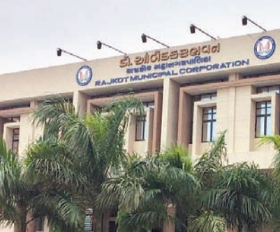
૩૭ મિલકતોનો સ્ટ્રક્ચરલ સ્ટેબિલિટી રિપોર્ટ તૈયાર કરવામાં આવ્યો હતો. ઈસ્ટ ઝોનમાં વોર્ડ નંબર ૬ માં ૩, વોર્ડ નંબર ૫ માં ૪, વોર્ડ નંબર ૧૬ માં ૩ અને વોર્ડ નંબર ૧૫ માં ૩ મિલકતો મળી કુલ ૧૩, સેન્ટ્રલ ઝોનમાં વોર્ડ નંબર ૧ માં ૨, વોર્ડ નંબર ૯ માં ૨, વોર્ડ નંબર ૧૦ માં એક વોર્ડ નંબર ૧૧ માં ૧ મળી કુલ

અન્ય જર્જરિત મિલકતોનો પણ ચોમાસા પહેલા નિયમાનુસાર સર્વે કરવામાં આવે છે. બાંધકામ શાખા દ્વારા સ્ટ્રક્ચરલ ઈજનેરને સાથે રાખીને મિલકતોની હાલત કેટલું આયુષ્ય અને કેટલી જોખમી તેનો રિપોર્ટ તૈયાર કરવામાં આવે છે. શહેરની નવ શાક માર્કેટ, ૧૭ કોમ્યુનિટી હોલ, એક ઓડિટોરિયમ, એક રંગ દર્શન, ૧૦ શોપિંગ સેન્ટર, છ સ્કૂલ, બે સ્ટાક ક્વાર્ટર, બે પોસ્ટ ઓફિસ એક ખંડપીટ એક ફૂલ બજાર અને આઠ અન્ય મિલકતોની સ્ટ્રક્ચરલ સ્ટેબિલિટી ચકાસી તેનો રિપોર્ટ તૈયાર કરવામાં આવે છે આ રિપોર્ટમાં અતિ જોખમી, જોખમી અને જર્જરિત એવી રીતે અલગ અલગ યાદી તૈયાર કરી જે મિલકત જોખમી અને અતિ જર્જરિત હોય તેને તુરંત તોડી પાડવા સુચન કરાય છે. આ પુજ્ય સેન્ટ્રલ ઝોનમાં વોર્ડ નંબર ૩ માં ૮, વોર્ડ નંબર ૧ માં ૧૧, વોર્ડ નંબર ૨ માં ૪, વોર્ડ નંબર ૧૭ માં ૩, વોર્ડ નંબર ૧૪ માં ૬ અને વોર્ડ નંબર ૧૩ માં ૩ મિલકત મળી