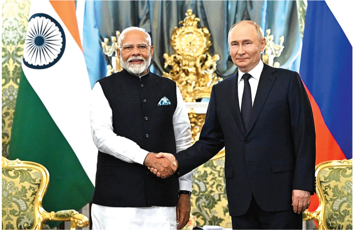
પાસેથી તેલ ખરીદવા માટે ભારત પર ટેરિફ રશિયા સાથેના ભારતના સંબંધો પર મુલાકાતે આવે છે. અમેરિકન રાષ્ટ્રપતિ ડોનાલ્ડ ટ્રમ્પની ટિપ્પણીઓને કારણે આ મુલાકાત મહત્વપૂર્ણ લાંબા સમયથી ભારત પર રશિયા પાસેથી

રશિયાના રાષ્ટ્રપતિ વ્લાદિમીર પુતિન પ્રધાનમંત્રી નરેન્દ્ર મોદી તેમજ રાષ્ટ્રપતિ દ્રૌપદી મુર્મુ સાથે મુલાકાત કરશે. પુતિનની ભારત મુલાકાત અનેક રીતે મહત્વપૂર્ણ રહેવાની ધારણા છે. અમેરિકાએ રશિયા