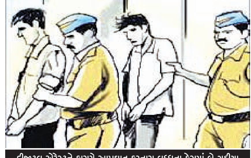
ડિજિટલ એરેસ્ટને કારણે આપઘાત કરનારા વૃદ્ધના કેસમાં બે ગઠીયા પિત્રાઈ ઝડપાયા: અન્ય એક વૃદ્ધ સાથે પણ કર્યું હતું અડધા કરોડનું ફોડ!