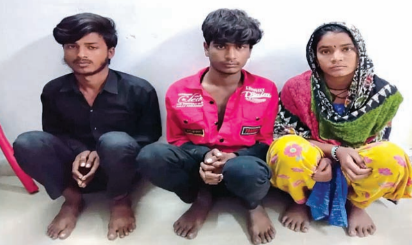
રોજ સાંજે પતિ સાથે સામાન્ય ઝઘડો થતાં તેમના ચાર સંતાનોને લઈ દિલ્હીથી રાજકોટ જવા નીકળ્યા હતા. તા. ૨૬/૧૧/૨૦૨૫ના રોજ વહેલી સવારે ત્રણ વાગ્યે તેઓ રાજકોટ

ચક્રાચર મચી ગઈ છે. મહિલાએ પ્લેટફોર્મ પરથી ટ્રેન ઉપડી ત્યારે પોતાની આ દિકરીને બે અજાણ્યા શખ્સો સાથે જોઈ હોઈ તેના આધારે બંને વિરૂઢ ફરિયાદ દાખલ કરાવી હતી. રેલવે પોલીસે ઘટનાને ગંભીર ગણી તુરંત તપાસ શરૂ કરી હતી. જેના ભાગ રૂપે ઢ્વારકાથી પોલીસે એક મહિલા અને બે શખ્સોને સંકળામાં લઈ પુછતાણ આદરી હતી. રાજકોટ રેલવે પોલીસે આ બનાવમાં મુળ મોરબીના રાતાભેરના ગામના વતની અને હાલ દિલ્હી બેગમપુર બરવાળા રોડ હનુમાન ચોક, કાલી માતાના મંદિર પાસે રોહીણી શનીભાઈના મકાનમાં ભાડેથી રહેતાં બત્રીસ વર્ષના મહિલાની ફરિયાદ પરથી અજાણી એક મહિલા અને એક છોકરા સામે ગુનો નોંધ્યો હતો. મહિલાએ જણાવ્યું હતું કે અમે મુળ મોરબીના રાતાભેરના વતની છીએ. પણ પાંચ વર્ષથી દિલ્હીમાં ફટપાથ પર ટ્રાયફૂટનો છૂટક વેપાર કરતા મહિલા તા. ૨૬/૧૧/૨૦૨૫ના