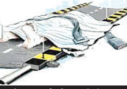
અપમૃત્યુના કડ્ડા સિલસિલામાં વધુ છ પરિવારે ગુમાવી દીધા સ્વજનો

વાહન અકસ્માતની વધુ બે ઘટનામાં બે પરિવારે આધારસ્તંભ ગુમાવ્યા છે. જેમાં એક યુવાન એઈમ્સ હોસ્પિટલનો કર્મચારી હોવાનું ખુલ્યું હતું. જ્યારે અન્ય એક યુવાને સાત મહિના પહેલા અકસ્માત નડતાં ઈજા થઈ હતી. જે તે વખતે તેના કાકાનું ઘટના સ્થળે મૃત્યુ થયું હતું. સારવાર બાદ હવે ભત્રીજા એવા આ યુવાને અંતિમશ્વાસ લીધા હતાં. તો અપમૃત્યુના અન્ય ચાર બનાવોમાં યુવાન, આદ્યેડ, વૃદ્ધ અને એક વૃદ્ધાના મોત થયા છે. છએય ઘટનામાં મૃતકોના પોસ્ટમોર્ટમ રાજકોટ સિવિલ હોસ્પિટલ ખાતે કરવામાં આવ્યા હતાં.