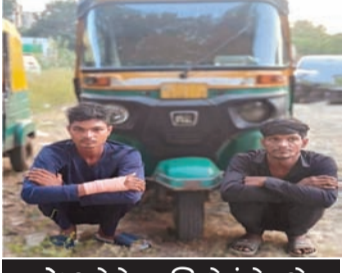
પ્રોથે અને તેના પત્નિ જેમાં બેઠા એ રિક્ષામાં સાથે બેઠેલા બે શખ્સે સંકડામણ થાય છે, પગમાં સળીયા છે કહી ભીડ કરી નજર ચુકવી રોક ભૂટાવી લીધી પછી ચાલકે આ ભાઈને દવાખાને લઈ જવા છે કહી ઉતારી મુક્યા