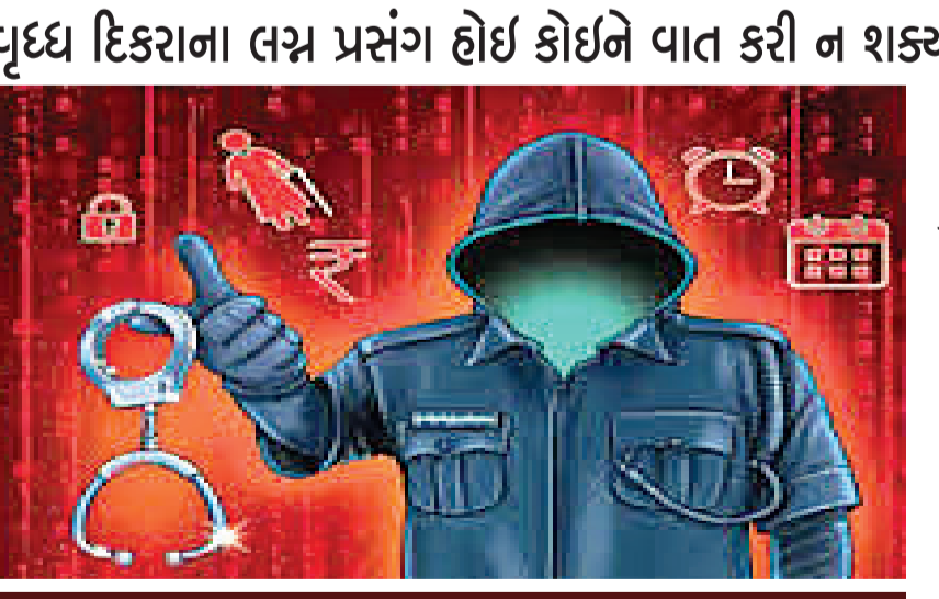
ગટીયાએ કહ્યું-તમારા આધારકાર્ડથી પંજાબ, હરીયાણા, દિલ્હી, હૈદરાબાદમાં પણ બેંક એકાઉન્ટ ખોલાવાયા છે, તમે ચાઈના દેશોમાં ઓર્ગન વેંચી કરોડોનું કૌભાંડ કર્યું છે!

આપી વ્હોટ્સએપ કોલ કરી ડિજિટલ એરેસ્ટ કરવાનું કહી વૃદ્ધ પાસેથી સાત લાખ ચોદ હજાર રૂપિયા પડાવવામાં આવ્યા હતા. વૃદ્ધ પાસેથી વધુ રૂપિયાની માંગણી કરતા સાયબર ફોડ હોવાનું સામે આવતા સાયબર કાઈમ પોલીસ સ્ટેશનમાં ફરિયાદ નોંધવામાં આવી છે. નવરંગપુરા વિસ્તારમાં રહેતા વૃદ્ધને અજાણ્યા નંબર પરથી વ્હોટ્સએપ કોલ આવ્યો હતો, જેમાં અજાણ્યા શખ્સે જીઓ કર્ટમર કેરમાંથી બોલતા હોવાનું કહી મોબાઈલ નંબર બંધ કરવાની વાત કરી હતી. બીભત્સ કોટા, ચાઈલ્ડ પોર્નોગ્રાફી, બીભત્સ મેસેજ જેવા કેસમાં નામ ખુલ્યું હોવાનું કહી વૃદ્ધ પર ગુસ્સો કર્યો હતો. ૧૨૬ કરોડના કૌભાંડમાં સંગીવાયેલા છો અને દેશ વિરોધી પ્રવૃત્તિઓ કરતા હોવાનું કહી ધમકાવવામાં આવતા વૃદ્ધ ગભરાઈ ગયા હતા.