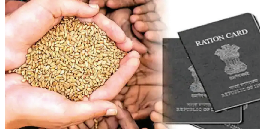
વંચિત રહેલા છે બીજીતરફ અમુક દુકાનો ખાતે જ્યારે મોડી પહોંચ્યો છે. જ્યારે બીજી તરફ સર્વરમાં આવતી એરરો અને વારંવાર થયું તથા ટીપી દ્વારા કરવાની

ખરો જથ્થો ઘણા લાભાર્થીઓને મળ્યો પણ નથી. સર્વર ફિંગર પ્રિન્ટ સહિતની સમસ્યાઓનાં કારણે રાજકોટ સહિત રાજ્યભરનાં હજારો લાભાર્થીઓ ગત નવેમ્બર માસનાં રેશનિંગનાં જથ્થાથી વંચિત રહી ગયાનું બહાર આવેલ છે. ડિસેમ્બર માસ ચાલુ થઈ ગયો છે. છતાં વેપારીઓ હજુ સુધી નવેમ્બરનાં વિતરણ માંથી, ઉંચા આવેલ નથી આથી વેપારી સંગઠને ગત નવેમ્બરનાં વિતરણની મુદત વધારી આપવા માંગ કરી છે. રાજ્યમાં જાહેર વિતરણ વ્યવસ્થા હેઠળ ૭૪ લાખ ગરીબ અને જરૂરિયાતમંદ કુટુંબોને દર માસે મફત અને વ્યાજબી ભાવે અનાજ અને કઠોળ પાંડ નમક વગેરે જનસહીઓ આપવામાં આવે છે મોટાભાગના તાલુકા અને શહેરોમાં વ્યાજબી ભાવની દુકાન ખાતે મોડી જથ્થો પહોંચવાના કારણે હજારો રેશનકાર્ડ ધારકો નવેમ્બર માસના જથ્થાથી