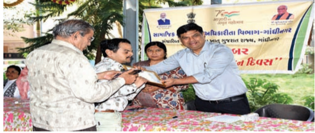
રાજકોટ, તા. ૩

તમામ પ્રકારની દિવ્યાંગતાના સહજ સ્વીકાર સાથે દિવ્યાંગોનું સમાજના મુખ્ય પ્રવાહમાં પુનઃસ્થાપન કરવાના ઉદ્દેશ્યથી માનસિક ક્ષતિવાળા બાળકોના ગૃહ, કાલાવડ રોડ, રાજકોટ ખાતે “આંતરરાષ્ટ્રીય દિવ્યાંગ દિવસ”ની ઉજવણી કરાઈ હતી. આ કાર્યક્રમમાં દિવ્યાંગોએ વિવિધ ગીતો ઉપર નૃત્યસભર અભિવ્યક્તિ કરીને ઉપસ્થિતઓના મન મોહી લીધા હતા. સમાજમાં દિવ્યાંગજનો દ્વારા વિવિધ ક્ષેત્રોમાં પ્રાપ્ત કરવામાં આવેલી સિદ્ધિઓનું ગૌરવ વધારવા શિક્ષણ, કલા, રમત-મન, સામાજિક સેવા