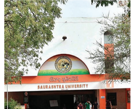
રાજકોટ, તા. ૩

રાજકોટ, તા. ૩ એક વખતની અનેક વખત એ વાત સમાચાર પત્રોમાં પ્રસિદ્ધ થયેલી છે કે સરકારી વિભાગોમાં હાલ અપૂરતો સ્ટાફ હોવાથી જે કામગીરી થવી જોઈએ તે થતી નથી ત્યારે સૌરાષ્ટ્ર યુનિવર્સિટીમાં પણ હાલ મૂખ મોટા પ્રમાણમાં ભરતી કરવી પડે તેવા સંજોગો ઊભા થયા છે ત્યારે આ વખતની ગંભીરતાને ધ્યાને લઈ સૌરાષ્ટ્ર યુનિવર્સિટી દ્વારા ભારતીય અભિયાન હાથ ધરવામાં આવશે જેમાં ૧૭૦ ટીચિંગ તથા નોન ટીચિંગ સ્ટાફની ભરતી કરવામાં આવનારી છે જે માટે તંત્રએ તમામ તૈયારીઓ શરૂ કરી દીધી છે.