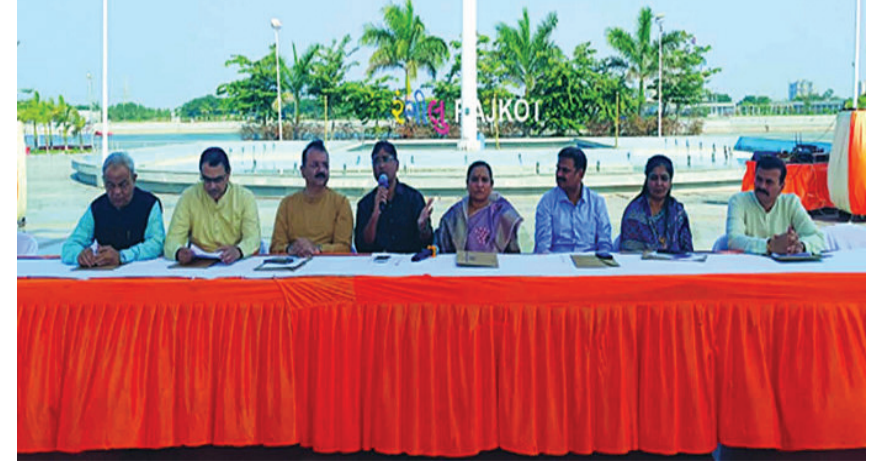
રાજકોટ, તા. ૩