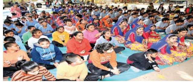
રાજકોટ, તા. ૩

દિવ્યાંગોએ વિવિધ ગીતો ઉપર નૃત્યસભર અભિવ્યક્તિ કરી ઉપસ્થિતઓના મોહી લીધા મન