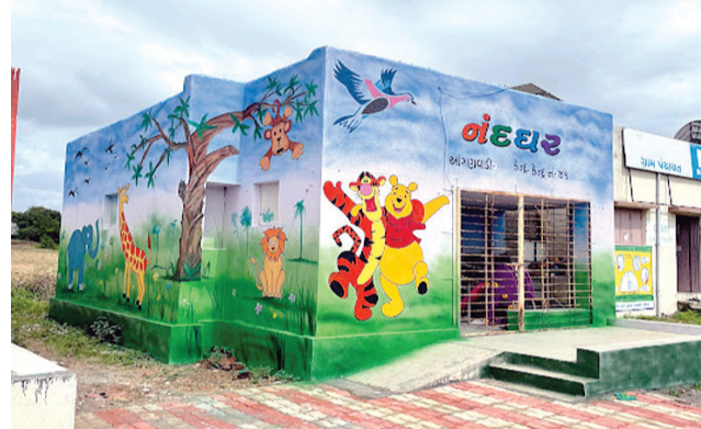
રાજકોટ, તા. ૩

રાજકોટના પ્રભારી મંત્રી જીતુભાઈ વાઘાણી રહેશે ઉપસ્થિત : રાજ્યભરમાં ૯૦૦૦ ઉમેદવારોને અપાશે નિમણૂકપત્રો