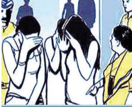
રાજકોટ, તા. ૫

ત્રણ લલના રાખી દેહ વ્યાપારનો ધંધો ચાલતો હતો: સંચાલકો સહિત ૪ વિરૂદ્ધ ગુનો