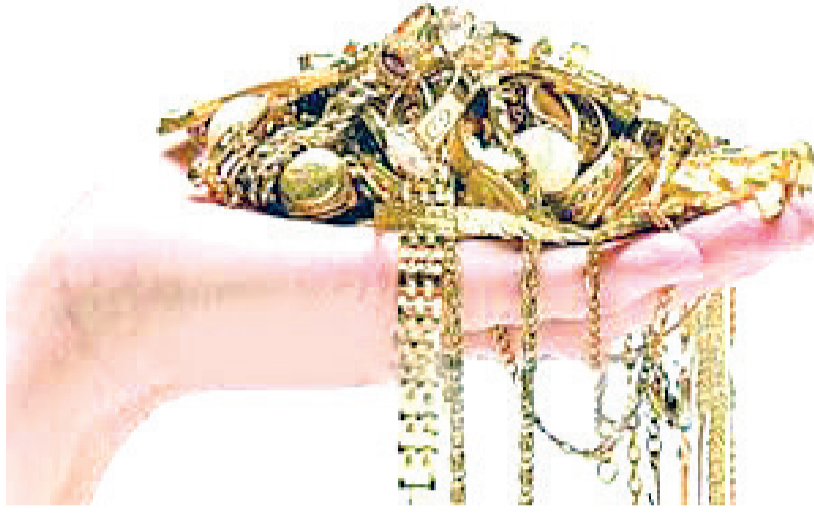
બીટકોઈનમાં રોકાણ કરી કમાણી કરવા જતાં મહિલાએ ગુમાવ્યા એક કરોડ ત્રેવીસ લાખ