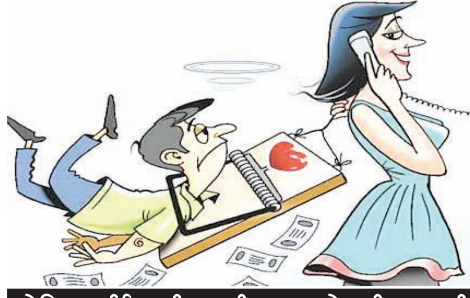
સોશિયલ મીડિયાથી ફસાવી મળવા બોલાવી માર મારી

રાજકોટ, તા. ૧૧ સોશિયલ મીડિયા મારફતે ફેન્ડ લિસ્ટ મોકલ્યા બાદ એક વૃદ્ધ સાથે મીઠી વાતો કરી મળવા બોલાવી હતી વૃદ્ધ પદાધિકારીને પોલીસની ઓળખ આપી ટોળકીએ ડગના ગુનામાં સંડોવવાની ધમકી આપીને રૂા.સાત લાખ પડાવી લીધા છે. બીજા બનાવમાં યુવતી સાથે ફાર્મ હાઉસમાં ગયેલા યુવાન સાથે પોલીસના નામે મારકુટ કરી તોડ કરી લેવાયો હતો.