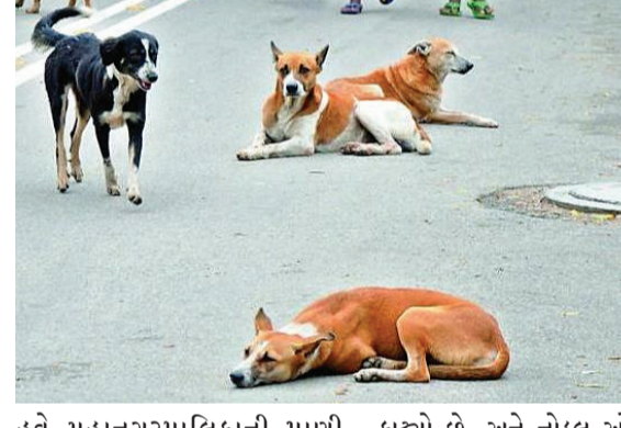
હવે મહાનગરપાલિકાની પ્રાણી રક્ષા અંકુશ શાખાએ વચલો માર્ગ નાગરિકોને ભસતા કુતરા કે પાછળ

રાજકોટ તા. ૧૩ સુપ્રીમ કોર્ટના આદેશ બાદ સમગ્ર રાજ્યની સાથે રાજકોટ મહાનગરપાલિકા દ્વારા પણ રખડતા કુતરાઓનો સર્વે શરૂ કર્યો છે. શહેરની સાત સરકારી સહિત ૩૭ હોસ્પિટલ, મહાનગરપાલિકા નગર પ્રાથમિક શિક્ષણ સમિતિ સંચાલિત ૯૦ થી વધુ શાળાઓ, સરકારી અને ખાનગી સ્કૂલોમાં સુપ્રીમ કોર્ટની ગાઈડ લાઈન મુજબ કામગીરી કરવા ચાર નોડલ ઓફિસરની નિમણૂક પણ કરી છે. ત્યારે હવે ભસતા કે દોડતા કુતરાઓ પકડવા કે તેની નોંધ કરવાને બદલે જો કુતરૂ કરડે તો કેસ પેપર મળ્યા બાદ કુતરા પકડવાની કામગીરી કરવા નિર્ણય લેવાયો હોવાનું જાણવા મળે છે. સુપ્રીમ કોર્ટના આદેશ બાદ મહાનગરપાલિકા હજી રખડતા કુતરાઓનો સર્વે કરી તેને પકડવાની કામગીરી શરૂ કરે તે પહેલાં જ જીવદયા પ્રેમીઓનો વિરોધ ઉઠ્યો છે. બીજી બાજુ મહાનગરપાલિકાએ કુતરાના સર્વે સહિતની કામગીરી માટે ચાર નોડલ ઓફિસરની નિમણૂક પણ કરી છે. પણ, જીવદયા પ્રેમીઓના વિરોધનાં પગલે