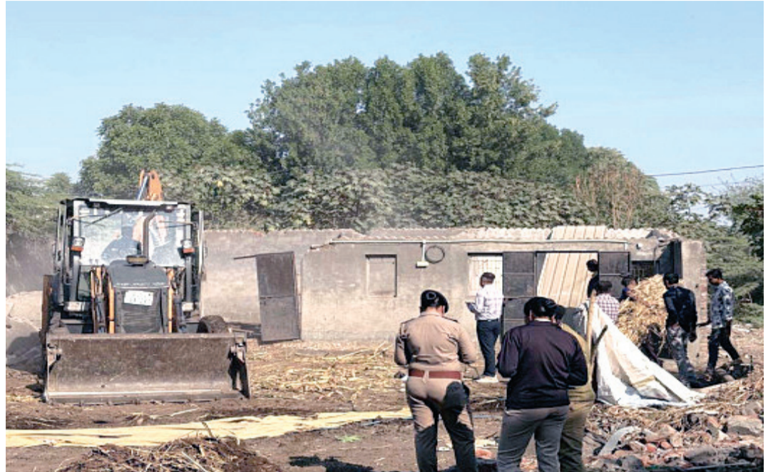
જમીન ખુદી કરી દેવાઈ હતી. આ અંગેની દક્ષિણ મામલતદાર કચેરીના સુત્રોમાંથી મળતી વધુ વિગતો મુજબ આજે સવારના દક્ષિણ મામલતદાર અને તેની ટીમ દ્વારા રાજકોટ શહેરમાં મવડીમાં સરકારી ખરાબાના સર્વે નં.૧૯૪ પૈકીની જમીનમાં

આવેલ સર્વે નં.૧૯૪ પૈકીની ૧૪૦૦ ચો. મી. જમીન ઉપર ખડકાઈ ગયેલ પાકુ દબાણ અને અન્ય કાચા ઝુંપડાઓ તોડી પાડેલ હતા. આ જમીનનો કિંમત આશરે રૂ.૮.૫૦ કરોડ થવા જાય છે. જયારે પશ્ચિમ મામલતદાર દ્વારા રૈયા ગામ પાસે આવેલ સરકાર હસ્તકની ૪૦૦ ચો.મી. જમીન અને રૈયા સ્મશાન પાછળ આવેલ ૧૨૦૦ ચો.મી. જમીન ઉપરથી ઢોર બાંધવાના ઢાળીયા અને ડોંગ હોસ્ટેલના દબાણો ઉપર બુલડોઝર ફેરવી દીધુ હતું. આ જમીનની કિંમત આશરે રૂ.૨૦ કરોડ થવા જાય છે તથા શીતલપાર્ક ચોકડીથી રૈયા ધાર તરફ જતા શીતનગર વિસ્તારમાં ૧૪૦૦ ચો.મી. જમીન ઉપરથી ખજૂરનું કારખાનું પણ હટાવવામાં આવેલ હતું. જિલ્લા કલેક્ટર ડો.ઓમપ્રકાશની સુચના મુજબ દક્ષિણ મામલતદાર દ્વારા એમ મવડીમાં આવેલી ૧૪૦૦ ચો.મી. જેટલી ૮.૫૦ કરોડની કિંમતની સરકારી જમીન પરથી કાચા પાકા દબાણો ઉપર બુલડોઝર ફેરવી દેવાયું હતું અને સરકારી