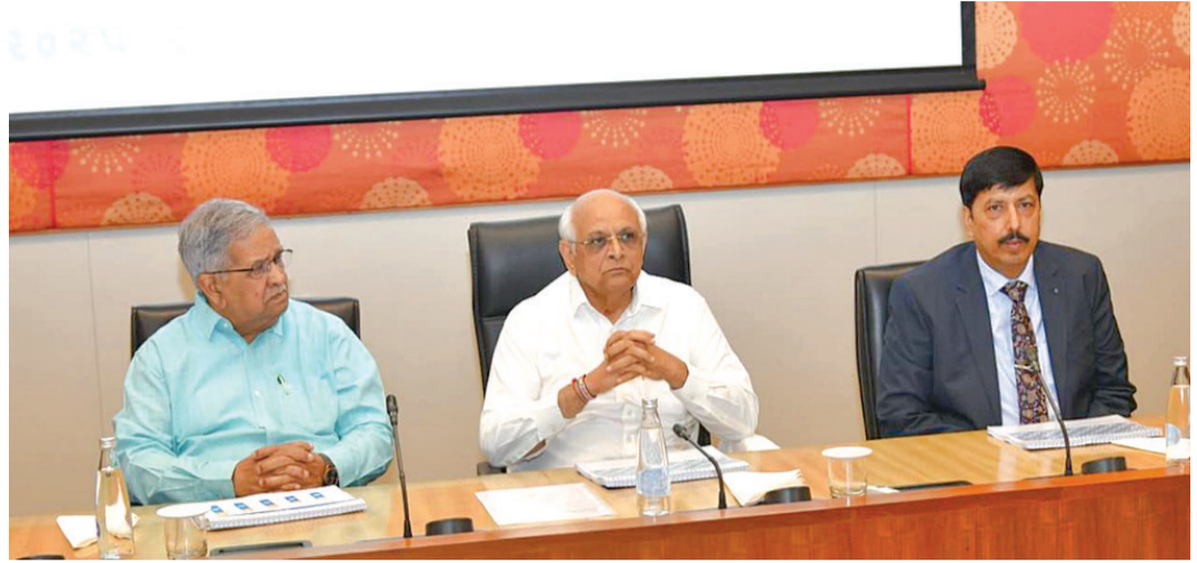
પાસ કરીને ઇન્ફ્રાસ્ટ્રક્ચર પ્રોજેક્ટ્સ મોનિટરિંગ કરવાનું સૂચન કરતાં એવા પ્રોજેક્ટ્સમાં કોઈપણ વિસંગતતાઓ માટે સિસ્ટમેટિક ટેસ્ટિંગ અને ક્વાલિટી દિશા નિર્દેશો આપ્યા કે, જો આવા ધ્યાનમાં આવે તો તેના ઉપર કડક પગલાં