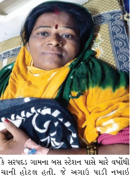
કે સરપકદ ગામના બસ સ્ટેશન પાસે મારે વર્ષોથી યાની હોટલ હતી. જે અગાઉ પાડી નખાઈ

છે. ડિમોલીશનમાં કુલ બૉતેર દુકાનો-છાપરા-હોટલો પાડી નખાયા હતાં. જેને કારણે મારે પાંચ લાખની નુકસાની ગઈ હતી અને હું દેણામાં આવી ગયો છું. હવે ફરીથી બધાએ એ જ સ્થળે દુકાનો-થડા ચાલુ કરી દેતાં મેં પણ મારી જગ્યાએ હોટલ ચાલુ કરી છે. પરંતુ માત્ર મને એકને જ હવે તંત્રવાહકો નોટીસ આપે છે અને યાની હોટલ બંધ કરી દેવાનું કહે છે.