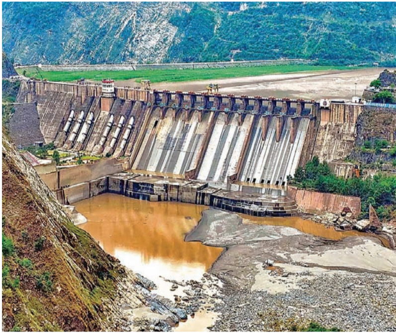
જોખમમાં મૂકાઈ જશે અને તેઓ ભૂખ્યા-તરસ્યા મરવા મજબૂર થશે. ભારતે આ સંધિ રદ કરવા પાછળનું મુખ્ય

નવી દિલ્હી, તા. ૧૯ પહલગામમાં આતંકવાદી હુમલો કરી રદ નિર્દોષની હત્યા કરનારા પાકિસ્તાનને ભારતે એવો પાક ભણાવ્યો છે કે હવે ત્યાંના લોકો ટીપે-ટીપે પાણી માટે વલખા મારી રહ્યા છે. ભારત સરકારે પહલગામ હુમલા બાદ ૧૯૬૦ની સિંધુ જળ સંધિને સ્થગિત કરવાનો ઐતિહાસિક નિર્ણય લીધો હતો, જેના કારણે પાકિસ્તાનનો હવે ભૂખે મરવા મજબૂર થયા છે. આતંકવાદની ફેક્ટરી ચલાવતા પાકિસ્તાનમાં હવે પીવાના પાણીના પણ કાંકા પડી રહ્યા છે અને સ્થિતિ અત્યંત ભયાનક બની રહી છે.