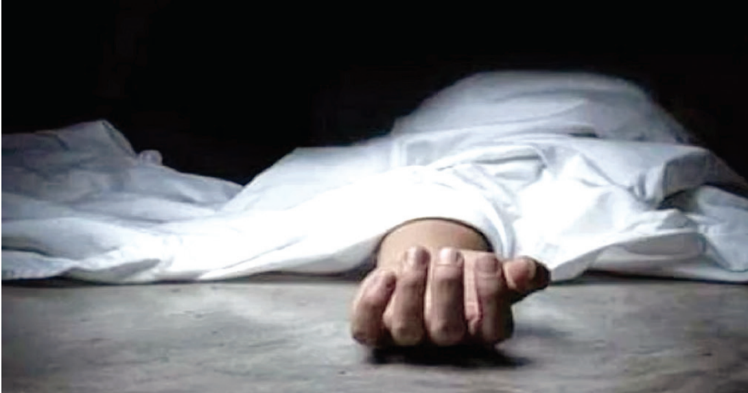
શાદીની તૈયારીની ખુશીમાં હતાં ત્યાં જ ઘરના મોબીનું મૃત્યુ થઈ ગયું હતું. હોસ્પિટલ ચોકીના સ્ટાફે જાણ કરતાં ગાંધીગ્રામ પોલીસે જરૂરી

લઈને જતાં હતાં ત્યારે ગાંધીગ્રામ વિતરાગ સોસાયટી જેન દેરાસર પાસે પહોંચતા ચાલુ રિક્ષાએ હૃદય બેસી જતાં કાબુ ગુમાવતાં રિક્ષા ટેલીફોનના થાંભલામાં અથડાઈ ગઈ હતી. બેભાન હાલતમાં તેમને સિવિલ હોસ્પિટલમાં માતમ છવાઈ ગયો હતો. કરૂણતા એ છે કે સાલમબીન સવારે સાડા દસેક વાગ્યે રિક્ષા લઈને ભાડા કરવા માટે નીકળ્યા હતાં. આ વખતે ચાલુ રિક્ષાએ હૃદય રોગનો હુમલો આવતાં તેણે કાબુ ગુમાવતાં રિક્ષા થાંભલામાં ભટકાઈ ગઈ હતી. બનાવને પગલે લોકો ભેગા થઈ ગયા હતાં. કોઈએ ૧૦૮ બોલાવતાં સિવિલ હોસ્પિટલમાં ખસેડાયા હતાં. પરંતુ અહિં મોત થયું હતું.