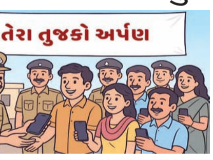
તેરા તુજકો અર્પણ