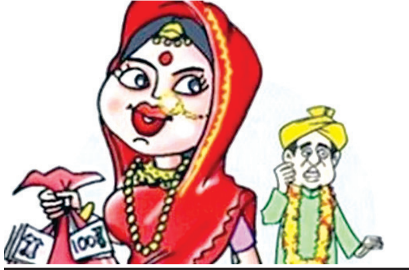
ઠગાઈની બીજી ઘટનામાં પચાસ લાખની લોન કરાવી દેવાના નામે ચૌદ લાખ ખાઈ જવાયા