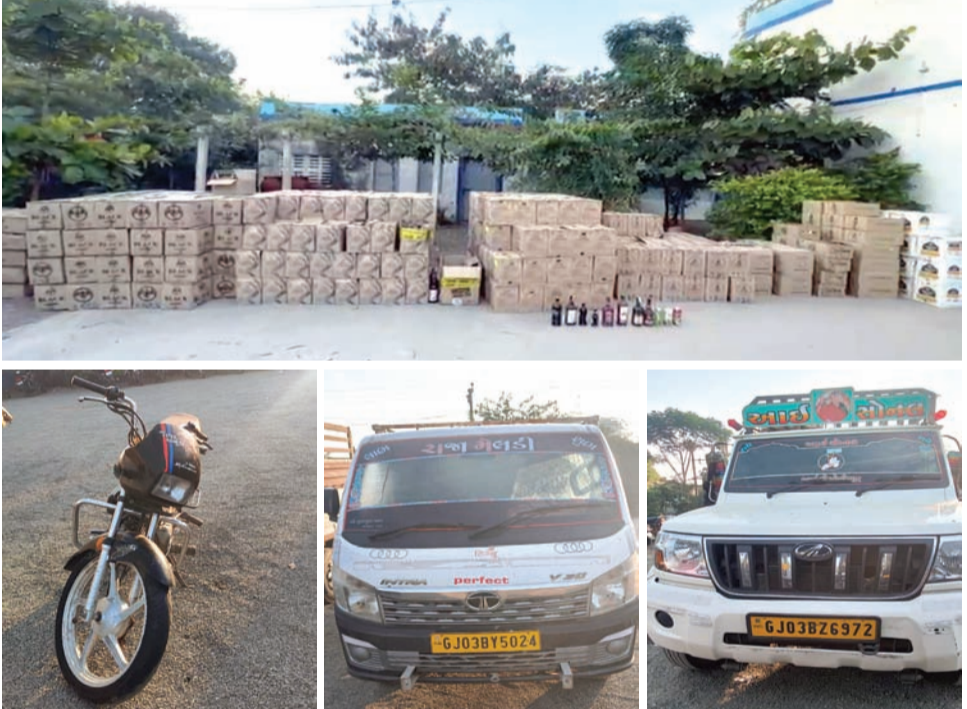
જીઆઈડીસીના પાછળના ભાગે ખુલા મેદાનમાં વિદેશી દારૂનું કટિંગ કરી રહ્યો છે. આ બાતમીના આધારે પોલીસે દરોડો પાડતા ઘટનાસ્થળેથી અલગ-અલગ બ્રાન્ડની દારૂની નાની-મોટી બોટલો અને બીયરના