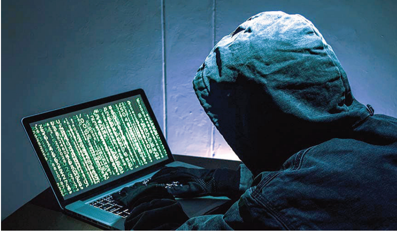
અન્ય બનાવમાં શેર બજાર અને આઈપીઓના નામે યુવાન સાથે સોળ લાખની છેતરપીંડી