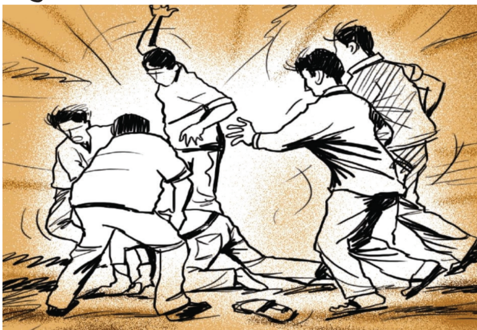
મારામારીની બીજી ઘટનામાં ખેતરમાં બકરા ઘુસી જતાં પાઈપ-પાણાકાના ઘા: બે ઘાયલ થયા

રાજકોટ, તા. ૨૬ નવા જુના ડખ્ખાઓને કારણે માથાકુટની ઘટનાઓ બનતી રહે છે. રોજબરોજ મારામારી, હત્યાના પ્રયાસની કે હાથ પગ ભાંગી નાખવાની ઘટનાઓ બને છે. દરમિયાન એક કિસ્સામાં ચૂંટણીના કોર્મ ભરવાના ડખ્ખામાં એક યુવાન પર દુકાનમાં ઘુસી પાંચ શખ્સોએ હાથકારો હુમલો કરી હત્યાનો પ્રયાસ કર્યો હતો. આ દુકાનદાર યુવાનને બચાવવા વચ્ચે પડેલા તેના બે ભાઈઓને પણ માર મારી ઈજા પહોંચાડવામાં આવી હતી.