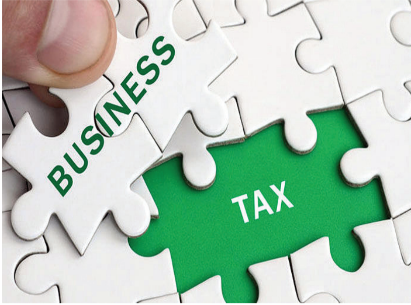
વ્યવસાયવેરાની ખબર જ ન હતી પરંતુ મનપાના અજેટમાં અપાતા વ્યવસાયવેરાના વાર્ષિક લક્ષ્યાંકને પૂર્ણ કરવા માટે તંત્રને ના છૂટકે ઝૂંબેશ શરૂ કરી હતી. એસએસએન્ટ થઈ

ગંભીરતાપૂર્વક વિચાર કરતા નથી. રાજ્ય સરકાર દ્વારા દરેક મહાનગરપાલિકાને પ્રોફેશનલ ટેક્સની કામગીરી સોંપવામાં આવી છે. જે પૈકી રાજકોટ મહાનગરપાલિકા દ્વારા દર વર્ષે લક્ષ્યાંક પૂર્ણ કરવા નવા એસએસએન્ટ અને બાકી દારોને નોટીસ ફટકારવામાં આવે છે. છતાં મોટાભાગના વ્યવસાયકારો જરૂરત હોય ત્યારે ટેક્સ ભરતા હોય તંત્રના કરોડો રૂપિયા ટેક્સ પેટે અટવાયેલા છે. જેના લીધે હવે પ્રોફેશનલ ટેક્સ વિભાગે પણ ના છૂટકે ભાથામાં રાખેલ શસ્ત્ર ઉગામવાની જરૂર પડી છે. તંત્રમાંથી પ્રાપ્ત થયેલ વિગત મુજબ મોટો ટેક્સ બાકી હોય તેવા અરજદારો વિરૂધ્ધ પોલીસ ફરિયાદ કરવામાં આવશે અને છેલ્લા વર્ષના બાકી લેણા પેટે ૬૭૦૦૦ અરજદારોને નોટીસ ફટકારવામાં આવી છે. મનપાના વ્યવસાયવેરા વિભાગમાંથી પ્રાપ્ત થયેલ વિગત મુજબ કોઈ પણ ધંધો કરનારે વ્યવસાયવેરો ભરવો ફરજિયાત છે. રાજ્ય સરકારે પ્રોફેશનલ ટેક્સનો નિયમ ૨૦૦૬માં લાગુ કરેલ જેના અમુક વર્ષો સુધી લોકોને