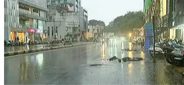
વહાવવાને લોકોને મુશ્કેલીનો સામનો કરવો પડ્યો હતો. રસ્તાઓ પર પાણી ફરી વળતા ટ્રાફિક ધીમો પડી ગયો હતો અને ઘણી જગ્યાએ વાહનોની લાંબી કતારો જોવા મળી હતી. વરસાદના કારણે દિવસ દરમિયાન સાંજ જેવું અંધારું છવાઈ ગયું હતું. ઓછી વિઝિબિલિટી જોવા

રાજકોટ, તા. ૩૧ વર્ષ ૨૦૨૫ ના છેલ્લા દિવસે એટલે કે ૩૧ ની પાર્ટી માટે લોકો થનગની રહ્યા હતા પરંતુ કુદરતને જાણે તે મંજૂર ના હોય તેમ કમોસમી વરસાદના પગલે આયોજકોના આયોજન પર પાણી ફરી વળ્યા અને લોકોએ પણ મન માંડી વાળ્યું તેવું જોવા મળ્યું હતું. ગઈકાલ બપોરથી જ વરસાદી માહોલ સર્જાયું હતો અને સાંજ પડતાની સાથે જ કમોસમી વરસાદ રાજકોટ સહિત અન્ય જિલ્લાઓમાં વરસ્યો હતો. કહી શકાય કે ભાર શિયાળામાં મેઘરાજાએ લોકોના