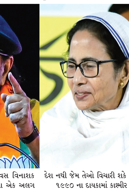
દેવામાં આવશે નહીં. તે દિવસ વિનાશક હશે. તેમણે વધુમાં કહ્યું કે આ એક અલગ દેશ નથી જેમ તેઓ વિચારી શકે છે. ૧૯૮૦ ના દાયકામાં કાશ્મીર ખોળામાંથી ભાજપના નેતાએ કહ્યું કે રાજ્યમાં