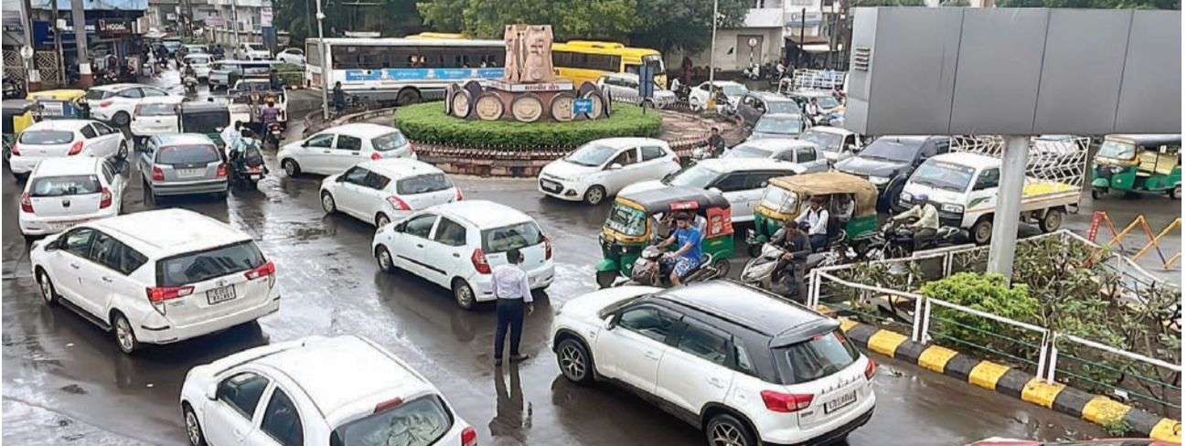
પાછળના નાલાથી અવરજવર કરવા કેરા કરવા પડ્યા હતા. એસ્ટ્રોન ચોક નાલા હેઠળથી હળવા વાહનોનો ખુબ ટ્રાફિક પસાર થાય છે. સરદારનગર, ટાગોર રોડથી આ રોડ અમીન માર્ગ રોડ તરફ જતો વ્યસ્ત માર્ગ છે. ગઈકાલે મનપાએ પાર્થવલાઈનના ખોટકામ માટે આ રોડ બંધ કર્યો હતો. આથી મોડામાં મોડા આવતીકાલથી કાપવા પડ્યા હતા. સવારે આગળ-પાછળના અન્ય લાગુ રોડ પર વાહનોનો જામ પણ લાગ્યો હતો. આ અંગે મનપાના અધિકારીઓનો સંપર્ક કરતા તેમણે જણાવ્યું હતું કે, એસ્ટ્રોન ચોક નાલા હેઠળથી વરસાદી પાણીની પાર્થવલાઈનનું વ્યવહાર માટે હવે ખુબ ઉપયોગી કામ આજે સાંજ સુધી ચાલે તેમ છે. અનેક કામગીરી અંગે પ્રશ્નો ઊભા થયા હતા ત્યારે તાકીદે નિવારણ આવે તે ખુબ જરૂરી છે. મળતી માહિતી મુજબ મહાનગરપાલિકા ની કામગીરી અંગે ઘણા ખરા પ્રશ્નો અગાઉ પણ ઊભા થયા છે અને કામગીરીમાં ઢીલી નીતિના પગલે ઘણા અન્ય પ્રશ્નો પણ સામે આવી રહ્યા છે ત્યારે તાકીદે તેનું નિવારણ લાવવા માટે હાલ તંત્ર દ્વારા શું પગલાં લેવામાં આવશે તે હવે જોવાનું રહ્યું છે.

રાજકોટ, તા. ૫ મહાનગરપાલિકાના અણધાર આયોજનના પગલે હેરાનગતિ અંતે લોકોએ વેઠવી પડતી હોય છે. મળતી માહિતી મુજબ હાલ મહાનગરપાલિકા દ્વારા તે કામગીરી કરવામાં આવી રહી છે તેનાથી અનેક પ્રશ્નો ઉભા થયા છે. હાલ જે વિગતો મળી રહી છે તે મુજબ એસ્ટ્રોન ચોક નાલાને ગઈકાલે મહાનગરપાલિકા દ્વારા અચાનક બંધ કરી દેતા ટ્રાફિકની સમસ્યા સર્જાય છે. પાર્થવલાઈનની કામગીરી હોવાના પગલે હાલ મહાનગરપાલિકા દ્વારા અંડર પાસ ને બંધ કરી દેવામાં આવ્યો છે જેને લઈને ઘણા ખરા અન્ય પ્રશ્નો પણ ઊભા થયા છે ત્યારે તાકીદે આ કામગીરી આટોપી લેવા રાહદારીઓ દ્વારા તંત્રની સામે માંગ કરાય છે. શહેરની મધ્યમાં આવેલા નાના છતાં ટ્રાફિકથી ઘમઘમતા એસ્ટ્રોન ચોક નાલાને ગઈકાલથી મનપાએ અંકાએક બંધ કરતા ટ્રાફિકની અંધારુંથી થઈ હતી. વાહન ચાલકોએ જેનાથી બપોરે વાહનોને ચક્રકર