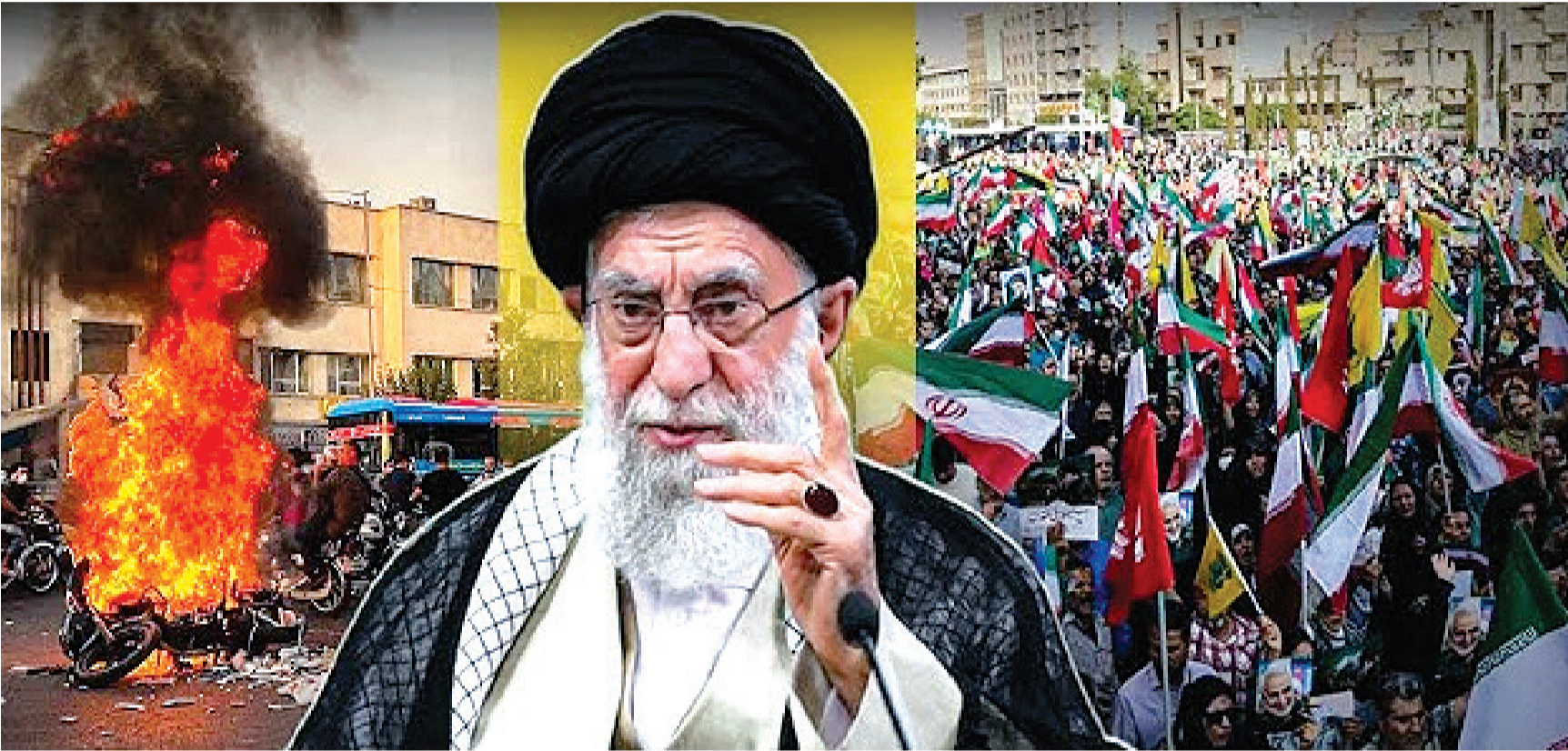
અધિકાર જૂથો મૃત્યુ અને ઘરપકડ અંગે વિવિધ ચકાસણી હજુ સુધી થઈ નથી. અહેવાલો સૂચવે વિરોધ પ્રદર્શનો છે. આ અસ્થિરતા એવા સમયે સંકટમાં છે અને આંતરરાષ્ટ્રીય દબાણ વધી રહ્યું આંકડાઓ જાણવા રહ્યા છે, જેની સ્વતંત્ર રીતે છે કે આ ત્રણ વર્ષમાં ઈરાનમાં થયેલા સૌથી મોટા આવી છે જ્યારે ઈરાનની અર્થવ્યવસ્થા ગંભીર છે. પરિસ્થિતિને ધ્યાનમાં રાખીને, ભારત સરકારે

નવીદિલ્હી, તા. ૫ ઈરાનમાં સુપ્રીમ લીડર આયાતુલાહ અલી ખામેની વિરુદ્ધ ચાલી રહેલા વિરોધ પ્રદર્શનો છેલ્લા અઠવાડિયાથી હિંસક બન્યા છે. આ અથડામણોમાં અનેક લોકોના મોત થયાના અહેવાલ છે. પરિસ્થિતિને ધ્યાનમાં રાખીને, ભારત સરકારે ઈરાન અંગે તેના નાગરિકો માટે ટ્રાવેલ એડવાઈઝરી જારી કરી છે. સોમવારે, વિદેશ મંત્રાલયે ભારતીય નાગરિકોને આગામી સુધી ઈરાનની બિન-જરૂરી મુસાફરી ટાળવાની સલાહ આપી હતી. મંત્રાલયે ઈરાનમાં પહેલાથી જ રહેલા ભારતીય નાગરિકો અને પીઆઈઓને અત્યંત સાવધાની રાખવા, વિરોધ પ્રદર્શનો અથવા ભીડવાળા વિસ્તારો ટાળવા અને સ્થાનિક પરિસ્થિતિઓ પર નજર રાખવા વિનંતી કરી હતી. તેમણે તેમને તેહરાનમાં ભારતીય દૂતાવાસની વેબસાઈટ અને સોશિયલ મીડિયા અપ્લિકેશન નિયમિતપણે નિરીક્ષણ કરવાની પણ સલાહ આપી હતી. નિવાસી વિઝા પર ઈરાનમાં રહેતા ભારતીયોને જો તેઓએ હજુ સુધી નોંધણી કરાવી ન હોય તો દૂતાવાસમાં નોંધણી કરાવવા વિનંતી કરવામાં આવી છે.