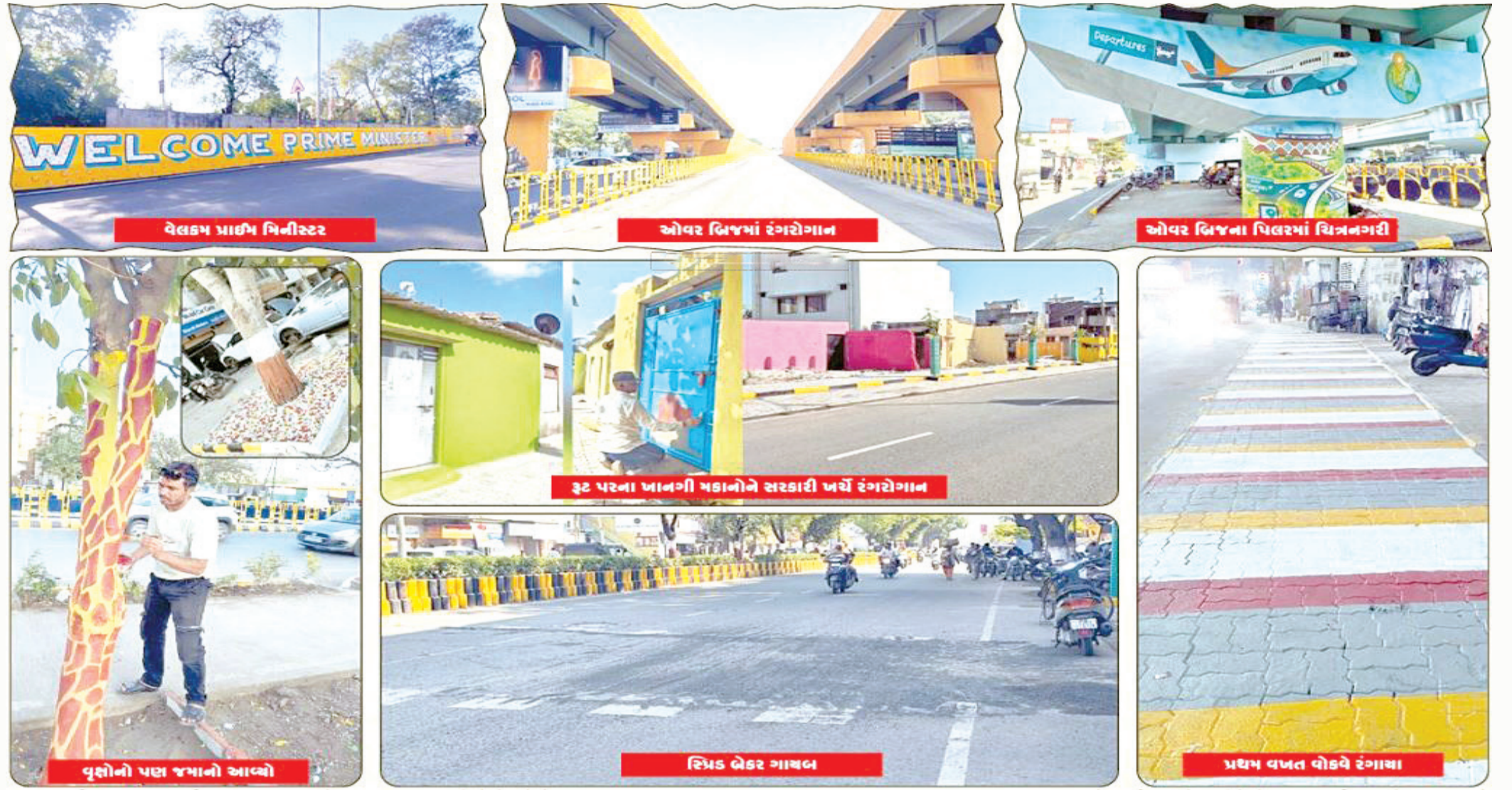
વેલકમ પ્રાઈમ મિનીસ્ટર, ઓવર બ્રિજમાં રંગરોગાન, ઓવર બ્રિજના પિલરમાં ચિત્રનગરી, રૂટ પરના પાનગી મકાનોને સરકારી ખર્ચે રંગરોગાન, સ્ટ્રિક બેકર ગાયબ, પ્રથમ વખત વોકવે રંગાયા

રાજકોટ, તા. ૫ ૧૧મીથી યોજાતી વાર્ષિક કોન્ફરન્સની તૈયારીઓ પૂરજોશમાં ચાલી રહી છે. ત્યારે એક સમાચાર એવા પણ સામે આવ્યા છે કે વડાપ્રધાનનો રોડ-શો કેન્સલ થયો છે. હાલ મળતી માહિતી મુજબ આ કોન્ફરન્સમાં ભારત સિવાયના ૨૩ દેશના પ્રતિનિધિઓ પણ વાર્ષિક સમિટમાં ભાગ લેનાર હોય, વિદેશીઓમાં રાજકોટની છાપ ખરડાય નહીં તેમજ વડાપ્રધાનની નજરે ગંધાર ગોબરું રાજકોટ ચડી જાય નહીં તે માટે એરપોર્ટથી માંડી વાર્ષિક સમિટના સ્થળ મારવાડી યુનિવર્સિટી સુધી તેમજ શહેરના જે વિસ્તારોમાં વિદેશી ડેલિગેટ હરવા ફરવા નીકળે તેમ છે તે તમામ વિસ્તારોમાં અત્યાર સુધી જોવા મળી ન હોય તેવી સાફ સફાઈ અને રંગરોગાન જોવા મળી રહ્યાં છે. શહેરના તમામ ઓવરબ્રીજ સુંદર ચિત્રનગરીમાં ફેરવાઈ ગયા છે તો રસ્તા અને ફુટપાથો ચકાચક થઈ ગયા છે. વડાપ્રધાનના ટ્રે પરથી સ્પીડ બ્રેકર્સ પણ ગાયબ કરી દેવામાં આવ્યા છે તેમજ વૃક્ષોની પણ આકર્ષક ડિઝાઇનથી રંગી નાખવામાં આવ્યા છે. વડાપ્રધાનના ટ્રે ઉપર આવેલા પાનગી મકાનો-દુકાનોને પણ સરકારી ખર્ચે એક સરખા કલરથી રંગી આકર્ષક લુક આપી દેવામાં આવ્યો છે. મહેમાનો અને વડાપ્રધાન રાજકોટ આવે ત્યારે 'આહ રાજકોટ, વાહ રાજકોટ' પોકારી જાય તેવું વાતાવરણ ઉભું કરવામાં વિશાળ સરકારી દળકટક રાત દિવસ કામે લાગ્યું છે. ચોમાસાના સમયે શહેરના મુખ્યમાર્ગોથી માંડી નાની શેરીઓના રસ્તાઓ ભાંગીને ભુક્કો થઈ ગયા હતાં. શહેરી જનોએ ડેરેટર વિરોધ નોંધાવી મોરચા કાઢ્યા હતાં. પરંતુ મહાનગર પાલિકાના સત્તાવાળાઓ લાંબો સમય સુધી રીપેર કરી શક્યા ન હતાં. જ્યારે રાજકોટમાં વાર્ષિક રીજીઓલ સમિટ જોરે થઈ અને વડાપ્રધાન પણ આવી રહ્યાં છે ત્યારે કોર્પોરેશનના તંત્રએ ચમત્કાર સર્જ્યો હોય તેમ ગણતરીના દિવસોમાં સમગ્ર શહેરની શિકલ બદલી નાખી છે. આ