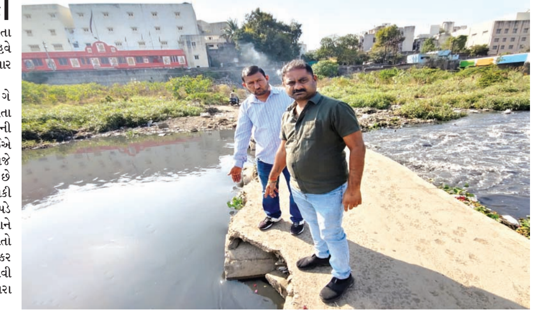
આ બેઠા પુલ અંગે અનેકવિધ પ્રકારે વિરોધ ઊઠવા પામ્યા હતા પરંતુ મહાનગરપાલિકાના અધિકારીઓની નિરસતા ના પગલે હાલ જે કામ થવું જોઈએ તે તે દિવસે પણ થયું ન હતું અને આજે પણ સ્થિતિ યથાવત જોવા મળી રહી છે અહીંથી પસાર થતાં લોકોને ભારે હાલાકી અને હેરાનગતિનો સામનો પણ કરવો પડે છે. આ તમામ બાબતોની ગંભીરતાને ધ્યાને લઈને કોંગ્રેસ દ્વારા અનેક વખત રજૂઆતો કરવામાં આવી પરંતુ તંત્ર દ્વારા કોઈ નક્કર કાર્યવાહી આજ દિન સુધી કરવામાં આવી નથી જે અંગે કોંગ્રેસના આગેવાનો દ્વારા વિરોધ દર્શાવવામાં આવ્યો હતો.

ભુંગળા હતા એ ૬૦૦ના નાખવાના હતા પરંતુ નવા પુલનું કામ થતું નથી. આથી હવે કોંગ્રેસ સ્વખર્ચે આ પુલનું કામ કરવા તૈયાર થઈ છે. અગાઉ પણ આ બેઠા પુલ અંગે અનેકવિધ પ્રકારે વિરોધ ઊઠવા પામ્યા હતા પરંતુ મહાનગરપાલિકાના અધિકારીઓની નિરસતા ના પગલે હાલ જે કામ થવું જોઈએ તે તે દિવસે પણ થયું ન હતું અને આજે પણ સ્થિતિ યથાવત જોવા મળી રહી છે અહીંથી પસાર થતાં લોકોને ભારે હાલાકી અને હેરાનગતિનો સામનો પણ કરવો પડે છે. આ તમામ બાબતોની ગંભીરતાને ધ્યાને લઈને કોંગ્રેસ દ્વારા અનેક વખત રજૂઆતો કરવામાં આવી પરંતુ તંત્ર દ્વારા કોઈ નક્કર કાર્યવાહી આજ દિન સુધી કરવામાં આવી નથી જે અંગે કોંગ્રેસના આગેવાનો દ્વારા વિરોધ દર્શાવવામાં આવ્યો હતો.