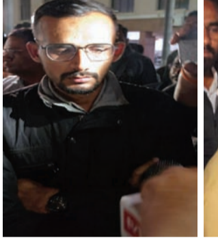
રાજકોટ, તા. ૫

વોર્ડ નં ૧૮ના પેવિંગ બ્લોકના પેટા કોન્ટ્રાક્ટર અને આસિસ્ટન્ટ ઈજનેરને વચ્ચે પેવિંગ બ્લોકની કામગીરી મુદ્દે ઉગ્ર બોલાચાલી થયા બાદ પેટા કોન્ટ્રાક્ટરે ઉછેરાઈ જઈ ને આસિસ્ટન્ટ ઈજનેરને ફડાકો મારી દેતાં કર્મચારીઓ વીજળીક હડતાળ પર ઉતરી ગયા હતા. છપઈ ના એ-જી ની ચરોંગ એસોસિએશનના હોદ્દેદારો જવાબદાર અધિકારી પાસે રજૂઆત કરવા ગયા હતા પણ, તેઓ વાઈબ્રન્ટ સમિટ