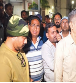
રાજકોટ, તા. ૫

વોર્ડ નં ૧૮ના પેવિંગ બ્લોકના પેટા કોન્ટ્રાક્ટર અને આસિસ્ટન્ટ ઈજનેરને વચ્ચે પેવિંગ બ્લોકની કામગીરી મુદ્દે ઉગ્ર બોલાચાલી થયા બાદ પેટા કોન્ટ્રાક્ટરે ઉછેરાઈ જઈ ને આસિસ્ટન્ટ ઈજનેરને ફડાકો મારી દેતાં કર્મચારીઓ વીજળીક હડતાળ પર ઉતરી ગયા હતા. છપઈ ના એ-જી ની ચરોંગ એસોસિએશનના હોદ્દેદારો જવાબદાર અધિકારી પાસે રજૂઆત કરવા ગયા હતા પણ, તેઓ વાઈબ્રન્ટ સમિટ