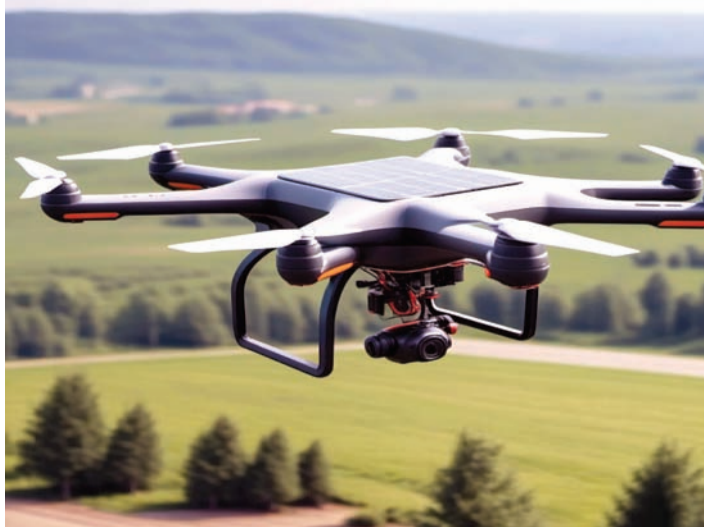
કોમ્યુનિકેશન રિલે જેવા કાર્યો કરી શકે છે. સરહદો સુધીના વિસ્તારોનું અસરકારક રીતે આ સિસ્ટમ હિમાલય ક્ષેત્રથી લઈને રણ નિરીક્ષણ કરવામાં સક્ષમ છે.

ચીન અને પાકિસ્તાન દ્વારા ઉભા થયેલા સુરક્ષા પડકારોના સંદર્ભમાં ભારતીય સેના દ્વારા સૌર ઉર્જાથી ચાલતી MAPSS ડ્રોન સિસ્ટમની ખરીદીને મહત્વપૂર્ણ માનવામાં આવે છે. આ સિસ્ટમ એવા સમયે આવી છે જ્યારે ભારત નિયંત્રણ રેખા (LoC) અને વાસ્તવિક નિયંત્રણ રેખા (LAC) પર એક સાથે તકેદારી રાખી રહ્યું છે. ચીન સાથેની વાસ્તવિક નિયંત્રણ રેખા (LAC) પર સતત અવિરત દેખરેખ રાખવા સક્ષમ બનાવશે. પાકિસ્તાનથી LAC પર ઘુસણખોરી અને ડ્રોન દ્વારા શસ્ત્રો અને ડ્રગ્સની દાણખોરી, સતત પડકાર રહે છે. MAPSS જેવા શાંત અને લાંબા સમય સુધી ચાલતા ડ્રોન પાકિસ્તાની પ્રવૃત્તિઓ પર ગુપ્ત અને સતત દેખરેખ રાખવા સક્ષમ બનાવશે. IDEX યોજના હેઠળ હસ્તાક્ષર કરાયેલ આ કરાર ભારતની આત્મનિર્ભર ભારત અને ગ્રીન ડિફેન્સ ટેકનોલોજી નીતિઓને પણ મજબૂત બનાવે છે. તે સ્પષ્ટ છે કે LAC હોય કે LAC, ભારતીય સેના હવે ચીન અને પાકિસ્તાન બંને દ્વારા ઉભા કરાયેલા પડકારોનો ઉચ્ચ-ટેક, સ્વદેશી માટે તૈયાર છે. ભારતીય સેનાએ ન્યૂરપેસ રિસર્ચ એન્ડ ટેકનોલોજી પાસેથી ૨૬,૦૦૦ ફૂટથી વધુ ઊંચાઈ પર ૨૪ કલાકથી વધુ સમય સુધી દેખરેખ રાખી શકે છે. તે હિમાલય અને રણ સરહદો માટે ખૂબ અસરકારક છે.