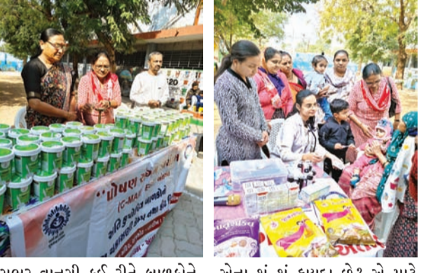
સભર વાનગી કઈ રીતે બાળકોને જમાડવી અને કેટલી જમાડવી અને એના શું શું ફાયદા છે? એ માટે દરેક વાલીને સમજ આપવામાં

રાજકોટ, તા. ૧૦ ઈસ્ટ ઝોનના વોર્ડ નંબર ૪ના જ્યોતિબા ફૂલે પ્રાથમિક શાળામાં SAM, MAM, SUW, MUW બાળકોનો આરોગ્ય તપાસણી કેમ્પ યોજવામાં આવ્યો હતો. જેમાં બાળકોનું વજન-ઉંચાઈ અને આરોગ્ય તપાસણી કરવામાં આવી હતી અને, જરૂરી દવા આપવામાં આવી હતી આ ઉપરાંત શેર વિથ સ્માઈલના સહયોગથી પ્રોટીન પાવડર આપવામાં આવ્યો હતો. આંગણવાડી કેન્દ્રમાંથી મળતા બાલશક્તિના પેકેટમાંથી વિવિધતા