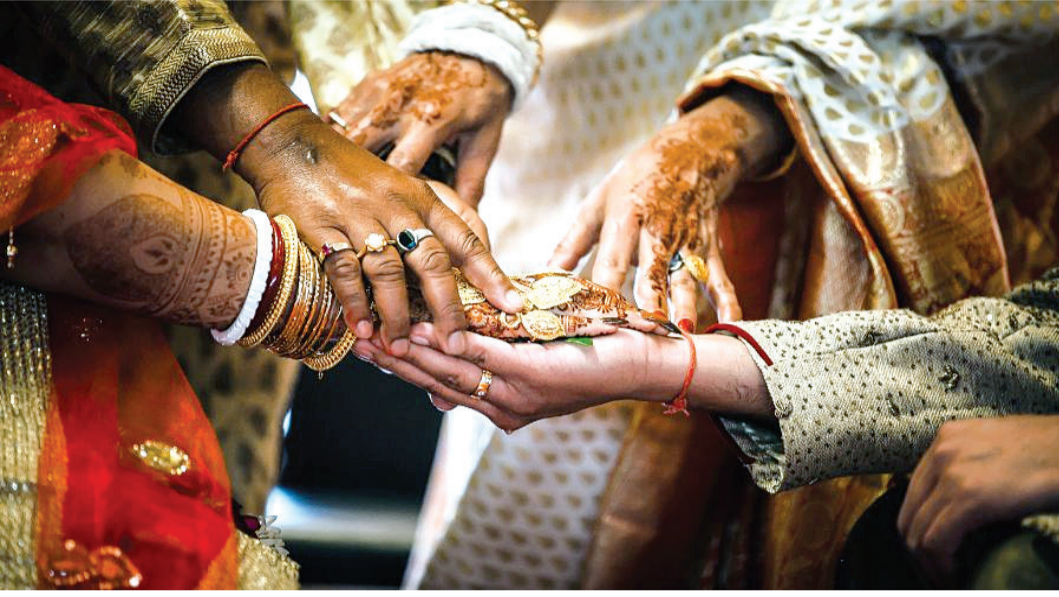
અન્ય કિસ્સામાં બહેનના પ્રેમીની હત્યા બાદ સત્તર વર્ષથી ફરાર આરોપી ઝડપાઈ ગયો