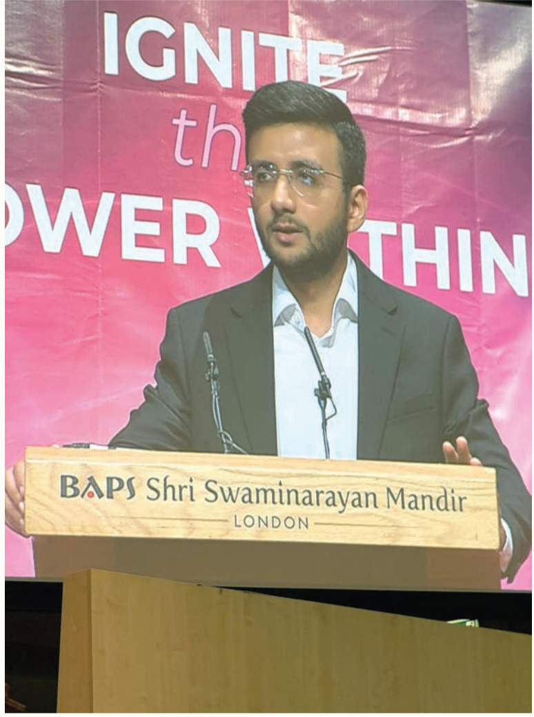
કમાચેલા સમાધાનના ચાર સ્તંભો

"આવશ્યક આવશ્યકતાઓ" પૂરી કરવા ઉપરાંત, અરજદારોએ સેટલમેન્ટ માટે બેઝલાઈન લાયકાતનો સમયગાળો પણ પૂર્ણ કરવો આવશ્યક છે. સેટલમેન્ટ સ્ટેટસ માટે અરજ કરતા પહેલા યુકેમાં રહેવા માટે આ ઓછામાં ઓછા સળંગ વર્ષોની સંખ્યા છે. દરખાસ્તો હેઠળ, સેટલમેન્ટ માટે બેઝલાઈન લાયકાતનો સમયગાળો વર્તમાન પાંચ વર્ષથી વધારીને ૧૦ વર્ષ કરવામાં આવશે. આ ૧૦-વર્ષની બેઝલાઈન ચાર મુખ્ય પરિબળો હેઠળ વિવિધ વિચારણાઓના આધારે ઉપર અથવા નીચે ગોઠવી શકાય છે.