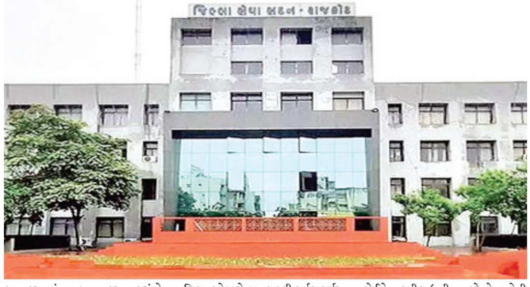
કામ કરવાનું આહવાન કરતા કહ્યું કે, પરિપત્રો-નિયમોનું જિલ્લાઓમાં અલગ અલગ અર્થઘટન ન થાય અને લોકોને પોતાના કામોમાં સરળતા રહે તે માટે જિલ્લા કલેક્ટરો જવાબદારી પૂર્વક કાર્યરત રહે. મુખ્યમંત્રીએ જણાવ્યું કે, સરકાર તમારી સાથે છે અને સાચી વ્યક્તિ પરેશાન ન થાય અને ખોટી વ્યક્તિ

અમલનું મોનીટરીંગ કરવા સૂચનો કર્યા હતા. તેમણે ઓનેસ્ટી, ઇન્ટીગ્રિટી, કોમ્પીટન્સ અને ઇફેક્ટિવનેસના મુખ્ય આધાર પર સમગ્ર જિલ્લાની કામગીરીનું નેતૃત્વ કરવાનો પણ અનુરોધ કલેક્ટરોને કર્યો હતો. મુખ્યમંત્રી ભૂપેન્દ્ર પટેલે જિલ્લા કલેક્ટરોને જણાવ્યું કે, તેમણે જિલ્લાના વડા તરીકેનું જે દાખિત્વ મળ્યું છે તેને નાનામાં નાના માનવીની સમસ્યાના નિરાકરણની જવાબદારી નિભાવીને વહન કરવાની મોટી તક છે. રાજ્યમાં જે સંગીન નાણાકીય વ્યવસ્થાપન છે તેના કારણે હવે વિકાસ કામોમાં નાણાંની કોઈ તંગી નથી પડતી આ સંજોગોમાં જિલ્લામાં વિવિધ યોજનાઓના ચાલતા વિકાસ કામો ઝડપી અને ગુણવત્તાયુક્ત થાય તે માટે જિલ્લાની ટીમનું નેતૃત્વ કરીને કલેક્ટરો યોગ્ય નિગરામી રાખે. ભૂપેન્દ્ર પટેલે સમગ્ર રાજ્યના જિલ્લા કલેક્ટરોને ટીમવર્કથી અને એકબીજા સાથે ચર્ચા કરીને સાથે મળીને