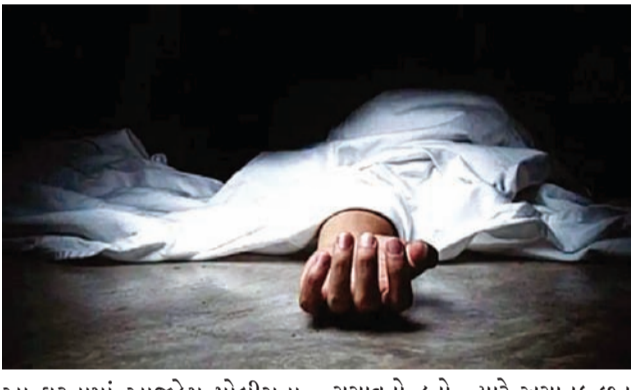
આ ઘટનામાં આજીએમ પોલીસના સ્ટાફે જરૂરી કાગળો કર્યાં હતા. વધુ વિગતો મુજબ કોઠારીયા સોલવન્ટ પાસેના સોમનાથ વે શ્રીજની બાજુમાં જ આઈડીસીમાં આવેલી કંપનીના છત પર અંશ જીહેર કર્યાં હતો. આ ઘટનામાં આજીએમ પોલીસને બનાવની જાણ

રાજકોટ, તા.૧૬ કોઠારીયા સોલવન્ટ વિસ્તારમાં કારખાનાની છત પર પતંગ ચગાવતી સમયે અકસ્માતે નીચે ગબડેલા બાળકનું મોત થયું હતું. જ્યારે રૈયાધારમાં રહેતો અને મેલડી માતાજીના મંદિરે દર્શન માટે જતા યુવાનનું બાઈક સ્લીપ થયા બાદ ગંભીર ઈજાઓથી મોત થયું હતું. અપમૃત્યુના ત્રીજા બનાવમાં મીલપરા વિસ્તારમાં એક ૧૦૦ વર્ષના વૃદ્ધા અકસ્માતે પહેલા માળેથી ગબડતા મૃત્યુ થયાનો બનાવ સિવિલ હોસ્પિટલમાં નોંધાયો હતો. શહેરના કોઠારીયા સોલવન્ટ વિસ્તારમાં સોમનાથ વે શ્રીજ પાસે આવેલા એક કારખાનામાં છત પર પતંગ ચગાવતી વેળાએ શ્રમિક પરિવારના આઠ વર્ષના બાળકનું નીચે પટકાતા મોત નિપજ્યું છે.