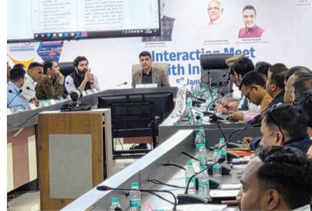
જિલ્લાકક્ષાની ઉજવણીના આયોજન માટે કાયદો અને વ્યવસ્થાની જાળવણી, પોલીસ બેન્ડ, પરેડ તથા સલામતીની વ્યવસ્થા, સાંસ્કૃતિક કાર્યક્રમો, સ્ટેજ,મંડપ તથા માર્ક પોડીયમની વ્યવસ્થા, સન્માનપત્રો તૈયાર કરવાં,વાહન પાર્કિંગની વ્યવસ્થા, કાર્યક્રમનાં

બેઠક યોજાઈ હતી. રાજકોટ જિલ્લા કક્ષાના પ્રજાસત્તાક પર્વની ઉજવણી જેતપુર ખાતે કરવામાં આવશે. જિલ્લા કક્ષાના કાર્યક્રમનું રિહર્સલ ૨૩મી જાન્યુઆરીના રોજ બપોરે ૩ કલાકે યોજાશે. બેઠકમાં જિલ્લા કલેક્ટરે પ્રજાસત્તાક દિનના રાષ્ટ્રીય પર્વની ગરિમામય ઉજવણી થાય તે માટે જરૂરી સંકલન સાથે દરેક વિભાગ પોતાની સોંપાયેલ કામગીરી સમયસર પૂર્ણ કરે તે અંગે સૂચનાઓ આપી હતી. તેમણે કાર્યક્રમોની પૂર્વતૈયારી માટે રચાયેલી વિવિધ સમિતિઓની કામગીરીની પણ સમીક્ષા કરી જરૂરી માર્ગદર્શન પૂરું પાડ્યું હતું. આ બેઠકમાં જિલ્લા કલેક્ટરે જેતપુર ખાતે યોજાનાર