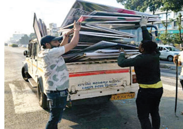
વગર શહેરમાં સર્કલ, ડિવાઈડર, બગાડવાની પ્રવૃત્તિ આ રીતે ચાલુ પોલ, ફિલાલો પર સુશોભન હોય અને સતત કાર્યવાહી ચાલતી

રાજકોટ, તા. ૧૭ મ્યુનિ. કોર્પોરેશનની દબાણ હટાવ શાખા દ્વારા પબ્લિકિયામાં ૨૧ રેકડી-કેબીન ઉપાડવામાં આવ્યા હતા. તો અલગ અલગ વિસ્તારોમાં આડે ઘડ ખડકી દેવાયેલા સાડા ચાર હજાર જેટલા બોર્ડ-બેનર ઉતારીને જમ કરવામાં આવ્યા છે. દબાણ હટાવ વિભાગે શહેરના જામનગર રોડ, જલારામ ચોક, જંકશન પ્લોટ, રેસકોર્ષ રોડ, યુનિ.રોડ, ૧૫૦ ફુટ રોડ, નાણાવટી ચોક, સાચુ વાસવાણી રોડ, પટેલ કન્યા છાત્રાલય, કોઠારીયા રોડ, સેટેલાઈટ ચોક પરથી ૪૪૩૦ બોર્ડ-બેનર જમ કરવામાં આવ્યા હતા. મંજૂરી