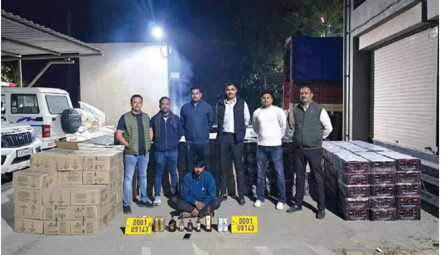
ટ્રકની તલાશી લેતા પોલીસને મેગપાઇપર વ્હીસ્કીની નાની-મોટી રોયલ સ્ટેગ વ્હીસ્કી, ઓલ્ડ મોન્ડ રમ, બેગપાઇપર વ્હીસ્કીની નાની-મોટી બોટલો તેમજ બડવાઈઝર અને કાર્લસબર્ગ

બીયરના ટીન મળી કુલ ૧૩,૯૪૪ નંગ દારૂ/બીયર કિંમત ૫૩,૬૮,૦૮૦ મળી આવ્યો હતો. આ ઉપરાંત ₹૧૦ લાખની કિંમતનો આઈસર ટ્રક, મોબાઈલ ફોન અને ચોખાના ભુસાના ૧૦૬ બાચકા મળી કુલ ૬૩,૬૩,૫૮૦નો મુદ્દામાલ જમ કરવામાં આવ્યો છે.