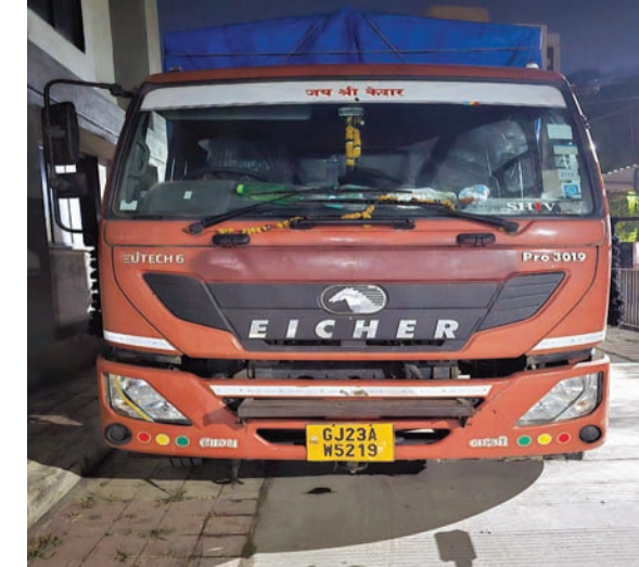
માટે ટ્રક પર ખોટી નંબર પ્લેટ GJ-23-AW-5219 લગાવી હતી, જ્યારે ટ્રકનો અસલી નંબર DD-01-U-9143 હોવાનું પુલ્યું હતું.