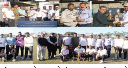
રાજકોટ, તા.૧૯ ઈન્સ્ટીટ્યુટ ઓફ ચાર્ટર્ડ એકાઉન્ટન્ટ્સ ઓફ ઈન્ડિયાની રાજકોટ શાખા દ્વારા આંતર વિભાગીય મિત્રતા ક્રિકેટ ટુર્નામેન્ટનું આયોજન કરવામાં આવ્યું હતું. માધ્યમર ચોકડી નજીકના જગમત ક્રિકેટ ગ્રાઉન્ડ મેક ક્રિકેટ એકેડેમી ખાતે મેચ યોજાયો હતો. રાજકોટ એડવોકેટ બાર એસોસિએશન, સીજીએસટી, એસજીએસટી, આવક વેરા, આઈસીએસઆઈ રાજકોટ શાખા, પોલીસ ને આઈસીએઆઈ રાજકોટ શાખા વચ્ચે મેચ રમાઈ હતી. ટુર્નામેન્ટનો ઉદ્દેશ્ય વ્યવસાયિક સંવાદિતા

કરવા અનુરોધ કરાયો છે. કવચ કેન્દ્ર દ્વારા રાજ્યની તમામ કોલેજો અને યુનિવર્સિટીઓના વિદ્યાર્થીઓને આ સ્પર્ધામાં વધુમાં વધુ ભાગ લેવા અનુરોધ કરવામાં આવ્યો છે. અત્રે નોંધનીય છે કે, કવચ કેન્દ્ર (Cybersecurity Awareness and Creative Handholding-CAWACH Kendra), શિક્ષણ વિભાગ, ગુજરાત સરકારનો મુખ્ય હેતુ રાજ્યની તમામ ઉચ્ચ તથા ટેકનિકલ શિક્ષણ સંસ્થાઓ દ્વારા સાયબર સ્વચ્છતા, સાયબર ક્રાઈમ નિવારણ અને સાયબર સુરક્ષા અંગે માગદર્શન તથા જાગૃતિ પૂરું પાડવાનો છે.