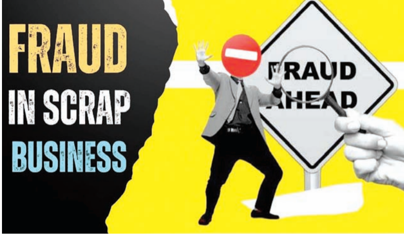
ગાડીનું વજન ખરેખર વજન કરતા ૨૫૦ થી ૩૦૦ કિલો ઓછું લખાવતા હતા. પાલી ગાડીનું વજન ઓછું આવવાને કારણે એટલો વજન પ્લાસ્ટિકના માલમાં ઉમેરાઈ જતો