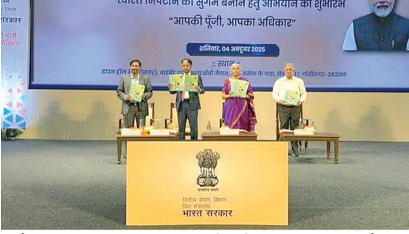
કમાયેલી મહામૂલી મૂડી-બચત છે. આ બચત શિક્ષણ, આરોગ્ય સંભાળ અને નાણાકીય સુરક્ષાને વધુ મજબૂત બનાવશે તેવું મનાય છે. ઉલ્લેખનીય છે કે, તા. ૩૧ ઓગસ્ટ, ૨૦૨૫ સુધીમાં દેશભરની વિવિધ બેંકોએ અંદાજે રૂ. ૭૫ કરોડની રકમ પરત કરવામાં આવી છે. આ ઉપરાંત ઈઈઈ પાસે વીમા ક્ષેત્રમાં લગભગ રૂ. ૧૪ કરોડ કરોડ, મ્યુચ્યુઅલ ફંડ ઈન્ડસ્ટ્રીમાં રૂ. ૩ કરોડ કરોડ, કંપનીઓમાં રૂ. ૬ કરોડ કરોડ અને રૂ. ૧૯ કરોડ કરોડના મૂલ્યાંકન શેર બિનઆયોજિત રીતે જમા છે. આમ, દેશમાં અંદાજે કુલ રૂ. ૧.૮૨ લાખ કરોડ રકમ અનકલેબ છે. હવે સમયાંતરે આ રકમ પરત કરવાનું શરૂ થવાથી ગરીબ અને મધ્યમવર્ગીય પરિવારોને ખૂબ મોટો ફાયદો થઈ રહ્યો છે. ગુજરાતમાં જાહેર ક્ષેત્રની બેંકોમાં અંદાજે ૨,૮૩૬.૮૦ કરોડ તેમજ વીમા કંપનીઓમાં અંદાજે ૨૩૫ કરોડની રકમ અનકલેબ પડી છે, જેમાંથી આ અભિયાન

રાજકોટ, તા.૧૯ 'તમારા પૈસા, તમારો અધિકાર' ટેગલાઈન હેઠળ રાષ્ટ્રવ્યાપી નાણાકીય જાગૃતિ અભિયાનની શરૂઆત કેન્દ્રીય નાણા મંત્રી નિર્મલા સિતારમનની ઉપસ્થિતિમાં ઓક્ટોબર-૨૦૨૫માં ગુજરાતની રાજધાની ગાંધીનગરથી કરવામાં આવી હતી. આ અભિયાન અંતર્ગત ગુજરાતમાં તા. ૩૧ ડિસેમ્બર-૨૦૨૫ની સ્થિતિએ કુલ રૂ. ૧૦૪.૬૧ કરોડની રકમ એટલે કે, તેમની મહામૂલી મૂડી સ્વમાનભેર પરત કરાવામાં આવી છે. રાજ્યમાં આ અભિયાનના પ્રારંભથી ડિસેમ્બર-૨૦૨૫ સુધીમાં કુલ ૨૬,૮૭૪ ટાપા રજૂ કરવામાં આવ્યા હતા. આ ટાપાઓની નિયમ મુજબની ખરાઈ કરીને સંબંધિત વિધિ દ્વારા ખાતેદારોને તેમની રકમ પરત કરવામાં આવી છે. આ ઝુંબેશ એક સરળ પણ શક્તિશાળી સંદેશ આપે છે કે નાગરિકો દ્વારા મ્યુચ્યુઅલ ફંડ રૂપિયો તેમને અથવા તેમના પરિવારને પરત કરવો જોઈએ. વધુમાં ટાપો ન કરાયેલ થાપણો, વીમાની આવક, ડિવિડન્ડ, મ્યુચ્યુઅલ ફંડ બેંકલેન્ડ અને પેન્શન ફંકટ કાગળ પરની એન્ટ્રીઓ નથી, તે સામાન્ય પરિવારોની મહેનતથી