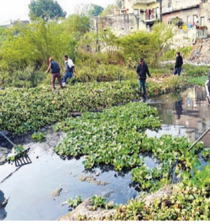
કરવામાં આવી છે. મચ્છરની ઘનતા વધુ હોય તેવા વિસ્તારોમાં વડિકલ માઉન્ટેન ફોર્મીંગ મશીન ફોર્મીંગ કામગીરી કરવામાં આવે છે. તથા સંવેદનશીલ

રાજકોટ, તા.૨૭ રાજકોટમાં ફરી થી ડેવ્યુની એન્ટ્રી થઈ છે. ૨૦૨૬ના વર્ષમાં પ્રથમ વખત જ વિતેલા સમાહમાં ડેવ્યુના બે કેસ નોંધાયા છે. આ સિવાય શરદી ઉદ્યોગના દ્વારા ઊભા થતા જાહેર ૨૦૩૨ કેસ જાહેર થયા છે. અલગ અલગ સ્થળોએથી પાણીના ૧૨૫૬ ક્લોરિન ટેસ્ટ કરવામાં આવ્યા છે. રોગચાળા દ્વારા ઊભા થતા જાહેર આરોગ્ય પડકારને પહોંચી વળવા માટે રાજકોટ મહાનગરપાલિકા દ્વારા તે અંતર્ગત વાહક નિયંત્રણની કામગીરી હેઠળ તા.૧૯ થી તા.૨૫ જાન્યુઆરી દરમિયાન ૧૭૨૫૫ ઘરોમાં પોરનાશક કામગીરી કરવામાં આવી છે. તથા ક્લિલેવર્કરો દ્વારા ૬૦૯ ઘરોમાં ફોર્મીંગ કામગીરી