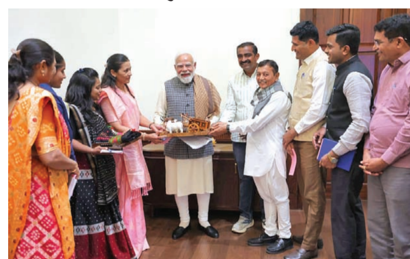
ઉંડો રસ પણ દાખવ્યો હતો. ગ્રામ વિકાસ સમિતિએ જણાવ્યું કે આ મહોત્સવ 'આત્મનિર્ભર ભારત' અને 'સમૃદ્ધ ગામ - સમૃદ્ધ ભારત'ના પ્રધાનમંત્રી

રાજકોટ, તા. ૨૮ પાલિતાણાના હણોલ ગામે છેલ્લા ૧૦ વર્ષથી આત્મનિર્ભરતા, નવીનતા અને સાંસ્કૃતિક સમૃદ્ધિના ક્ષેત્રે નોંધપાત્ર પ્રગતિ કરી છે. આવી સફળતાને આગળ વધારવા અને ગ્રામિણ ભારતની પ્રગતિને પ્રોત્સાહિત કરવા હણોલ ગ્રામ વિકાસ સમિતિ દ્વારા આગામી ૧૩થી ૧૫ જાન્યુઆરી, ૨૦૨૬ના રોજ 'આત્મનિર્ભર હણોલ મહોત્સવ ૨૦૨૬'નું ભવ્ય ત્રિદિવસીય આયોજન કરવામાં આવનાર છે. આ મહોત્સવનું ઉદઘાટન કરવા માટે વડાપ્રધાન નરેન્દ્રભાઈ મોદીને નિમંત્રણ અપાયું છે. હણોલના પતનીપુત્ર અને કેબિનેટ મંત્રી ડો. મનસુખભાઈ માંડવિયાની આગેવાનીમાં હણોલ ગ્રામ વિકાસ સમિતિએ દિલ્હી પહોંચીને પ્રધાનમંત્રી મોદીની રૂમરૂમલાકાત લીધી હતી. પ્રધાનમંત્રી મોદીએ સમિતિના પ્રયત્નો પ્રશંસનીય ગણાવ્યા અને ગ્રામિણ વિકાસ વિષયક ચર્ચામાં