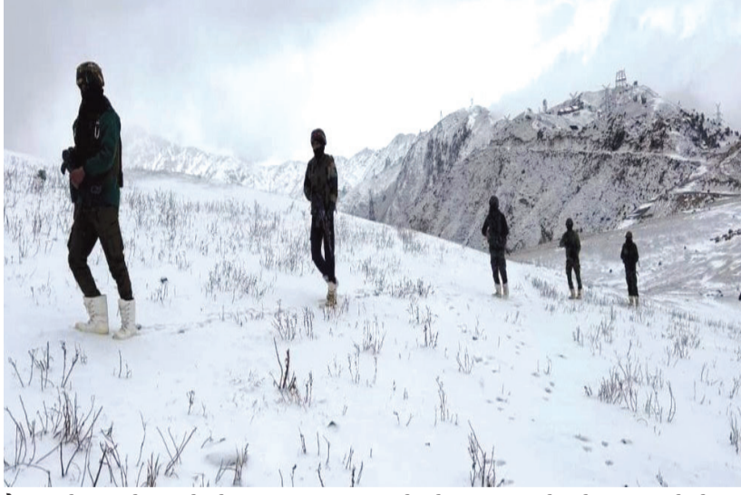
તૈનાત હોવાનું જોવા મળે છે. અહીં બરફીલી પહેરીને ફરી રહ્યાં છે, જેથી દુશ્મનને તેમની ચાદર વચ્ચે જવાનો વિશેષ સફેદ યુનિફોર્મ સ્થિતિ અંગે જોઈ વિગતો કે જાણકારી ના મળી શકે.

પણ તેમની દેશપ્રેમની ભાવના અટલ છે. દેશની સેવા માટે જવાનો અત્યારે દરેક પરિસ્થિતિમાં લડવા માટે સક્ષમ છે, ભારત સરકાર દ્વારા પણ સેના સંપૂર્ણ સુવિધા આપવામાં આવી રહી છે. કાશ્મીરમાં ભીષણ ઠંડી અને બરફબારીની વચ્ચે પણ જવાનો અડગ જોવા મળે છે. ચિત્તાર્થ કલાનમાં અત્યારે કાશ્મીરમાં ભીષણ ઠંડી અને બરફ વરસાદની શરૂઆત થઈ ગઈ છે. એલઓસીથી સંલગ્ન પર્વતીય વિસ્તારોમાં ત્રણ-ચાર વખત બરફ વર્ષા થઈ ચૂકી છે, જેના કારણે હિંમતપૂર્વક અને બરફીલા તોફાનોનું જોખમ વધ્યું છે. પીઓકેમાં ૧૫૦ જેટલા આતંકવાદી એલઓસી પર ધૂસણખોરી માટે તૈયારી કરી રહ્યા હોવાની સુરક્ષા એજન્સીઓને જાણકારી મળી છે. આથી સેનાએ વિશેષ ટુકડીઓ તૈનાત કરી છે જે ભીષણ ઠંડીના વાતાવરણમાં પણ યુદ્ધ કરવામાં પ્રવીણ છે. આ જવાનો અત્યાધુનિક હથિયારોથી સજ્જ છે. જવાનો સફેદ યુનિફોર્મ પહેરી સુરક્ષા માટે