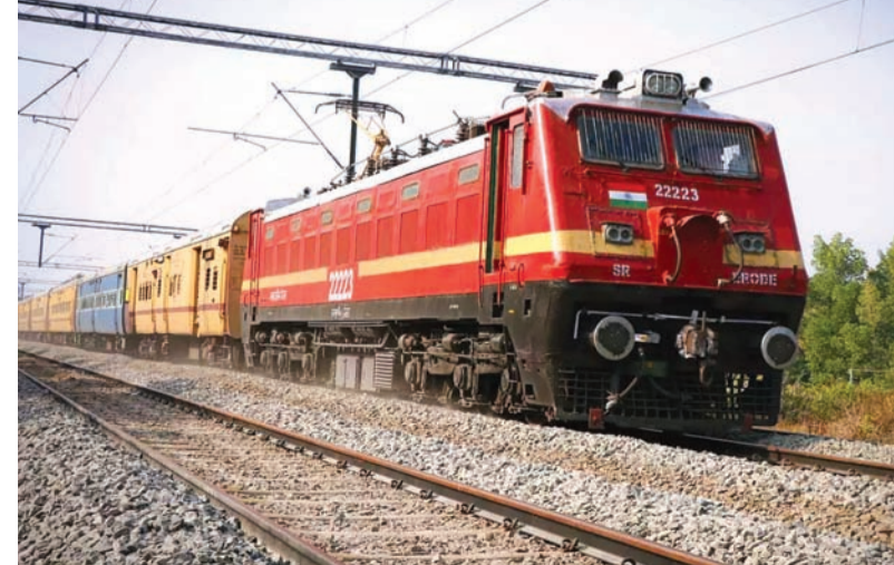
દિલ્હી સરાઈ રોહિલા-રાજકોટ એક્સપ્રેસ ૫ મિનિટ વહેલી આવી જશે. જ્યારે ૧૨૨૬૭ મુંબઈ સેન્ટ્રલ-હાપા દૂરન્ટો ૫ મિનિટ વહેલી, ૧૬૩૩૪

રાજકોટ, તા. ૨૮ પશ્ચિમ રેલવેના રાજકોટ ડિવિઝન દ્વારા મુસાફરો માટે એક મહત્વની યાદી જાહેર કરવામાં આવી છે. આગામી ૧ જાન્યુઆરી, ૨૦૨૬ થી રાજકોટ ડિવિઝન પરથી પસાર થતી અનેક ટ્રેનોના નવા ટાઈમ ટેબલનો અમલ શરૂ કરી દેવાશે. આવા ફેરફાર હેઠળ ઓખા, હાપા અને રાજકોટ આવતી-જતી ૧૦૦થી વધુ ટ્રેનોના આવન-જાવનના સમયમાં એક મિનિટથી લઈને સત્યાવીશમિનિટ સુધીનો ફેરફાર કરવામાં આવ્યો છે. ખાસ કરીને લાંબા અંતરની એક્સપ્રેસ ટ્રેનો હવે નિર્ધારિત સમય કરતાં વહેલી અથવા મોડી આવશે, જેથી મુસાફરોએ સ્ટેશનને પહોંચતા પહેલા સમયની ચોકસાઈ કરી લેવી અનિવાર્ય છે. રામેશ્વરમ-ઓખા ૧૬૭૩૩ નંબરની એક્સપ્રેસ ૨૦ મિનિટ વહેલી આવી જશે, ૨૦૮૧૯ પૂરી-ઓખા એક્સપ્રેસ તેના જૂના સમયના સ્થાને ૧૫ મિનિટ વહેલી આવશે, ૧૯૫૬૬ દેહરાદૂન-ઓખા ઉત્તરાંચલ એક્સપ્રેસ તેના જૂના નિર્ધારિત સમય કરતાં ૧૨ મિનિટ વહેલી આવશે, ૨૨૯૦૭ મડગાવ-હાપા એક્સપ્રેસ ૫ મિનિટ વહેલી આવશે, ૨૦૯૭૧