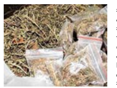
પોલીસની ટીમે બે અલગ અલગ ટીમો બનાવી તાત્કાલિક રાજકોટ-ગોંડલ હાઈવે પર કોરાટ ચોક ખાતે વોચ ગોઠવી હતી. દરમિયાન કોરાટ ચોક ખાતેથી જીજે-૦૩-સીટી-૪૪૬૮ અને તેની પાછળ જીજે-૦૩-સીટી-૨૫૯૨ નંબરની બે

રાજકોટ, તા. ૧૨ રાજકોટ-ગોંડલ હાઈવે પરથી કોરાટ ચોક નજીકથી અલગ અલગ બે રિક્ષામાં ગાંજાની હેરાફેરી કરતા દંપતિને ૧.૦૯ લાખના ૨ કિલો ગાંજા સાથે ઝડપી લીધા છે. શાપર(વે) પોલીસે હવે ગાંજાના સપ્લાયર અને રિસીવરને દબોચવા તપાસના ચક્રો ગતિમાન કર્યા છે. દરોડાની ગ્રામ વિગત અનુસાર શાપર પોલીસ મથકના પીઆઈ આર.બી.રાણા ટીમ સાથે પેટ્રોલિંગમાં હતાં ત્યારે પીએસઆઈ આર.ડી.સોલંકીને બાતમી મળી હતી કે, રાજકોટથી ગોંડલ નેશનલ હાઈવે ઉપર એક સ્ત્રી અને પુરુષ માદક પદાર્થના જથ્થા સાથે અલગ અલગ બે ઓટો રિક્ષામાં બેસી નીકળવાના છે. બાતમીના આધારે શાપર