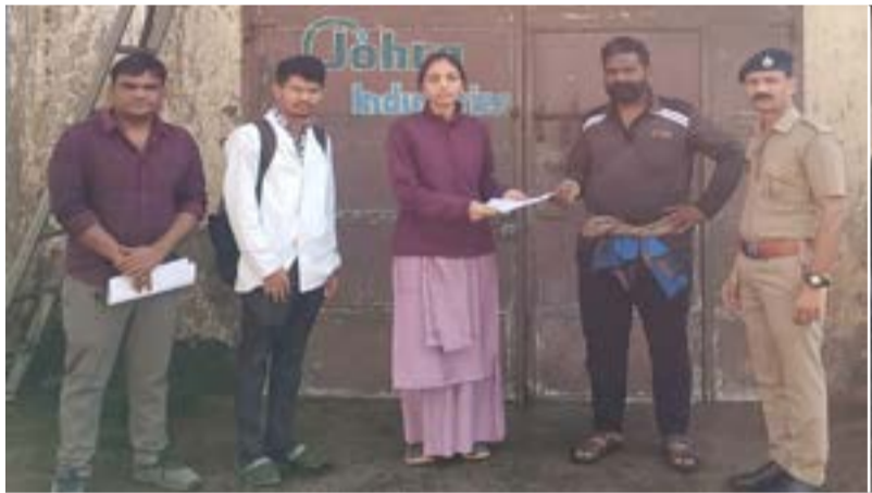
રાજકોટ, તા. ૧૨

ઉનાળામાં વેચાણિયા પાણીના જગ લેતા પહેલા અને બરફ ગોલા ખાતાં પહેલાં ચેતજો