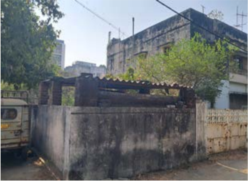
રાજકોટ, તા. ૧૨

રાજકોટના પોશ વિસ્તાર અમીન માર્ગ પર આવેલા ગુજરાત હાઉસિંગ બોર્ડના ૫૦ વર્ષ જુના ક્વાર્ટરના રહેવાસીઓ માટે “જયેં તો જયેં કહાં” જેવી સ્થિતિ: મુખ્યમંત્રીને રજૂઆત: સરકાર નવી પોલિસી લાવશે?