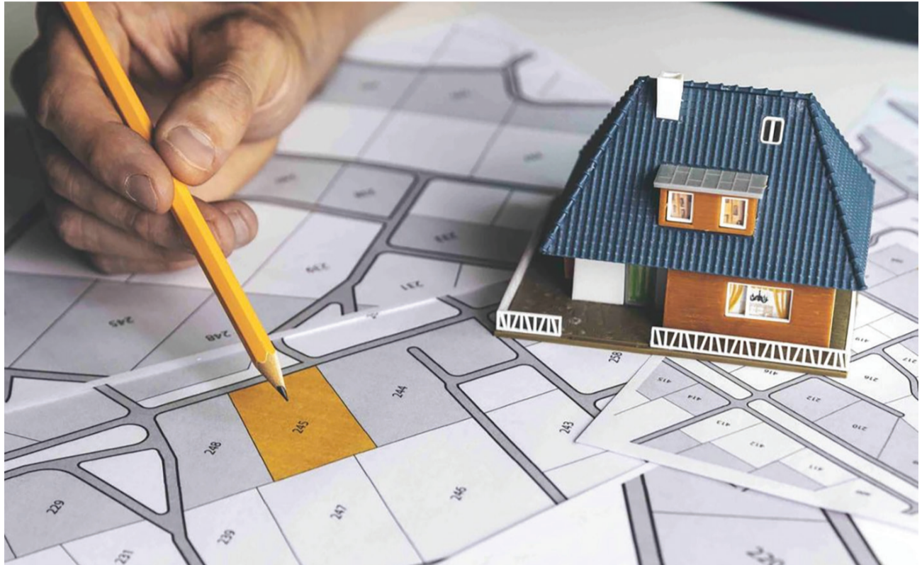
ત્યારે રૂડા વિસ્તારમાં આવતી ગ્રામપંચાયતો અને તાજેતરમાં મહાનગરપાલિકાની હદમાં ભળેલા માધાપર, મુજકા, મોટામવા, ઘંટેશ્વર અને મનહરપુર-૧ સહિતના વિસ્તારોમાં બાકી રહી ગયેલી ટીપી સ્કીમો માટે અત્યારથી તૈયારીઓ શરૂ કરવામાં આવી છે. મહાનગરપાલિકાની હદમાં ભળેલા ગામોની બાકી રહેલી ટીપી સ્કીમો માટે માપણી, સર્વે અને ડીમાર્કેશન સહિતની કામગીરી ટૂંક સમયમાં શરૂ કરવામાં આવનાર છે. ત્યારે રૂડા વિસ્તારમાં આવતા અને નજીકના ભવિષ્યમાં રાજકોટ મહાનગરપાલિકાની

તૈયાર કરવાની સુચના આપવામાં આવી છે. છેલ્લા બે વર્ષ દરમિયાન દુધી વધુ ટીપી સ્કીમનો ડ્રાફ્ટ તૈયાર કરી સરકારમાં મંજૂરી અર્થે મોકલવામાં આવ્યો છે. મહાનગરપાલિકાએ કુલ અલગ અલગ વિસ્તારોની ૫૯ ટીપી સ્કીમનો ઇરાદો જાહેર કર્યો છે. જે પૈકી ૪૦ ટીપી સ્કીમ પ્રારંભિક રીતે મંજૂર કરાઈ છે. ૧૯ ટીપી સ્કીમનો ડ્રાફ્ટ મંજૂર થઈ ગયો છે. મહાનગરપાલિકાની હદમાં જે નવા વિસ્તારો ભર્યા છે અને તેમાં ગ્રામ પંચાયતોમાં વિકાસના કામોની જે ઝડપ જોવા મળી રહી છે તેનાથી ટીપી સ્કીમનું કામ પૂરપાટ આગળ વધશે અને આ માટે સરકારે નવ ટીપી સ્કીમો હાલ તાકીદે મંજૂર કરી હોવાનું પણ માલુમ પડ્યું છે. ડીજીપીએસ મશીનથી માપણી કરી નગરરચના યોજનાઓ માટે બેઝમેપ બનાવવાની અને રેકોર્ડ તૈયાર કરવાની તથા માપણી રેકોર્ડ પ્રમાણિત કરવા અંગેની કામગીરી અને સર્વે તેમજ ડીમાર્કેશન સંબંધીત કામગીરી માટે એજન્સીને ૬ વર્ષના સમયગાળા માટે કામ સોંપવામાં આવશે. જેના માટે ટેન્ડર પ્રક્રિયા હાથ ધરવામાં આવી હોવાનું જાણવા મળેલ છે. મહાનગરપાલિકાની હદમાં ભડેલા વાવડી, કોટારીયા અને મવડીની મોટાભાગની ટીપી સ્કીમનો ડ્રાફ્ટ તૈયાર થઈ ગયો છે. તેમજ અનેક ટીપી સ્કીમનો મંજૂરી મળ્યા બાદ રોડ રસ્તા તેમજ અનામત પ્લોટના કબજા લેવાઈ ગયા છે.