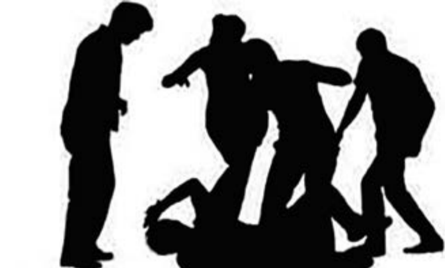
કુટુંબી ભાઈનું સમાધાન કરવા ગયેલા યુવાને ટોળકીએ બાંધીને ઘુસ્તાવ્યો: આઈફોન-પર્સ પણ પડાવી લેવાયાના આક્ષેપને પગલે તપાસ