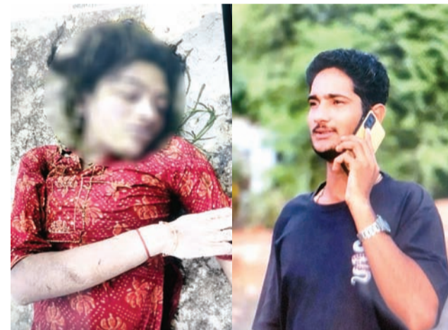
આપઘાતની હોવાની પોલીસને શંકા હતી. જો કે યુવાનના પરિવારજનોએ ઓનરકિલિંગ, હત્યાની શંકા દર્શાવી હતી. યુવાનના પરિવારજનોએ પોતાના દિકરાની હત્યા થયાની શંકા દર્શાવતા મૃતદેહને કોરેન્સિક પોસ્ટમોર્ટમ માટે રાજકોટ ખસેડાયો હતો. બહાર આવેલી વિગતો અનુસાર આ યુવાને અગાઉ પણ એક હિન્દુ યુવતિ સાથે મૈત્રીકરાર કર્યા હતાં, અને હાલ એ યુવતિ તેની અને ત્યારબાદ કાયર બ્રિગેડનો સંપર્ક કરી અને બંને મૃતદેહને