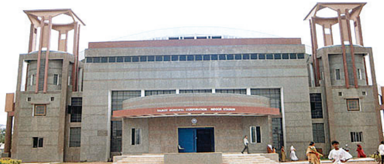
મહાનગરપાલિકા માટે જે સંચાલન કરવામાં આવવું જોઈએ અને જે પારદર્શકતા હોવી જોઈએ તે જોવા મળતી નથી. ત્યારે પ્રવર્તમાન મ્યુનિસિપલ કમિશનર રમતગમત ક્ષેત્રના વિકાસની વાતો કરી રહ્યા છે તો ખરા અર્થમાં ખેલાડીઓને પૂરતો લાભ આપવામાં આવે છે કે કેમ તે અંગે પણ યોગ્ય તપાસ કરવામાં આવે તેવું જાણકાર વર્તુળો ચર્ચા કરી રહ્યા છે. રેસકોર્સમાં અનેકવિધ સ્પોર્ટ્સ માટેના ગ્રાઉન્ડ્સ જોવા મળે છે જેમાં ફૂટબોલ, લોન ટેનિસ, સેક્રેટિંગ રિંગ, એથલેટિક ગ્રાઉન્ડ્સને બાજુમાં આવેલું વધુ એક ફૂટબોલ ગ્રાઉન્ડ અને માધવરાવ સિંધિયા ક્રિકેટ

રાજકોટ તા. ૧૦ એક તરફ મહાનગરપાલિકા સ્પોર્ટ્સને વિકસિત કરવા માટેના તમામ જરૂરી પગલાઓ લઈ રહી છે પરંતુ બીજી તરફ સ્પોર્ટ્સ ક્ષેત્રનું સંચાલન યથા યોગ્ય થાય છે કે કેમ તે અંગે આજે પણ ઘણા પ્રશ્નો ઊભા થઈ રહ્યા છે. મળતી માહિતી મુજબ જે તે વખતે ૨૦૧૭માં મહાનગરપાલિકા દ્વારા ખાસ ખાનગી કંપનીનું નિર્માણ કરવામાં આવ્યું હતું જેમાં સ્પોર્ટ પ્રમોશન ફાઉન્ડેશન નામ પણ આપવામાં આવ્યું. જેનો હેતુ ખૂબ જ સ્પષ્ટ હતો કે રાજકોટના જે ખેલાડીઓ છે તે આગળ આવે અને તેઓને યોગ્ય સ્થાન મળે પરંતુ જે કંપનીનું નિર્માણ થયું તેના દ્વારા જે કામગીરી થવી જોઈએ તે થઈ શકી નથી. ત્યારે આ અંગે સ્પોર્ટ્સ ક્ષેત્રે સંકળાયેલા લોકોનું માનવું છે કે ખરા અર્થમાં આ અંગે યોગ્ય તપાસ થવી જોઈએ કે ખરા અર્થમાં ઊભી કરવામાં આવેલી જે પેઢી છે તે કંપની છે તે કયા સ્તર પર કાર્ય કરે છે અને છેલ્લા કેટલાક સમયથી ખેલાડીઓને પ્રોત્સાહન આપવામાં આવી રહ્યું છે.