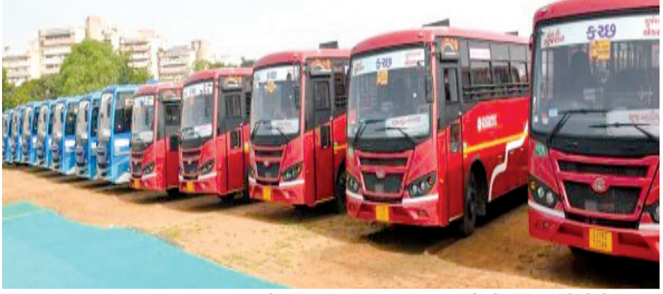
૧૯૫ જેટલી વધુ બસમાં ૭૮૦૦થી વધુ ટ્રીપો દ્વારા ૩.૭૦ લાખ જેટલા મુસાફરોને સુવિધા આપવાનું લક્ષ્ય રાખવામાં આવ્યું છે. મહાશિવરાત્રી મેળાને 'મિનિ કુંબ મેળા' તરીકે પણ ઓળખવામાં આવે છે. આ વર્ષનો મેળો અત્યાર સુધીનો સૌથી ભવ્ય અને ઐતિહાસિક બનવાનો છે ત્યારે લાખોની સંખ્યામાં શ્રદ્ધાળુઓ ભવનાથના દર્શનાર્થે આવશે. શ્રદ્ધાળુઓના ધસારાને પહોંચી વળવા માટે કુલ

રાજકોટ, તા. ૧૦ છેલ્લા ઘણા સમયથી એસ.ટી. વિભાગ દ્વારા મહાશિવરાત્રી મેળા ને ધ્યાને લઈ વધુ બસ દોડાવવાનો નિર્ણય લીધો છે. કારણ કે ખૂબ મોટી સંખ્યામાં શિવ ભક્તો શિવરાત્રીના મેળામાં આવી પહોંચશે ત્યારે તેઓને કોઈપણ પ્રકારની હેરાનગતિ નો સામનો ન કરવો પડે અને મહાશિવરાત્રીના પાવન પ્રસંગે તેઓ મીની કુંબ ગણાતા જુનાગઢમાં શિવભક્તિ કરી શકે તે હેતુસર એસ.ટી. નિગમ દ્વારા તમામ જરૂરી પગલાંઓ લેવામાં આવ્યા છે અને વધુ બસ દોડાવવાનો નિર્ણય પણ લેવામાં આવ્યો છે. આજ થી આગામી પાંચ દિવસ દરમિયાન જૂનાગઢ ખાતે મહાશિવરાત્રી મેળા યોજાવાનો છે. આ મેળામાં આવતા લાખો શ્રદ્ધાળુઓની સુવિધા માટે એસ.ટી. નિગમ દ્વારા વિશેષ પરિવહન વ્યવસ્થા ગોઠવવામાં આવી છે. ગત વર્ષે ૨.૯૧ લાખ મુસાફરોએ સેવાનો લાભ લીધો હતો, જેને ધ્યાને રાખી આ વર્ષે ક્ષમતામાં વધારો કરવામાં આવ્યો છે. જેમાં આ વર્ષે અંદાજે