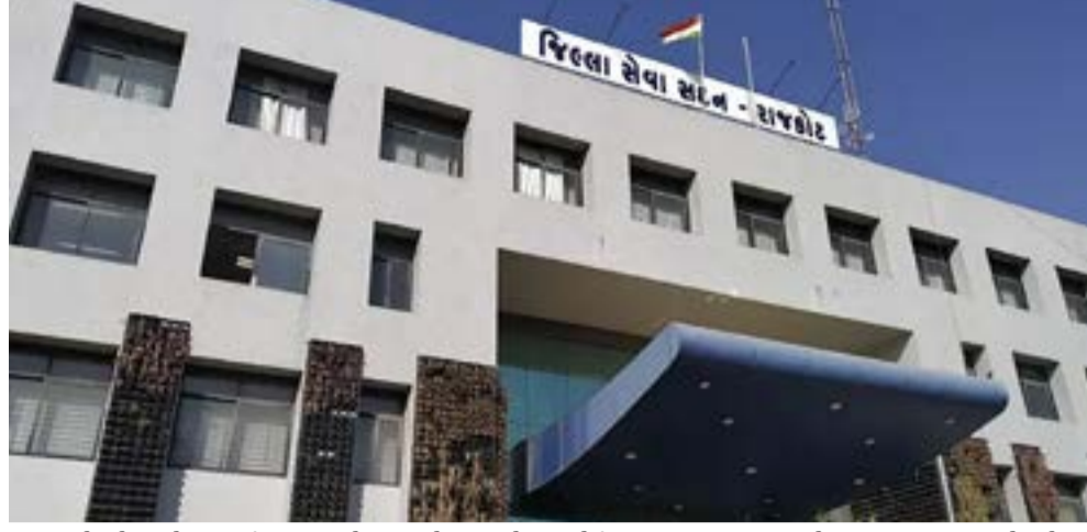
થઈ રહ્યો છે અને આર્થિક તકલીફો પણ વેકવી પડે ઓર્ડર વિલંબીત થતા ટ્રાન્ઝેક્શન અટકી જાય છે. જેના કારણે નાગરિકોમાં અસંતોષ અને ગેરસમજ ઉભી થાય છે. કેટલાક કેસોમાં હોમ લોન મંજૂર થયેલ હોવા છતાં

કરવામાં આવ્યું તેમાં રેવન્યુ સર્વે નંબર તથા સીટી સર્વે નંબરનો ઉલ્લેખ થયો નથી જેને લઈને ઘણા અન્ય પ્રશ્નો પણ ઊભા થઈ રહ્યા છે. હાલ મળતી માહિતી મુજબ ૧૫૦ થી ૨૦૦ જેટલી અરજીઓના ઓર્ડર હજુ કરવામાં આવ્યા નથી. આ અંગે પ્રાંત કચેરીમાં પણ રજૂઆત કરવામાં આવી છે અને સરકાર તરફથી જે સર્વે નંબર રહી ગયા છે તે અંગે યોગ્ય માર્ગદર્શન મેળવી ઓર્ડર કરવામાં આવે તેવી પણ રજૂઆત હાલ કલેક્ટર સમક્ષ કરાય છે. હાલ કલેક્ટર તંત્ર તરફથી જે નોટિફિકેશન પ્રસિદ્ધ કરવામાં આવ્યું તે અંગેની હજુ કોઈ સ્પષ્ટતા કરવામાં આવી નથી અને પરિણામ સ્વરૂપે જૂની અનેકવિધ અરજીઓ આજે પણ પેન્ડિંગ હોવાનું રેવન્યુ બહારના વકીલોએ જણાવ્યું હતું. બીજી મહત્વની વાત એ છે કે અશાંત ધારાના ઓર્ડર વગર દસ્તાવેજ નોંધણી નથી થતી ત્યારે ઘણા પક્ષકારો અન્ય જગ્યા પર રહેતા હોવાથી હાલ તેઓને ખૂબ મોટો ખર્ચ અને સમય પણ વ્યર્થ