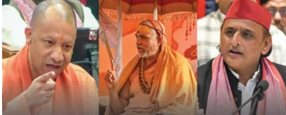
કાનપુર, તા. ૧૩ યોગી આદિત્યનાથે શંકરાચાર્ય ચોક્કાવનારનું નિવેદન આપ્યું છે. ઉત્તર પ્રદેશના મુખ્યમંત્રી અવિમુક્તેશ્વરાનંદ વિવાદ મામલે તેમણે કહ્યું કે, દર વ્યક્તિ શંકરાચાર્ય

વિધાનસભામાં યોગી આદિત્યનાથનું મોટું નિવેદન: નૈતિકતાની વાતો કરનારાઓએ પહેલા પોતાના આચરણ પર ધ્યાન આપે