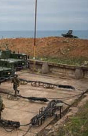
સંરક્ષણ મંત્રાલયે હવાઈ ક્ષેત્રને મજબૂત બનાવવા આપી મંજૂરી

નવીદિલ્હી, તા. ૧૩ ભારત તેની સરહદો પર સતત વધી રહેલા પડકારોનો સામનો કરવા માટે તેની લશ્કરી ક્ષમતાઓ વધારવામાં વ્યસ્ત છે. કેન્દ્ર સરકારે તેના હવાઈ સંરક્ષણને વધુ મજબૂત બનાવવા તરફ એક મોટું પગલું ભર્યું છે, અને સંરક્ષણ