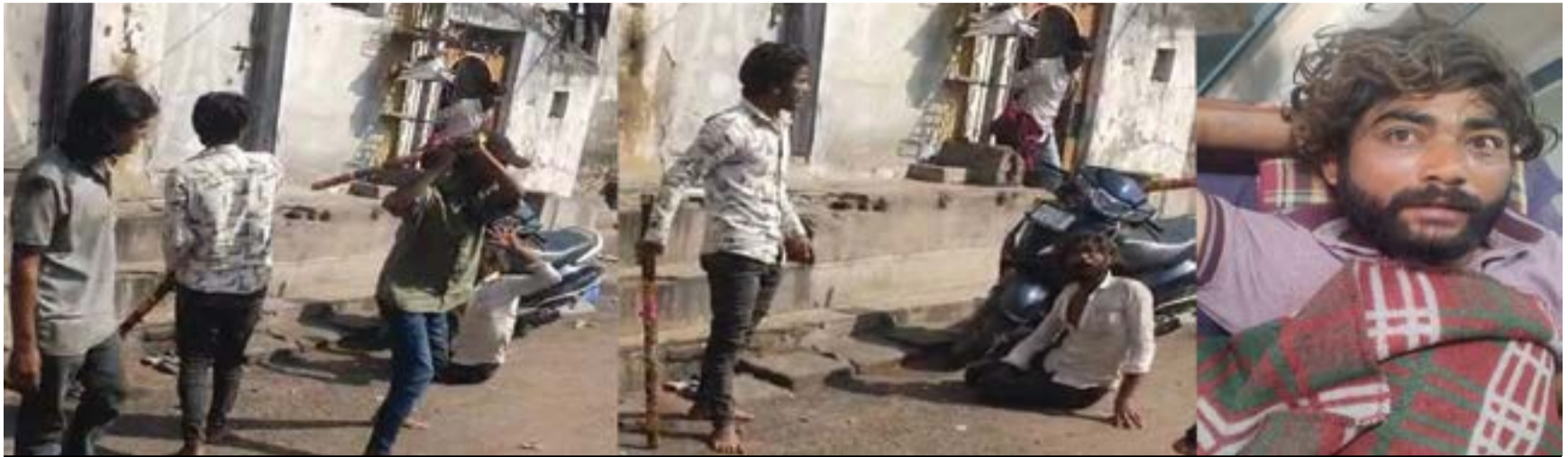
અન્ય બનાવમાં પતિને પત્નિએ ધોક્કાવ્યો, પ્લોટ મામલે યુવાનને પાઈપના ઘા