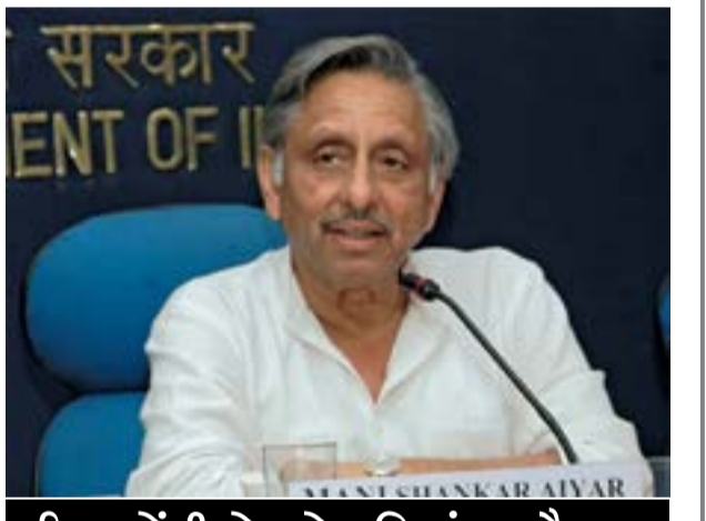
વરિષ્ઠ કોંગ્રી નેતાને મણિશંકર ઐયરના નિવેદનથી રાજકીય ખળભળાટ

નવીદિલ્હી, તા. ૧૬ કોંગ્રેસના વરિષ્ઠ નેતા અને ભૂતપૂર્વ કેન્દ્રીય મંત્રી મણિશંકર ઐયરે ફરી એકવાર પોતાના સ્પષ્ટવક્તા અને વિવાદાસ્પદ નિવેદનોથી રાષ્ટ્રીય રાજકારણમાં બળભાગટ મચાવ્યો છે.