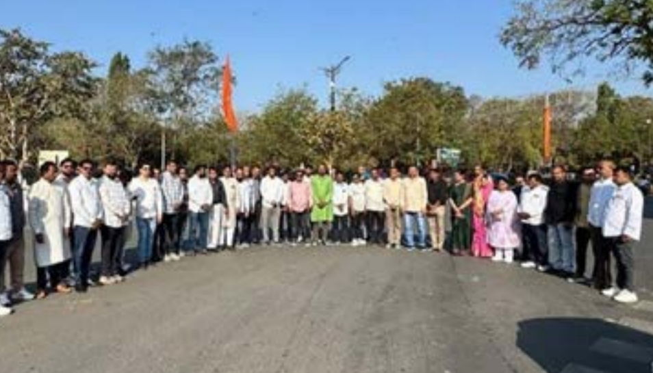
ભાજપની નીતિ અને લોકોને વેઠવી પડતી પરેશાનીઓ અંગે વિરોધ