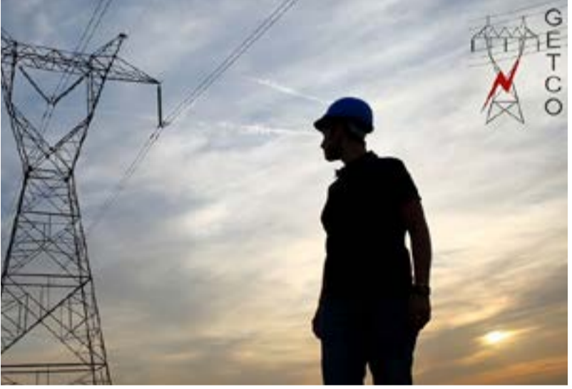
પોરબંદર, વલસાડ, રાજકોટ અને સાબરકાંઠા જિલ્લામાં જમીનની ફાળવણી કરવામાં આવી છે. આ જમીન ફાળવણીથી રાજ્યમાં પીવાના પાણીની સુવિધા તેમજ વીજ પુરવઠાની ક્ષમતા વધશે. તદુપરાંત, રિન્યુએબલ એનર્જી સેક્ટરે પણ ગુજરાત નવી ઊંચાઈઓ સર કરશે. આ નિર્ણય રાજ્યના પાયાના માળખાને વધુ મજબૂત બનાવવાની સરકારની પ્રતિબદ્ધતા દર્શાવે છે, તેમ પ્રવક્તા મંત્રીએ ઉમેર્યું હતું.

જિલ્લાઓમાં જે તે સંસ્થાઓને ફાળવવામાં આવેલી આ જમીનો પર આગામી સમયમાં મહત્વપૂર્ણ પ્રોજેક્ટ્સ કાર્યરત થશે, જેનો સીધો લાભ સ્થાનિક જનતાને મળશે. સૌથી વધુ ગુજરાત પાવર કોર્પોરેશનને બનાસકાંઠાના રાધાનેસડા ખાતે અંદાજે ૧,૨૦,૬૦,૦૦૦ ચો.મી. જેટલી વિશાળ જમીન ફાળવવામાં આવી છે. આ ઉપરાંત ગુજરાત પાણી પુરવઠા બોર્ડને વિવિધ ૧૪ સ્થળોએ આશરે ૧,૩૬,૨૯૧ ચો.મી. જમીન ફાળવવામાં આવી છે. જ્યારે, જેટકો (JETCO)ને રાજ્યમાં વીજ માળખું મજબૂત કરવા માટે કુલ ૭ સ્થળોએ અંદાજે ૩૧,૦૧૦ ચો.મી. જમીન ફાળવવામાં આવી છે. આ ઉપરાંત, ગુજરાત મેરીટાઇમ બોર્ડને પણ મહુવાના કતપર ખાતે બંદર વિકાસ માટે ૨૫,૭૯૫ ચો.મી. જમીનની ફાળવણી કરવામાં આવી છે, તેમ મંત્રીશ્રીએ ઉમેર્યું હતું. પાણી પુરવઠા બોર્ડને તાપી, મોરબી, ગીર સોમનાથ, છોટા ઉદેપુર, કચ્છ, વલસાડ, અમદાવાદ, રાજકોટ અને બોટાદમાં જ્યારે, જેટકોને ગીર સોમનાથ, છોટા ઉદેપુર,