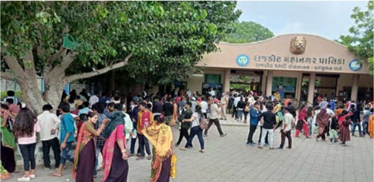
ચૂંટણી આચારસંહિતા દરમિયાન લાયન સફારી પાર્ક ખુલ્લું મુકવામાં અવરોધ ન આવે તે માટે આગોતરું આયોજન

પ્રધુમન પાર્ક ઝૂની એન્ટ્રી ફીમાં પણ ૫૦ થી ૭૫ ટકા તોલિંગ વધારો સુચવતા કમિશનર: પેડક રોડને અમદાવાદનાં સીજી રોડની જેમ ગૌરવપથ બનાવવા સહિતના મુદ્દે કાલે મળનારી સ્ટેન્ડિંગ કમિટીની બેઠકમાં નિર્ણય થશે