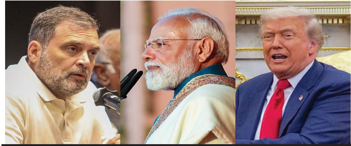
ટ્રમ્પે ફરી એકવાર વિશ્વભરના દેશો પર ૧૦ ટકા ટેરિક્સ લાદવાની કરી જાહેરાત

નવીદિલ્હી, તા. ૨૧ અમેરિકાના રાષ્ટ્રપતિ ડોનાલ્ડ ટ્રમ્પના ટેરિક્સ પર હોબાળો ચાલી રહ્યો છે. આ હોબાળો ઓછો થવાના કોઈ સંકેત દેખાતા