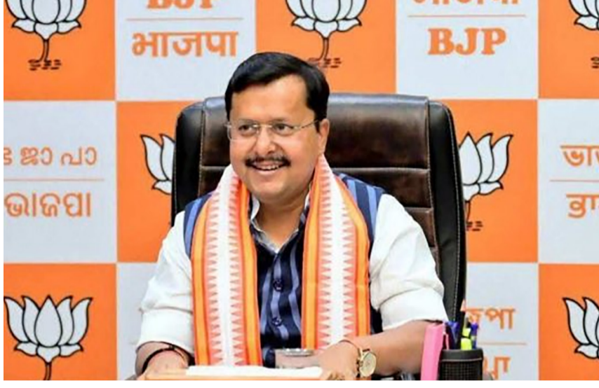
ઇનોવેશન અને સ્ટાર્ટઅપના માધ્યમથી ગુજરાતના યુવાનો માત્ર રાજ્ય જ નહીં પરંતુ સમગ્ર દેશના યુવાનોને નેતૃત્વ પૂરું પાડી રહ્યા હોવાનું જણાવતા નીતિન નવીનજી

ગિફ્ટ સિટી ખાતે યંગ વોઇસ સમિટમાં ઉપસ્થિત રહી એન્ટરપ્રિન્યોર્સ-સ્ટાર્ટઅપ ફાઉન્ડર્સ સાથે સાધ્યો સંવાદ