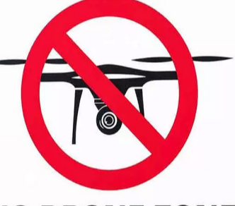
NO DRONE ZONE