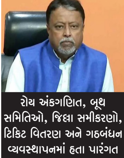
રોય અંકગણિત, બૂથ સમિતિઓ, જિલ્લા સમીકરણો, ટિકિટ વિતરણ અને ગઠબંધન વ્યવસ્થાપનમાં હતા પારંગત

કોલકાતા, તા. ૨૩ એક સમયે 'પશ્ચિમ બંગાળના રાજકારણના ચાણક્ય' તરીકે ઓળખાતા બેકટમ વ્યૂહરચનાકાર મુકુલ રોયનું લાંબી માંદગી બાદ સોમવારે વહેલી સવારે અવસાન થયું છે, અને તેમની કારકિર્દીનો અંત આવ્યો છે. ટીએમસીના સ્થાપક સભ્યો પૈકી એક, તેમના અવસાનથી ડાબેરી પછીના પશ્ચિમ બંગાળની સૌથી સ્તરીય રાજકીય સફરનો અંત આવ્યો છે. ૧૯૫૪માં ઉત્તર ૨૪ પરગણા જિલ્લાના કંચરાપાડામાં જન્મેલા રોયે ૧૯૮૦ના દાયકામાં યુવા કોંગ્રેસ સાથે પોતાની રાજકીય કારકિર્દી શરૂ કરી હતી. ૧૯૯૮માં જ્યારે મમતા બેનર્જીએ કોંગ્રેસથી અલગ થઈને તુણમુલ કોંગ્રેસની રચના કરી, ત્યારે રોય તેમના પછી આવનારા શરૂઆતના નેતાઓમાંના એક હતા. તેઓ મુદુભાષી અને સંગઠનના નેતા હતા અને તેમનું કાર્યક્ષેત્ર અંકગણિત, બૂથ સમિતિઓ, જિલ્લા સમીકરણો, ટિકિટ વિતરણ અને જોડાણ વ્યવસ્થાપન હતું.