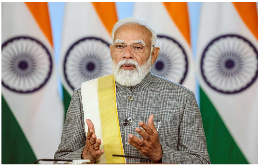
કરી રહેલા શરણાર્થીઓને ઈઅઅ દ્વારા નાગરિકતા મળશે અને ગેરકાયદેસર ઘૂસણખોરીથી મુક્ત શાસન સ્થાપિત કરવામાં આવશે. નેતાજી સુભાષચંદ્ર બોઝ અને રવિન્દ્રનાથ ટાગોરનો ઉલ્લેખ કરતા તેમણે કહ્યું કે રાજ્ય ગેરકાયદેસર ઘૂસણખોરી, મહિલાઓ વિરુદ્ધના ગુનાઓ અને નકલી મતદારોનો સામનો કરે છે, અને

વિવેકાનંદ અને અરવિંદ જેવા મહાન વ્યક્તિઓ દ્વારા કલ્પના કરવામાં આવ્યું હતું તે હવે સંકુચિત મત-બેંક રાજકારણ, હિંસા અને અરાજકતામાં ડૂબી રહ્યું છે. આ પત્રમાં, મોદીએ લખ્યું કે પશ્ચિમ બંગાળનું ભાવિ નક્કી થવામાં હવે થોડા મહિના બાકી છે અને ભારપૂર્વક જણાવ્યું કે રાજ્ય કઈ દિશામાં આગળ વધશે તે મતદારો દ્વારા નક્કી કરવામાં આવશે. તેમણે તેમની સરકારના ૧૧ વર્ષના રેકોર્ડ પર જણાવ્યું હતું કે ખેડૂતોના કલ્યાણ અને યુવાનોની આકાંક્ષાઓથી લઈને મહિલા સશક્તિકરણ સુધી, જન કલ્યાણ અને સમાવેશી વિકાસને પ્રાથમિકતા આપવામાં આવી છે. તેમણે પોતાની અપીલમાં મતદારોને વિકાસની યાત્રામાં જોડાવા વિનંતી કરી અને કહ્યું કે તેઓ તેમની સેવા કરવાની તક માટે ઉત્સુક છે. તેમણે ભ્રષ્ટાચાર અને કુશાસનથી મુક્ત રાજ્યનું વચન આપ્યું, જ્યાં મહિલાઓ સુરક્ષિત અને અનુભવે અને યુવાનોને કામ માટે સ્થળાંતર ન કરવું પડે. તેમણે એમ પણ કહ્યું કે ધાર્મિક અત્યાચારનો સામનો