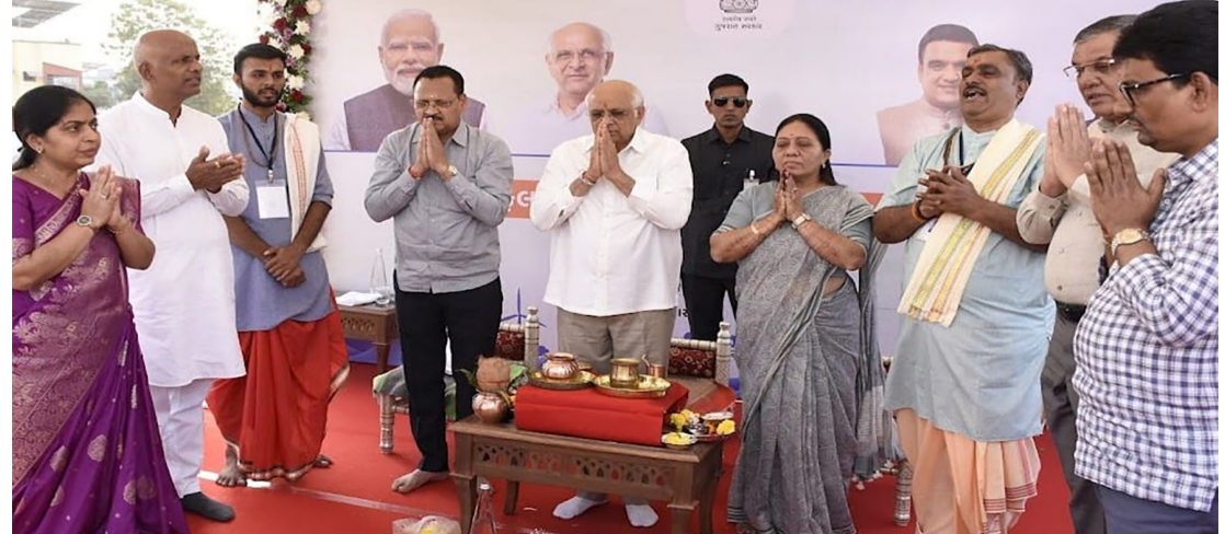
વધુ સુદૃઢ કરીને ભૂગર્ભ જળ સ્તર ઊંચા લાવવાના અને વરસાદી પાણીના સંગ્રહના કામો હાથ ધરવામાં આવશે. આ હેતુસર, પુરવઠા, સરદાર સરોવર નર્મદા નિગમ, રાજ્ય સરકારના જળ સંપત્તિ, પાણી ગ્રામ વિકાસ, વન પંચવરણ, શહેરી વિકાસ

ગાંધીનગર, તા.૨૩ ૨૩ ફેબ્રુઆરી થી ૩૧ મે સુધી સમગ્ર રાજ્યમાં જળ સંચયનું મહાઅભિયાન યોજાશે : સુજલામ સુકલામ જળ અભિયાન-જળ સંચય જનભાગીદારી ૨.૬નો રાજ્યવ્યાપી પ્રારંભ કરાવતાં મુખ્યમંત્રી ભૂપેન્દ્ર પટેલે જળ સંચય અને જળ સંગ્રહ માટે વડાપ્રધાન નરેન્દ્રભાઈ મોદીએ કરેલા કેચ ધ રેઈન આહવાનને સાકાર કરવા ગુજરાતમાં સુજલામ સુકલામ જળ અભિયાન-જળ સંચય જનભાગીદારી ૨.૬નો રાજ્યવ્યાપી પ્રારંભ કરાવ્યો છે. જળ સંચય અને જળ સંગ્રહ માટેનું આ મહાઅભિયાન તા. ૩૧ મે ૨૦૨૬ સુધી યોજાશે. આ અભિયાન અંતર્ગત તાલુકા દીઠ ૧૦ તળાવો ઊંડા કરવા સહિત પાણીના સંગ્રહ માટેની વ્યવસ્થાઓ