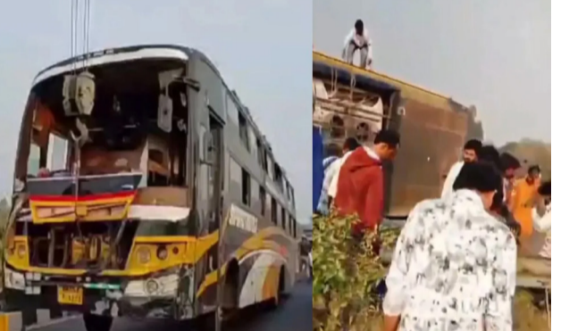
મળ્યું છે કે અકસ્માત પહેલા બસ ધ્રુજવા લાગી. મુખ્યમંત્રી યોગી આદિત્યનાથે લખનૌમાં થયેલા અકસ્માતની નોંધ લીધી છે. તેમણે મૂતકોના શોકસ્ત પરિવારો પ્રત્યે સંવેદના વ્યક્ત કરી છે. તેમણે અધિકારીઓને તાત્કાલિક ઘટનાસ્થળે પહોંચવા અને રાહત કામગીરી ઝડપી બનાવવાનો પણ નિર્દેશ આપ્યો છે. તેમણે

રાજકોટ, તા. ૨૩ સોમવારે સાંજે ઉત્તર પ્રદેશની રાજધાની લખનૌમાં પૂર્વાચલ એક્સપ્રેસ વે પર એક મોટો બસ અકસ્માત થયો. જેમાં સાત મુસાફરોના મોત થયા અને ૪૦ થી વધુ ઘાયલ થયા. ઘાયલ મુસાફરોને SGPGI સ્થિત એપેક્સ ટ્રોમા સેન્ટરમાં લઈ જવામાં આવ્યા. મુસાફરોનો આરોપ છે કે અકસ્માત પહેલા ડ્રાઈવર નશામાં હતો. દરમિયાન, મુખ્યમંત્રી યોગી આદિત્યનાથે અકસ્માતની નોંધ લીધી છે અને અધિકારીઓને પૂરતું વળતર આપવાનો નિર્દેશ આપ્યો છે. સોમવારે, એક ડબલ ડેકર બસ પંજાબના લુધિયાણાથી બિહારના મોતીહારી જઈ રહી હતી. લગભગ ૪:૩૦ વાગ્યે, લખનૌના પૂર્વાચલ એક્સપ્રેસ વે પર એક મોટો બસ અકસ્માત થયો. એવું જાણવા