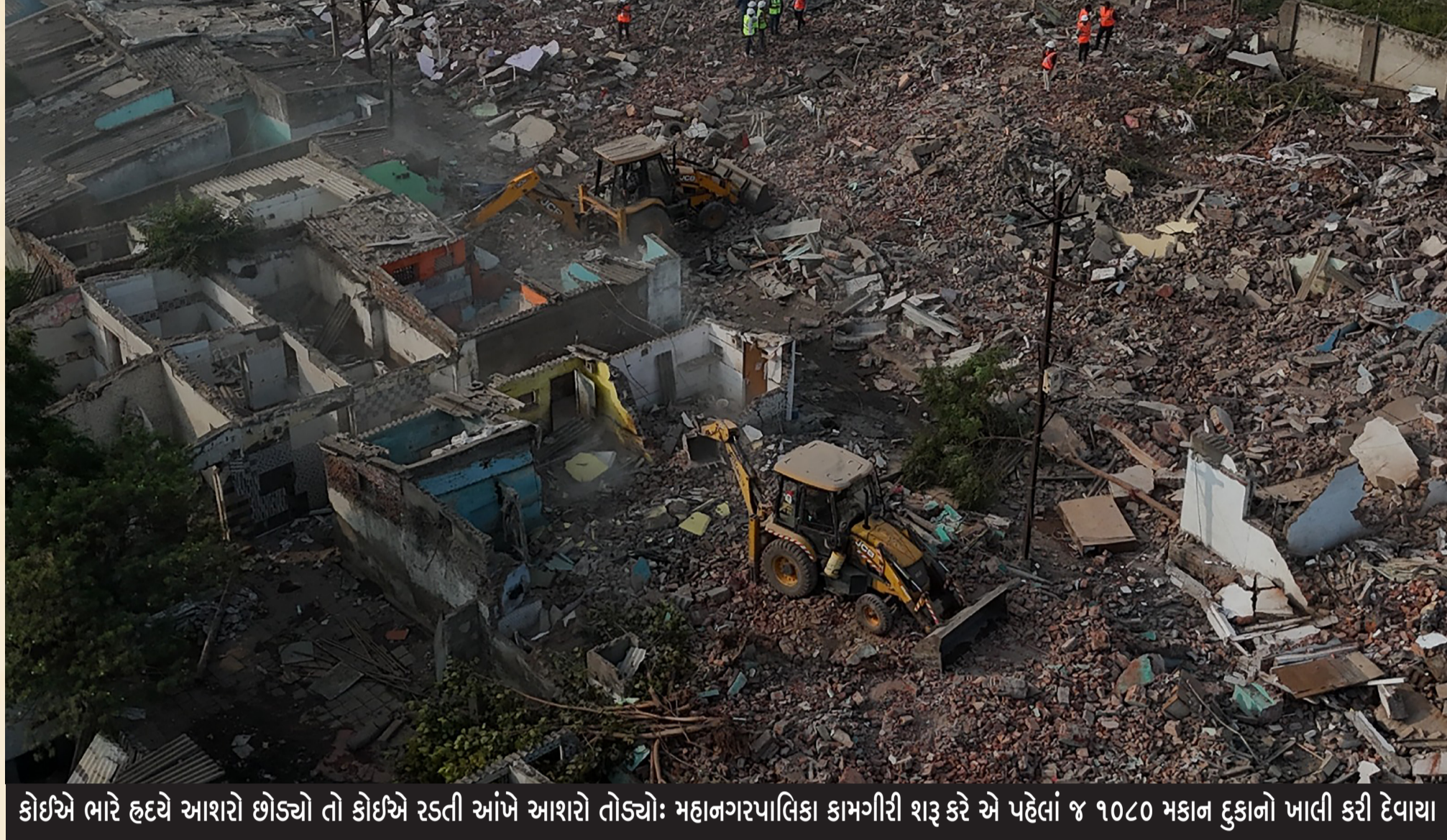
કોઈએ ભારે હદયે આશરો છોડ્યો તો કોઈએ રડતી આંખે આશરો તોડ્યો: મહાનગરપાલિકા કામગીરી શરૂ કરે એ પહેલાં જ ૧૦૮૦ મકાન દુકાનો ખાલી કરી દેવાયા

મહાનગરપાલિકા દ્વારા અગાઉ કરાયેલી જાહેરાત મુજબ વહેલી સવારથી તંત્રની ફોજ ઉતરી