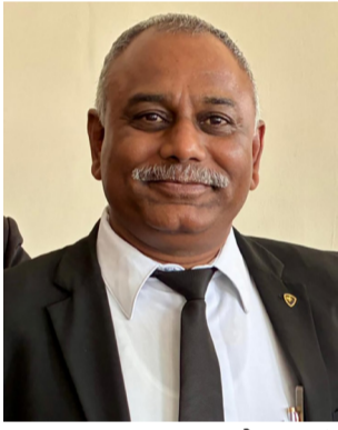
તમામ વસુલાયા વગર બેન્કમાંથી પાછા ફરતા પૈસા ચુકવવા નોટીસ અપાઈ હતી. છતાં પૈસા પરત વાળવા બેદરકારી દાખવાતા અંતે કોર્ટમાં કેસ દાખલ કરાયા હતા.

ચેક રીટર્ન કેસોમાં રકમ પરત કરવાના ચુકાદાઓના કિસ્સાઓ ભાવ્યેજા બનતા હોય છે તેવી ઘટના રાજકોટની અદાલતમાં પાંચ-પાંચ લાખના પાંચ ચેકો રીટર્ન કેસોમાં બે વર્ષની સજા ઉપરાંત ચેકની રકમ ફરીયાદીને એક માસમાં ચુકવવી અને તેમાં કસુર ક્યે વધુ છ માસની સજા ફરમાવતો સીમાચીનહરુપ ચુકાદો રાજકોટના એડી.ચીફ જયુડો. મેજ.એ હુકમ કર્યો છે.