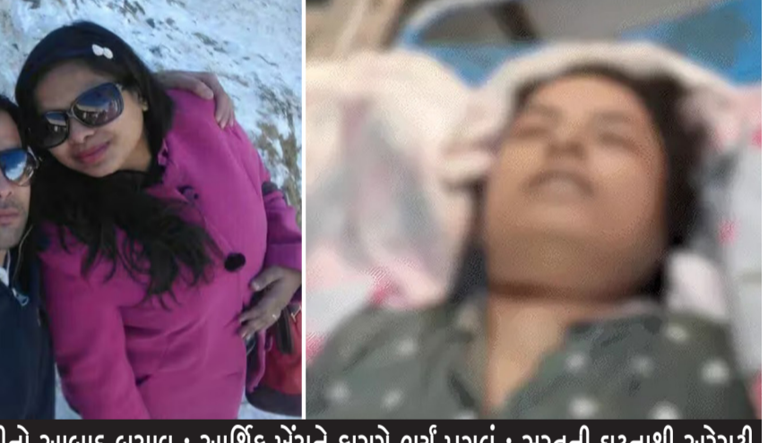
એક દીકરીનો આબાદ બચાવ : આર્થિક ખેંચને કારણે ભર્યું પગલું : સુરતની ઘટનાથી અરેરાટી