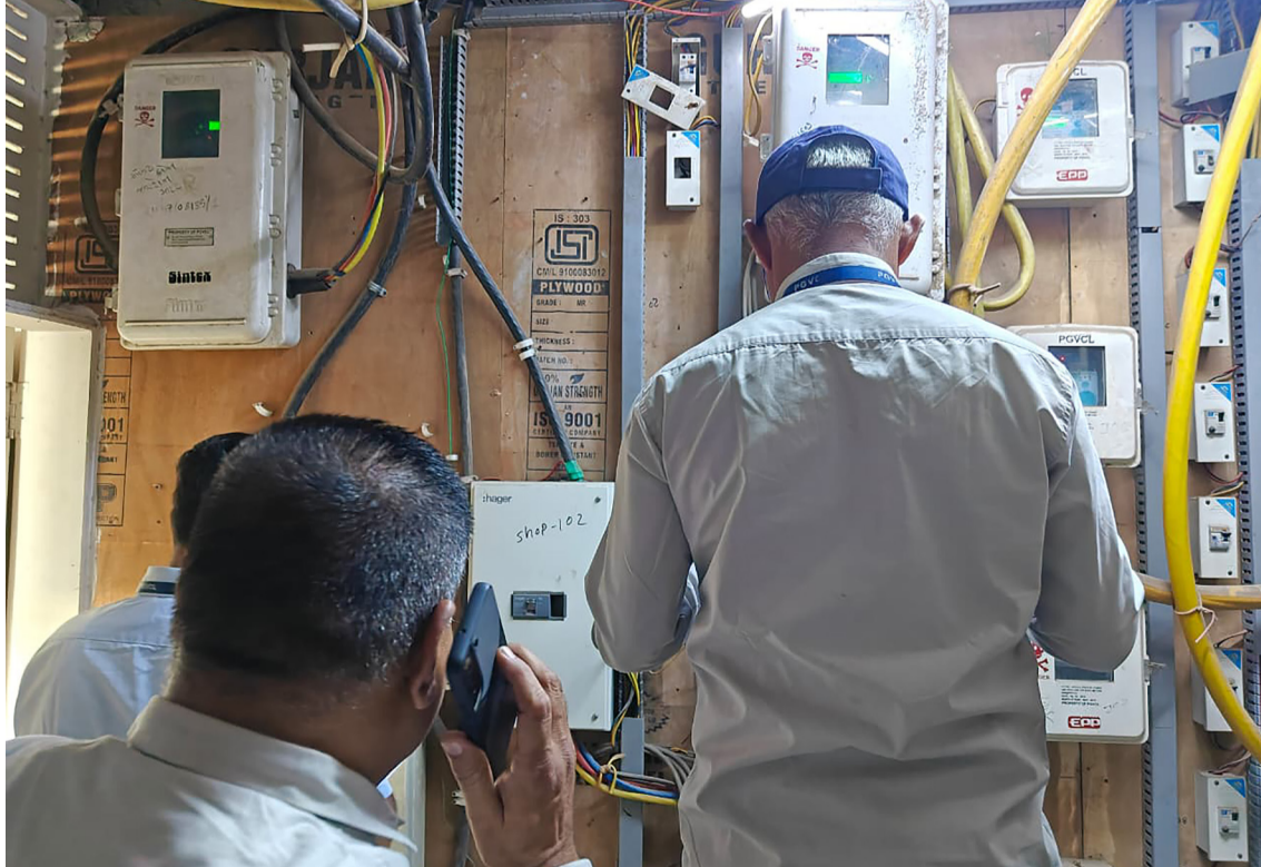
રાજકોટ, તા. ૨૬ આરકોને બિલની ભરપાઈ કરવા માટે અનેક વખત રજૂઆત કરવામાં આવી પરંતુ તેઓ સહેજ પણ ગંભીરતા ન દાખવતા અનેક

વખત તેઓને અપીલ કરવામાં આવી હતી પરંતુ હવે પીજીવીસીએલ દ્વારા વીજ કનેક્શન કાપવાની ખાસ ઝુંબેશ હાથ ધરવામાં આવી