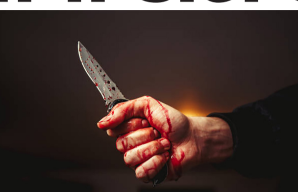
ગૂમ થયેલા યુવાનને શોધવા પોલીસે ચાર શકમંદોને ઉઠાવ્યા અને જળભાટ મચાવતી હકિકત ખુલી: જમીન મકાનના ધંધાર્થીની લાશ દાટી માથે સિમેન્ટ કોર્કટથી ધાબુ ભરી લીધું હતું: મોરબીની ચકચારી ઘટના

રાજકોટ, તા. ૨૬ કોઈ સરપેન્સ ધ્રીલર મર્ડર મિસ્ટ્રી બોલીવુડ ફિલ્મ અથવા તો વેબ શોની યાદ અપાવી દે તેવી હત્યાની કુર ઘટના બની છે. આ બનાવ મોરબી પંથકમાં બન્યો છે. ગૂમ થયેલા એક યુવાનની દાટી દેવાયેલી લાશ પોલીસે શોધી કાઢી છે. તે સાથે મર્ડર કાયદામાં ફેરફાર થઈ રહ્યો છે. લાશ બાદ લાશ જમીનમાં દાટી દઈ માથે સિમેન્ટનું ધાબુ ભરી લેવાયું હતું.