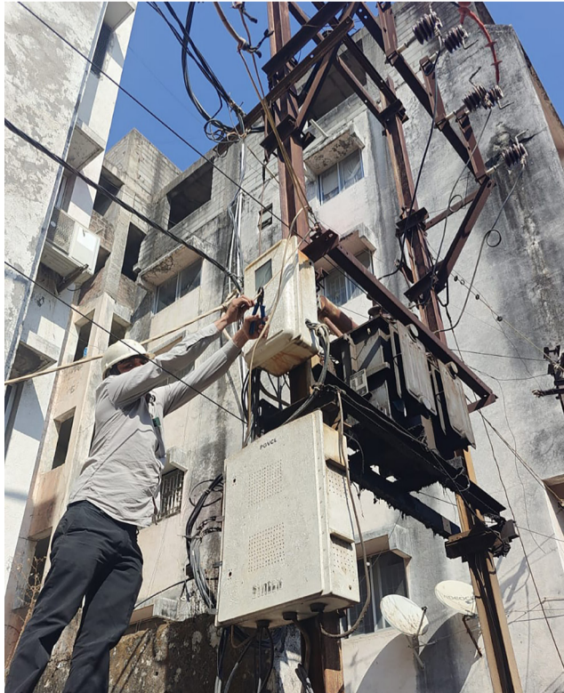
રાજકોટ, તા. ૨૬ મળતી માહિતી મુજબ છેલ્લા ઘણા સમયથી વીજતંત્ર દ્વારા બાકી બિલ હોય તેવા