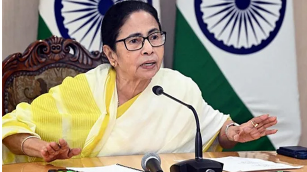
ચૂંટણી પંચ દ્વારા માસાંતે અંતિમ મતદાર યાદી કરાશે જાહેર

નવી દિલ્હી, તા. ૨૬ કોલકાતા - પશ્ચિમ બંગાળના મુખ્યમંત્રી મમતા બેનર્જીએ આશંકા વ્યક્ત કરી હતી કે ચૂંટણી પંચ દ્વારા આ મહિનાના અંત સુધીમાં અંતિમ મતદાર યાદી જાહેર કરવામાં આવશે ત્યારે રાજ્યની મતદાર યાદીમાંથી લગભગ ૧.૨૦ કરોડ મતદારોના નામ દૂર થઈ શકે છે. આ વિવાદાસ્પદ સ્પેશિયલ ઇન્ટેન્સિવ રિવિઝન (SIR) ક્વાયટ અંગે છે. દક્ષિણ કોલકાતાના ભવાનીપુર વિધાનસભા ક્ષેત્રમાં એક સભામાં મુખ્યમંત્રીએ આરોપ લગાવ્યો કે ભારતીય ચૂંટણી પંચ (ECI) “તાકિફ વિસંગતતા” કેસ હેઠળ મોટી સંખ્યામાં મતદારોની ઓળખ કરી રહ્યું છે. તેણીએ કહ્યું કે, “ભારતનું ચૂંટણી પંચ આટલી મોટી સંખ્યામાં નામોને તાકિફ વિસંગતતાના કેસ તરીકે ઓળખ્યા પછી તેમના નામ કાઢી નાખવાની યોજના બનાવી રહ્યું છે. સુધારણાની ક્વાયટ હજુ પણ ચાલુ છે. મને દુ:ખ છે. પહેલા, ગયા વર્ષે કિસેમ્બરમાં પ્રકાશિત થયેલી ફાઈટ મતદાર યાદીમાંથી ૫૮ લાખથી વધુ નામો કાઢી નાખવામાં આવ્યા હતા. પછી તેઓએ તાકિફ વિસંગતતાના કેસ તરીકે ઓળખ્યા પછી નામો કાઢી નાખવાની પ્રક્રિયા શરૂ કરી. મને શંકા છે કે જ્યાં