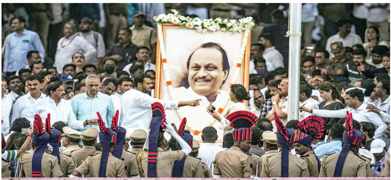
અંતિમયાત્રામાં 'દાદા અમર રહો'નાં ગગનભેદી નારાથી વાતાવરણ ગૂંચું