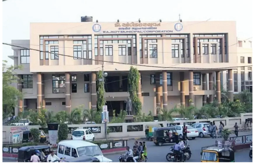
જાહેર થાય તે પૂર્વે ઘણા પડતર કામો છે તે શરૂ થઈ જાય તે દિશામાં હાલ પગલાંઓ લેવામાં આવી રહ્યા છે જેના ભાગરૂપે ગઈકાલે રાજકોટ મહાનગરપાલિકાના મેયર, સ્ટેન્ડિંગ ચેરમેન અને મ્યુનિસિપલ કમિશનરને સરકારે બોલાવ્યા હતા અને તેમની પાસેથી તમામ માહિતીઓ

રાજકોટ, તા. ૨૯ હાલ બજેટ ની તારીખો નજીક આવી રહી છે ત્યારે રાજ્ય સરકાર દ્વારા આગામી મહાનગરપાલિકાની ચૂંટણીઓને ધ્યાને લઈ લોકોનો ભરોસો જીતવા અને ચૂંટણીમાં ભાજપને કોઈ વિપરીત અસર ન પડે તે માટે અત્યારથી જ પાણી પહેલાં પાળ બાંધવાનું કામ શરૂ કરી દેવામાં આવવાનું પણ હાલ જણાવી રહ્યું છે. ગઈકાલે તમામ મહાનગરોના મેયર, સ્ટેન્ડિંગ ચેરમેન અને મ્યુનિસિપલ કમિશનરને નાયબ મુખ્યમંત્રી તથા મુખ્યમંત્રીએ બોલાવ્યા હતા જ્યાં તેમના વિસ્તારમાં અને શહેરમાં થયેલા કામો બાકી રહી ગયેલા કામો અને સરકાર પક્ષે જે કામગીરી થવી જોઈએ અને જે બાકી હોય તે તમામની વિગતો એકત્રિત કરી હતી.