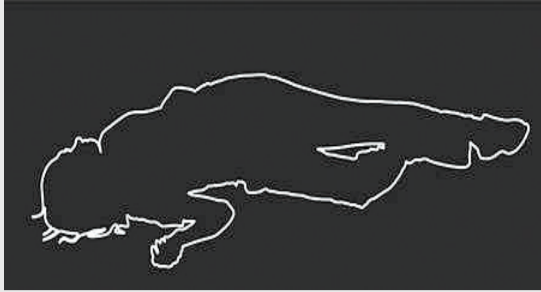
કપડાના દોરા કાપવાનું કામ કરે છે. શર્ટમાં દોરા કાપવાનું કામ કરતી હતી આવી પહોંચ્યો હતો. યુવતી કઈ વીચારે શર્ટમાં દોરા કાપવાનું કામ કરતી હતી તે પહેલા દાઉદે તેને બાથમાં ભીડી

જેમાં મકાન માલિક યુવક ભાડે રહેતી પરિણીતા પાસે પહોંચી ગયો હતો અને તેને બાથમાં ભીડીને કહેવા લાગ્યો હતો કે, તું મારી સાથે લગ્ન કરી લે નહીં તો હું મરી જઈશ. પરિણીતા વશમાં નહીં થતા યુવકે તેની પાસે રહેલી છરી કાઢી કરી દીધું હતું. યુવકે ગુસ્સામાં આવીને પરિણીતાના ભાઈ, બહેન તેમજ માતા ઉપર પણ હુમલો કરી દીધો હતો. આ સમગ્ર કિસ્સામાં પોલીસે એકતરફી ધરાર પ્રેમીને પાક ભણાવવા તેની રોમીયોગીરી ઉતારી નાખવા એકઆઈઆર દાખલ કરી છે. આગળની તપાસે માધવપુરા પોલીસે હાથ ધરી પોલીસ સુત્રોના કહેવા મુજબ માધવપુરા વિસ્તારમાં દરિયાખાન ધુમ્મટના છાપરામાં યુવતી તેના પતિ સાથે ભાડાના મકાનમાં છેલા આઠ મહિનાથી રહે છે અને ઘરે બેઠા