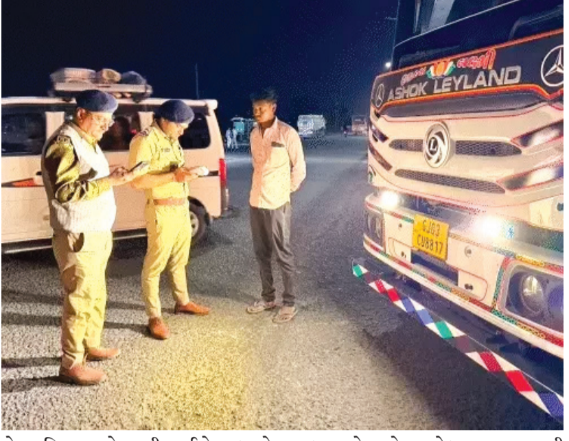
એ. રાત્રિના સમયે આવી લાઈટોના કારણે સામેથી આવતા વાહનચાલકોની આંખો અંજાઈ જતી હોય છે, જેના પરિણામે ગંભીર અકસ્માતો અને ક્યારેક માનવ મૃત્યુની ઘટનાઓ પણ બને છે. હાલ જે વિગતો મળી રહી છે તેને ધ્યાને

લેતા રાજ્ય સરકાર દ્વારા આદેશ કરવામાં આવ્યો છે કે આરટીઓ રાજકોટ તેમજ રાજકોટ શહેર અને જિલ્લા પોલીસ દ્વારા સંયુક્ત રીતે સ્પેશિયલ ડ્રાઈવનું આયોજન કરવામાં આવે જેના અનુસંધાને સઘન ચેકીંગ મુખ્ય માર્ગો અને હાઈવે પર કરવામાં આવ્યું હતું. ચેકીંગ દરમિયાન ૩૫ વાહન ચાલકો સામે કેસ નોંધી બે લાખનો દંડ પણ વસૂલવામાં આવ્યો હતો અને માત્ર એક જ ટિવસ પૂરતી ઝુંબેશ સીમિત નહીં રહેતા આવનારા ટિવસોમાં પણ આ સ્પેશિયલ ડ્રાઈવ યથાવત હાથ ધરાશે તેવું હાલ જાણવા મળી રહ્યું છે. અને જે કોઈપણ વાહન ચાલક આ પ્રકારની લાઈટ નો ઉપયોગ કરશે તો તેમની સામે કડક કાર્યવાહી પણ થશે.