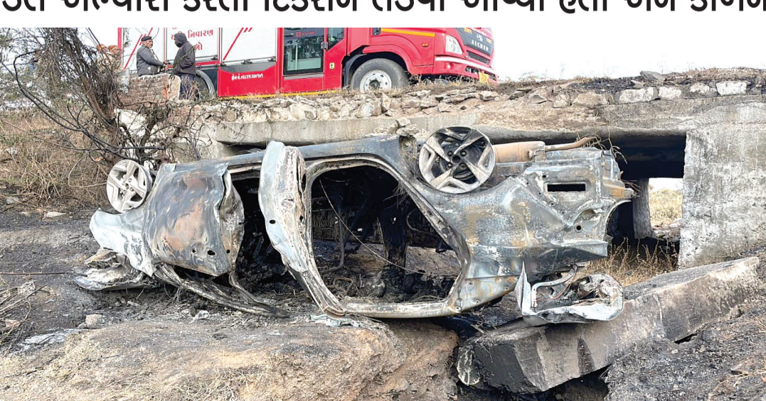
શુક્રવારની સવારે સર્જાયેલી આ ઘટનાએ સમગ્ર પંથકમાં અરેરાટી ફેલાવી દીધી છે. મૃતકોની ઓળખ મેળવવા તપાસ શરૂ કરાઈ હતી.

પરનો કાબૂ ગુમાવી દીધો હતો. જેના કારણે કાર રોડની સાઈડમાં આવેલા પુલ પરથી સીધી નીચે ખાબકી હતી. ચાઈ પરથી કાર નીચે પટકાવવાને કારણે તેમાં સ્પર્ક થતા અથવા ફ્યુઅલ ટાંકી ફાટવાને કારણે જોરદાર આગ ભભૂકી ઉઠી હતી. આગની જવાબાઓ એટલી ઝડપથી અને વિકરાળ રીતે ફેલાઈ ગઈ હતી કે કારમાં સવાર બંને મુસાફરોને બહાર નીકળવાની તક પણ મળી ન હતી. કાર જોતજોતામાં આગનો ગોળો બની ગઈ હતી અને અંદર રહેલા બાળક સહિત બન્ને વ્યક્તિઓ અગનજવાળામાં લપેટાઈ જતા જીવતા જ ભુંજાઈ ગયા હતા. આ બનાવની જાણ થતા જ હાઈવે પરના વાહનચાલકો અને આસપાસના ગામના લોકો તેમજ સ્થાનિક પોલીસ કાફલો તાકાલિત ઘટનાસ્થળે દોડી ગયો હતો.