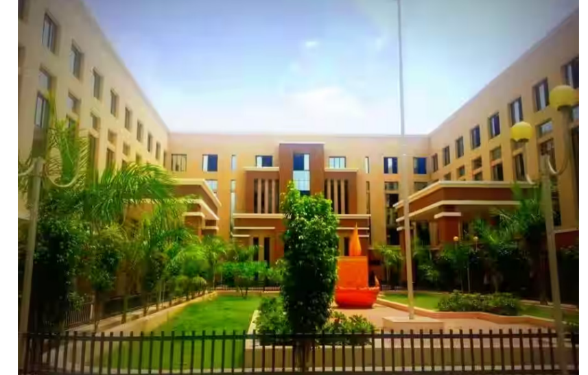
૭૨ નગરસેવકો માંથી માત્ર નવ કોર્પોરેટરો એ જ તમામ જનરલ બોર્ડ બેઠકમાં થયા સહભાગી

રાજકોટ, તા. ૨૮ મહાનગરપાલિકાની ચૂંટણીઓને હવે આડે ગણતરીના દિવસો બાકી રહ્યા છે ત્યારે પ્રવર્તમાન ચૂંટાયેલી બોડીની સમય સુધી પણ તુર્ત માંજ પૂર્ણ થઈ રહી છે. ત્યારે સમગ્ર ટ્રટ દરમિયાન અનેકવિધ બેઠકો ચોજવામાં આવી અને ખાસ જનરલ બોર્ડ પણ ઘણા ખરા ચોજાયા ત્યારે ચૂંટાયેલા નગર સેવકો દ્વારા પ્રજાહિત માટે અનેકવિધ પ્રશ્નો પૂછવામાં આવતા હોય છે જેમાં જનરલ બોર્ડમાં પ્રશ્નોત્તરી દરમિયાન કોર્પોરેટરો દ્વારા અનેકવિધ પ્રશ્નો પુછાય છે અને લેખિત જવાબ પણ તંત્ર દ્વારા આપવામાં આવે છે. હાલ એ બાબતના લેખાજોખા ચાલી રહ્યા છે જેમાં પ્રવર્તમાન બોડી દ્વારા વિવિધ મહાનગરપાલિકાની બેઠકોમાં કેટલા પ્રશ્નો પૂછવામાં આવ્યા છે તેનો તાગ મેળવવામાં આવી રહ્યો છે. છેલ્લા પાંચ વર્ષમાં ૩૮ જનરલ બોર્ડ બેઠક ચોજાયે તેમાં ઘણા ખરા નગરસેવકો દ્વારા જે સક્રિયતા દેખાડવામાં