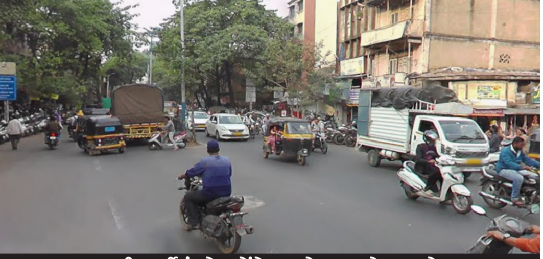
આમ આદમી પાર્ટીનું જોર કોંગ્રેસ માટે માથાનો દુખાવો : ચાલુ નગરસેવકોની નિષ્ક્રિયતા પક્ષ માટે પણ ચિંતાનો વિષય

પરિસ્થિતિ જોવા મળી છે જેને આજ દિન સુધી નિવારવામાં ભાજપ અને ચૂંટાયેલા કોર્પોરેટરો નિષ્ફળ નીવડ્યા છે. સામે વિરોધ પક્ષની વાત કરવામાં આવે તો આમ આદમી પાર્ટીનું જોર વોર્ડ નંબર છ માં વધુ જોવા મળી રહ્યું છે અને પરિણામ સ્વરૂપે તેની સીધી જ અસર કોંગ્રેસ પાર્ટી ઉપર પણ થઈ રહી છે. અત્યારે વોર્ડ છ માં ખરા અર્થમાં જંગ જામશે તેવું જાણકાર વર્તુળો કહી રહ્યા છે. ભાજપ માટે કાયદો એક જ છે કે તેમનું બુથ લેવલનું કામ છે અને જે કાર્યકરો છે તે દરેક પરિસ્થિતિમાં એડી ચોટીનું જોર લગાવી મતદારોને રીઝવી લે છે. જે કોંગ્રેસ અને આમ આદમી પાર્ટીમાં આ વિચારસરણી ખૂટે છે. સામે કોંગ્રેસ અને આમ આદમી પાર્ટી પાસે કોઈ એવા નક્કર રાજકીય આગેવાનો નથી કે જેની વાત ઉપર સામાન્ય જનતા ભરોસો મૂકી શકે અને તેઓને મત આપે. આ તમામ બાબતોની ગંભીરતાને ધ્યાને લઈ ભાજપની વોર્ડ