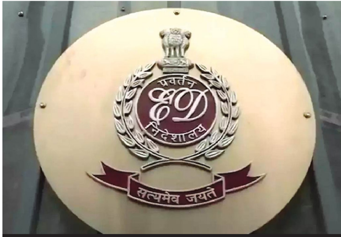
૮૦૦-૧૦૦૦ કરોડના રોકાણ છેતરપિંડીનો આરોપ : ૫૦૦ થી વધુ કેસ

આવાં એક એકથી ચડિયાતા ભજનો આપનાર ગંગા સતી, ઓગણીસમી સદી એટલે કે ઈ.સ ૧૮૪૬ માં જન્મ થયો, અને માત્ર ૪૯ વર્ષની ઉંમરે એટલે કે ૧૮૯૪ માં સમાધિ લીધી. પહેલાંની સ્ત્રીઓ પતિ પાછળ ચિતા પર ચડીને પોતાની જાતને બાળીને ભસ્મ કરી નાખતી, અને એ રીતે ગંગા એ પણ એમનાં પતિ કલ્હણગંજ બાપુ પાછળ સમાધિ લીધી, એટલે આપણે એને ગંગા સતી કહીએ છીએ, એમની સમાધિ પછી બે દિવસે પાનબાઈ એ પણ સમાધિ લીધી, અને આજે પણ સમાધિયાળામાં એમની સમાધિ જોવા મળે છે. ગંગા સતી આપણને પોતીકી લાગે છે, કારણ કે સાવ એકસોને ત્રીસ પાંચસ વર્ષ પહેલાંની આ વાત છે. એમણે ચોપડીનો કોઈ અભ્યાસ કરેલ ન હોવાં છતાં, એક એક શબ્દ આધ્યાત્મિકતાથી સભર છે! પતિ પત્ની બંને ભક્તિ અને વૈરાગ્યનાં પથિક હોવાથી ગામ બહાર એક ઝૂંડી બનાવીને રહેતા હતા! ભૂદરદાસજી નામનાં એક સાધુએ ગંગા સતીનાં આ ભજનોને લિપિ બદ્ધ કર્યાં! એટલે આપણને પણ આ આધ્યાત્મિક પદો મળ્યા, અને ઈતિહાસ સુધી પહોંચ્યાં. સદગુરુ કૃપા રહેશે તો એમનાં પદ પર ચિંતન કરીશું, પણ અત્યારે ફક્ત એક લાઈન “એકવીસ હજાર છસો ને કાળ ખાય”! માનવી દર એક ભિન્નિતમાં પંદર શ્વાસ લે છે, અને એ રીતે આખાં દિવસનાં, એકવીસ હજાર છસો શ્વાસ થયાં, અને કાળ એટલે મૃત્યુ એને પાઈ જાય છે. નરસિંહ મહેતાનાં પદ માં પણ વેદ વેદાંતી વાતો વણેલી હોય છે! આનાં પરથી સ્પષ્ટ નક્કી થાય છે કે, આવાં ગૂઢ તત્ત્વોથી ભરેલા જ્ઞાન માટે યુનિવર્સિટીમાં જવું જરૂરી નથી. તો ગંગા સતીના વરણોમાં શત શત વંદન કરીએ, અને એમનાં ભજનો થકી આધ્યાત્મિક સફર ખેડી શકીએ, એમણે પીરસેલું અમૃત પચાવીને આપણે પણ આત્મબોધ પ્રાપ્ત કરી શકીએ, તો એમનો આ જન્મ શુભ મંગલની સર્વોપરિતા માટે સફળ થયો ગણાય. જય ભવાની!